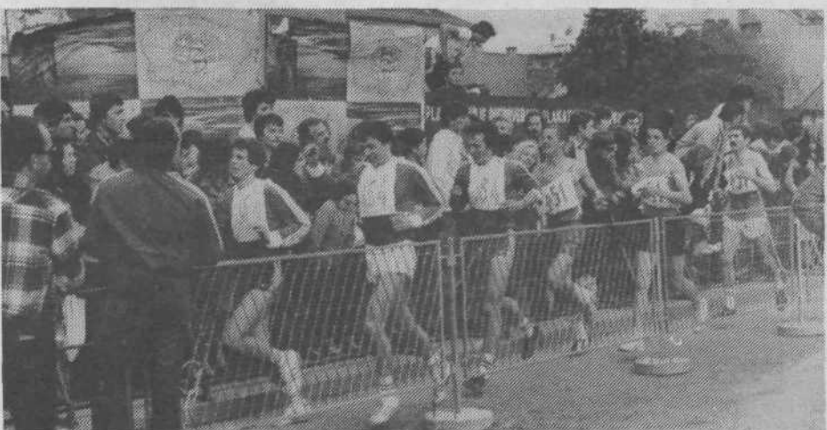
V cilju so zmagovalci partizanskega marša za moške s startno številko 164. Kljub temu, da so morali preteči kar 25 km, so prišli na start sveži in veseli in kar je najvažnejše – skupaj, sicer uvrstitev ne bi štetla.