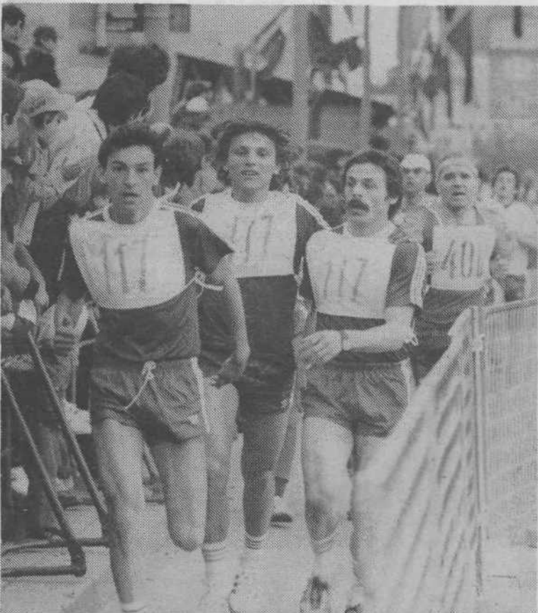
Še en posnetek s cilja partizanskega marša na 25 km za moške. S številko 117 so startali sami mladi, vendar so bili na cilju kar precej utrujeni. Nazadnje niso mačje solze preteči v troje kar 25 km.