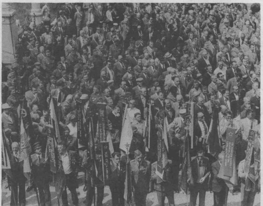
V soboto so slavili 35. obletnico ustanovitve slovenske divizije Vojske državne varnosti. Zbor enot VDV, ki je ob tej priložnosti razvil svoje prapore, se je nadaljeval v šolskem centru RSNZ v Tacnu, kjer je bilo že tradicionalno srečanje udeležencev NOB. Vsi so se tudi udeležili pohoda Po poteh tovarštva in spominov.