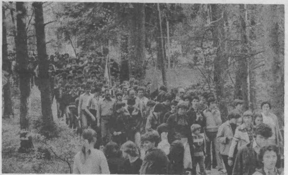
Vseh manifestacij pohoda Po poteh tovarštva in spominov in pohoda Po poteh partizanske Ljubljane se je letos udeležilo več kot 80.000 udeležencev iz vseh krajev naše domovine in tujine.