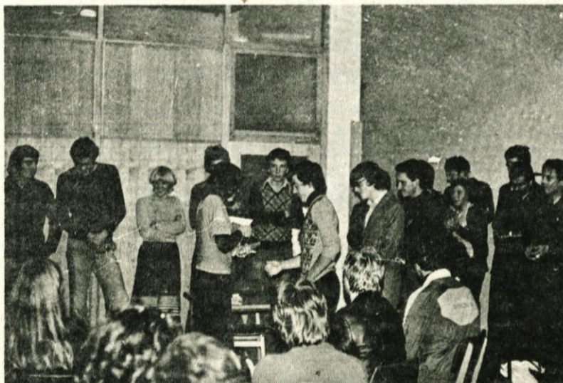
Del tekmovalcev na kviz tekmovanju „Montreal 76“

Gledalci so bili zadovoljni, ker so preživeli večer v prijetnem vzdušju, vsi pa smo si bili edini v tem, da je to zvrst klubske dejavnosti potrebno v bodoče še razvijati in ji dati pomembno mesto pri kreiranju in razvijanju mlade osebnosti in jo s to obliko aktivirati v zavest-