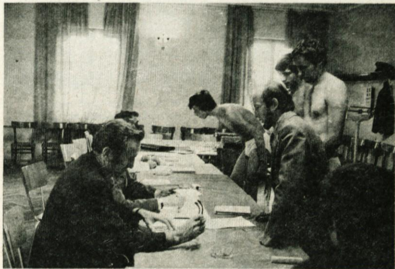
Vojaški nabor ni več samo pregled telesnih in duševnih sposobnosti naših mladincev, ampak tudi usmerjanje le-teh v posamezne rodove Jugoslovanske ljudske armade in organizirane šole na vojaškem področju

S sprejemom sklepov svetov KS o imenovanju odborov za ljudsko obrambo in družbeno samozaščito je bila zaključena prva faza obrambnih priprav v KS.