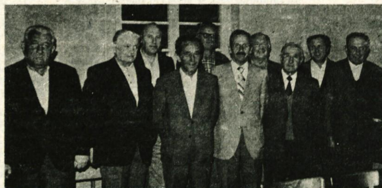
Gradbeni odbor v Radomljah, ki je pred 13 leti izpeljal to veliko akcijo