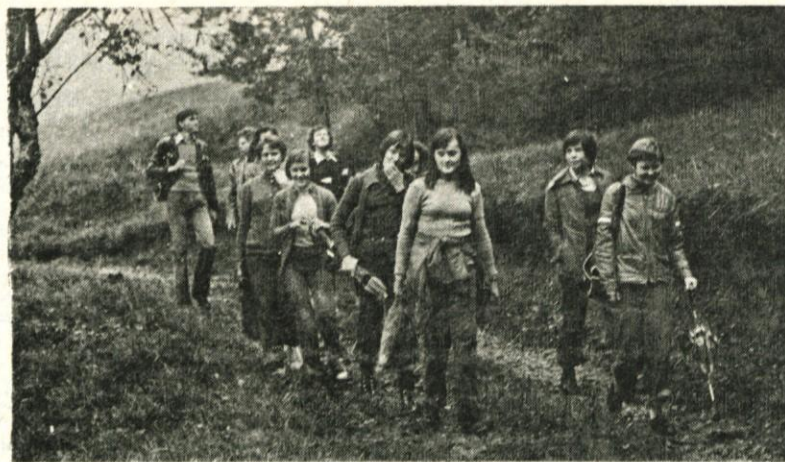
Del pionirjev na pohodu po poteh Radomeljske čete