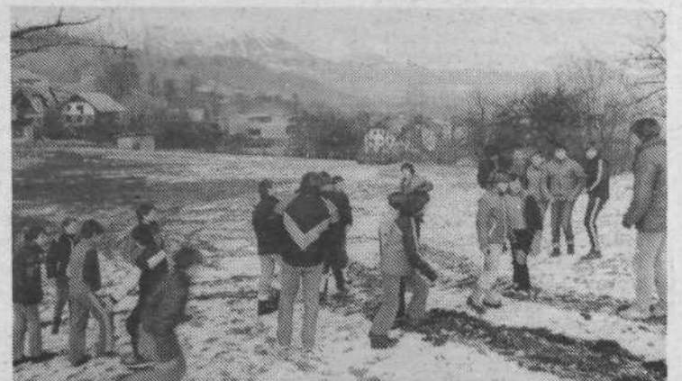
Takrat, ko je bila tale skupina v Gorjah, je bilo tam snega le za vzorec. Namesto smučanja je sem ter tja padla le kaka kepa.