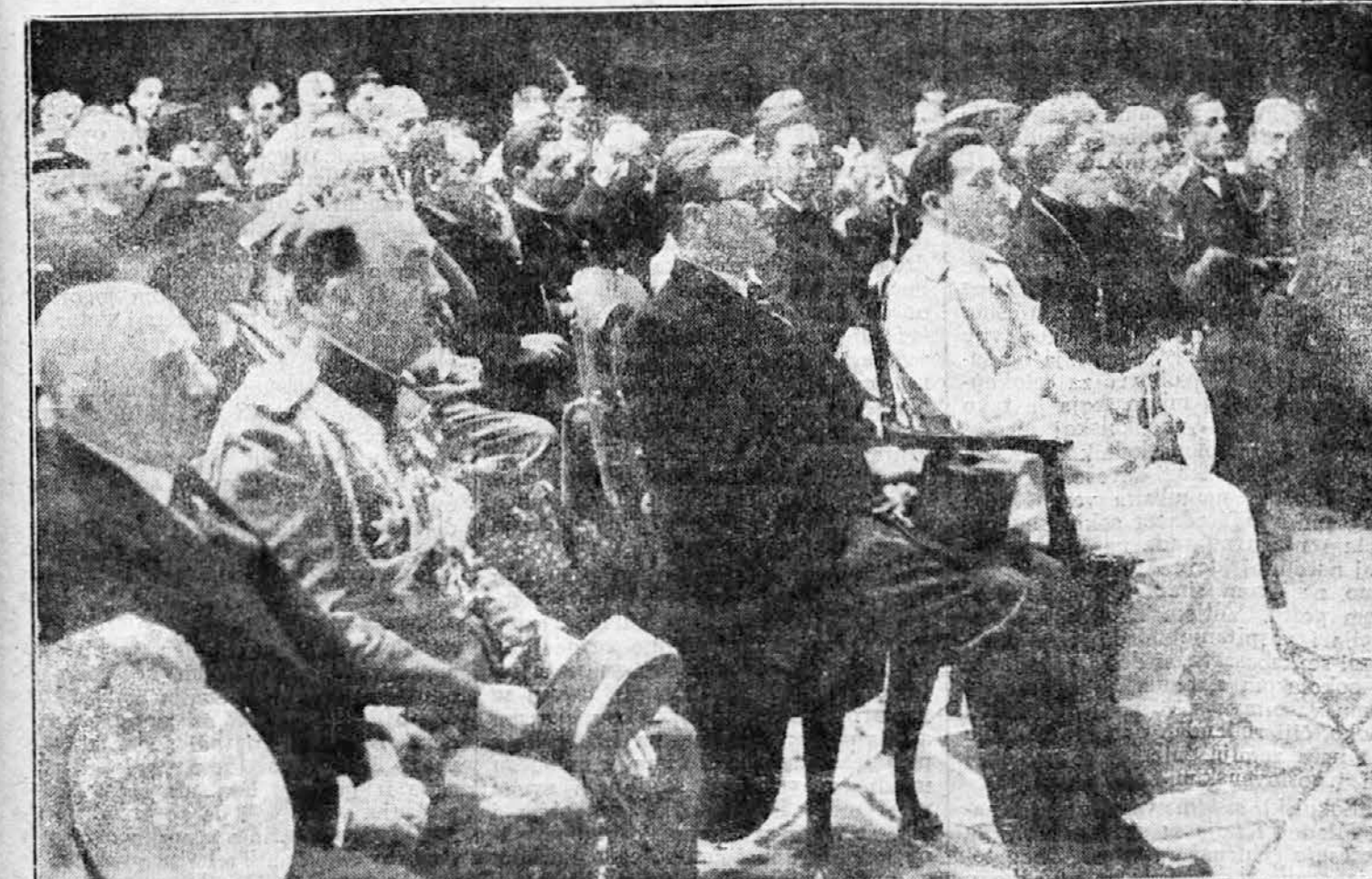
Izaslanik Nj. Vel. Kralja i predstavnici vlasti na sokolskoj proslavi Kraljevog rođendana na Kolarčevom univerzitetu

— Sve ono na što smo se odlučili svojom slobodnom voljom, sve ono što danas osećamo i što želimo da izvedemo, po inicijativi bratske Sokolske župe Sarajevo, a što ćemo i izvršiti u narednih pet godina do Kraljeve punoletnosti, čučemo na današnjoj svečanoj sednici. Tei našoj težnji i svemu našem sokolskom žiću i biću dali smo osnovicu već prvog dana našeg sokolskog ujedinjenja u Novom Sadu pre sedamnaest godina. A danas mogu i moram sa zadovoljstvom da na glasim, da u toku našeg zajedničkog sokolskog života nikada nismo sustali niti skretali ni na levo, ni na desno (odobranje), nego smo uvek išli ravno, iako teško, često trnovitim stazom sokolske radnosti, a tako moramo i nadalje da kroćimo ravnom cestom, svome postavljencem uzvišenom cilju, kroz sve vihore sadašnjice i ne žaleći žrtava (odobranje). Preduboko su nam se urezale u dušu velike reči blagopokojnog Viteškog Kralja Aleksandra I Ujedinitelja (svi prisutni ustaju i kliče: »Slava Mladi«), koje je izrekao u svojoj znamenitoj deklaraciji dne 6 januara 1929: »Moja je sveta dužnost, da svim sredstvima čuvam državno i narodno jedinstvo. I ja sam rešen, da ovu dužnost bez kolebanja izvršim do kraja. Čuvati jedinstvo na-