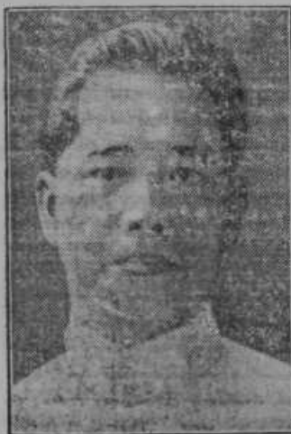
Kitajski ministrski predsednik in zunanji minister Wang-Čingvej je postal srčna žrtev atavizma.

Tajne spletke med Italijo in Nemčijo. Anglija in Francija se ne moreta prav sporazumeti glede izvajanja sankcij napram Italiji. Ta nesporazum hoče Italija izrabiti v svoje dobro in je pričela tajne spletke z Nemčijo. V Monakovem se je vršil v minulem tednu velik zbor narodno-socialistične stranke. V Monakovo se je pripeljal tudi zastopnik Italijanov v Ženevi baron Aloisi, kjer je imel sestanek z namestnikom Hitlerja, z enim nemškimi ministrom in z drugimi odločujočimi osebnostmi. Po Aloisiju je sporočil Mussolini Nemčiji pogoje za sklenitev vojaške zveze med Nemci in Italijani za slučaj, da bi došlo v Evropi radi vojne v Abesiniji do zapletljajev. Mussolini bi žrtvoval tudi Avstrijo, ako bi se Nemčija postavila v sedajnem položaju na stran Italije in bi podprla njene težnje in zahteve. Hitlerjevi zastopniki so vzeli Mussolinijeve predloge na znanje in se bo vršil prihodnji teden tozadevni sestanek nekje v Gornji Italiji.