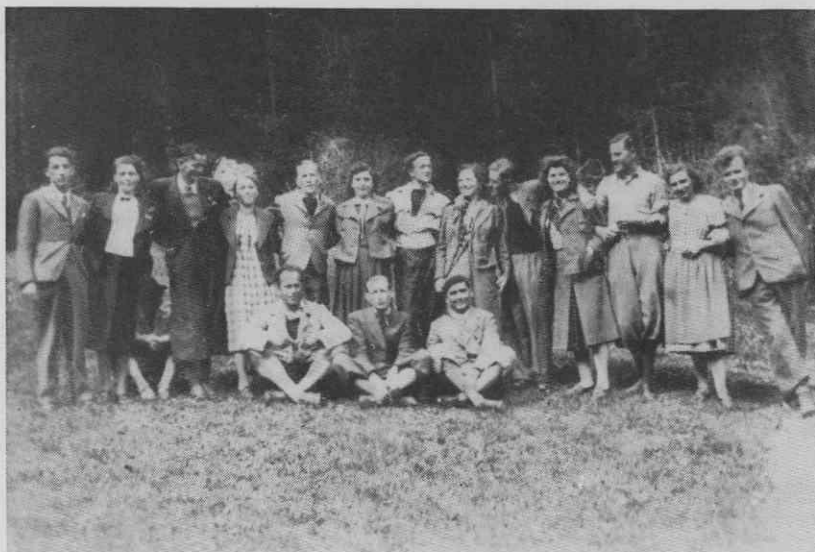
Kolektiv Vidmarjeve tovarne nogavic in dežnikov v Savljah na izletu za 1. maj 1939

podstrešje so uporabili za skladišče. Poslopje je dobilo vodovod, elektriko, centralno kurjavo, ventilacijo in kanalizacijo. Sosednja pritlična zidana stavba je bila postavljena za sanitarije in zraven lesena lopa za mizarno in skladišče. V prvih tridesetih letih so sezidali še dimnik in ograjo ter tlakovali vmesni prostor med cesto in objektom I. Nova gradbena dejavnost je podjetje zajela ob začetku druge svetovne vojne. Sem velja prišteti leseno shedovo konstrukcijo z opečnim zidom, krito s salonitom, spodaj opaženo in ometano (objekt II b), ki so jo uredili za kurilnico s skladiščem za premog, barvarno in oblikovalnico. Pozabiti ne smemo bazena in nadstreška iz salonitne plošče za kolesa. Večjo medvojno gradbeno akcijo pomeni nadzidava prvotnega hleva za eno nadstropje (objekt II a), kjer so namestili šivalnico. Napeljana je bila elektrika, centralna kurjava, vodovod in kanalizacija. Poleg je zrasel prizidek — pritlična stavba