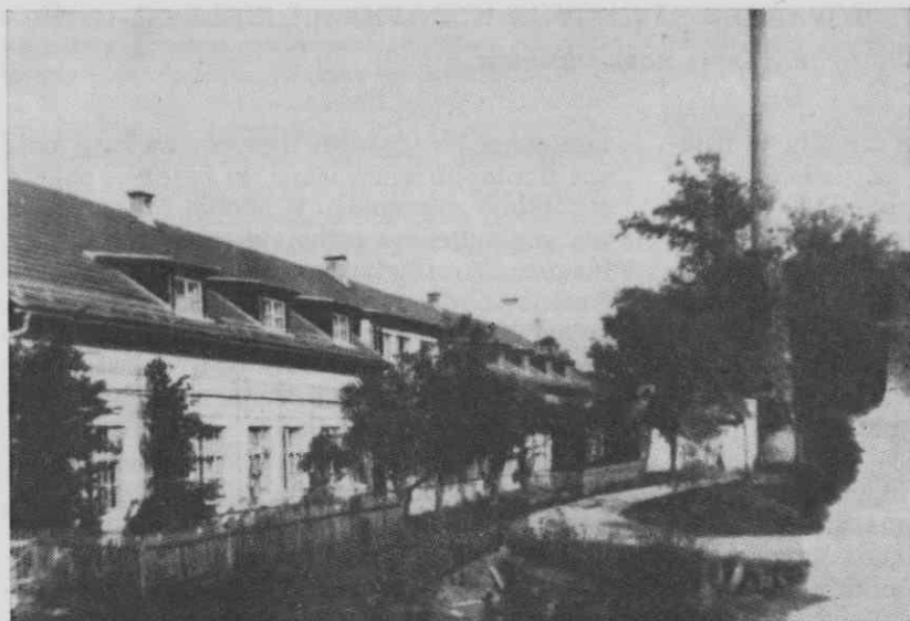
Vidmarjeva tovarna nogavic in dežnikov v Savljah (danes Tonosa) v stari Jugoslaviji

lavk, ob sezoni pa kar 60. Profesionalist je zaslužil okrog 2000 dinarjev mesečno, ostalim pa se je plača sukala pri 1000 dinarjih. Tekoči račun je podjetje imelo pri Ljubljanski kreditni banki. Razpolagalo je z 2 milijonoma kapitala. 5 Omeniti velja še 3 trgovine v Ljubljani, 1 v Zagrebu in 1 v Splitu. 6