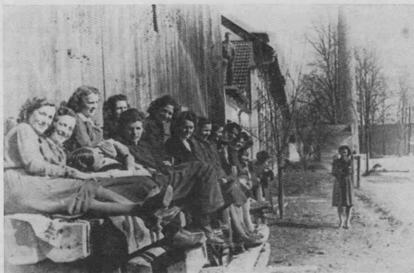
Delavke Vidmarjeve tovarne nogavic in dežnikov v Savljah pred zakloniščem leta 1943