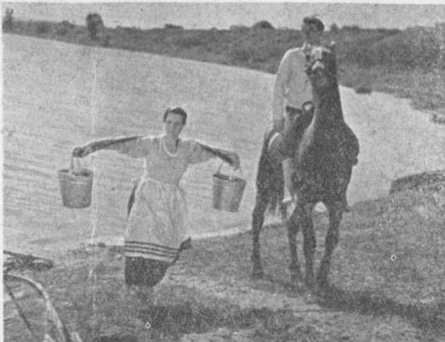
Na sliki prizor iz barvnega filma »Tih Don«.

Za rusko filmsko produkcijo sta značilni dve obdobji: prvo, ki bi ga lahko označili z izrazom platneni domovinski heroizem in sega nemara še v petdeseta leta tega stoletja, in drugo, satirično,