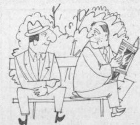
Vi sedite na klobuku. Res? Mislim sem, da je vaš.

Kdor ni nikoli nič zgrešil, je bil po pomoti rojen.