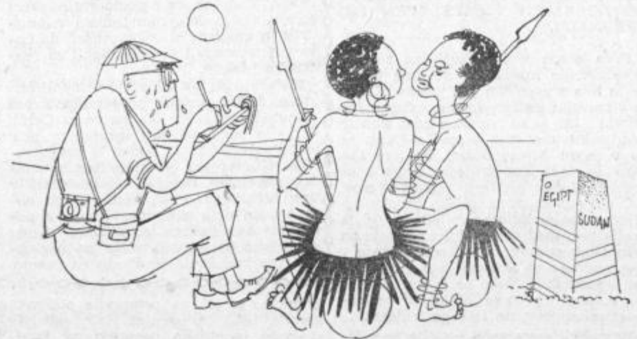
Novinar ob sudanski meji: »Torej ste za plebiscit. Domačinka: »Kaj praviš, bi ga skuhala ali spekla?«