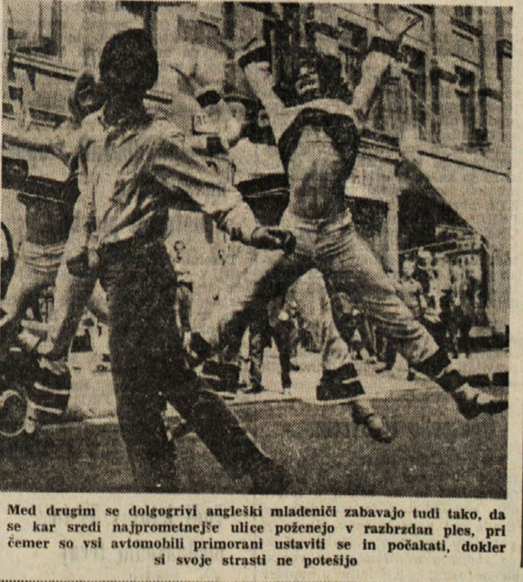
Med drugim se dolgovrvi angleški mladeniči zabavajo tudi tako, da se kar sredi najpomembnejše ulice poženejo v razbrzdani ples, pri čemer so vsi avtomobilski primorani ustaviti se in počakati, dokler si svoje strasti ne potešijo