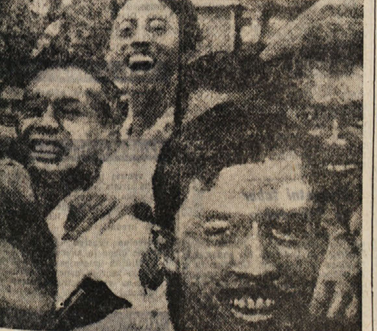
Kongres na ulici ali poseganje indonezijskih študentov v politično življenje

Na marburški univerzi, ki sodi med najstarejše nemške visoke šole, so pred nedavnim odprli prve univerzitetne jasli v Evropi. V enem od stanovanjskih poslopij, ki je bilo urejeno prav v ta namen, se ustrezno strokovno osebe že ukvarja z osemindesetimi dojenčki do tretjega leta starosti. Tako se staršem, ki se študirajo, nudi možnost, da se brez skrbi lahko poglabljajo v svoje delo, s čimer jim je omogočeno, da svoj študij pravočasno kontakto. V Franciji skušajo zdaj na lyonski univerzi slediti marburški primeru, da odprejo podobne otroške jasli. Nedvomno gre za primer, ki bi ga lahko še marsikje posnemali, saj je mladih študentskih »parov povsod na svetu čedalje več.