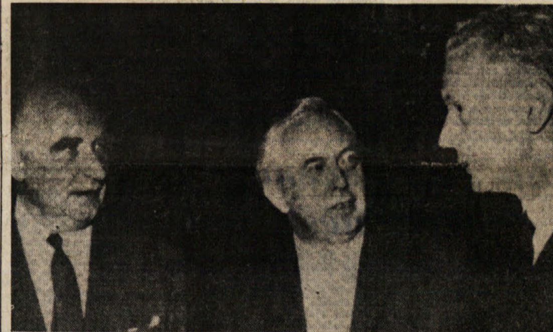
Predsednik britanske vlade Wilson (na sredi) in predsednik francoske vlade Pompidou (levo) in de Murville (desno)

Zlasti se ni nič premaknilo glede skupnega tržišča in glede nekaterih važnih mednarodnih vprašanj