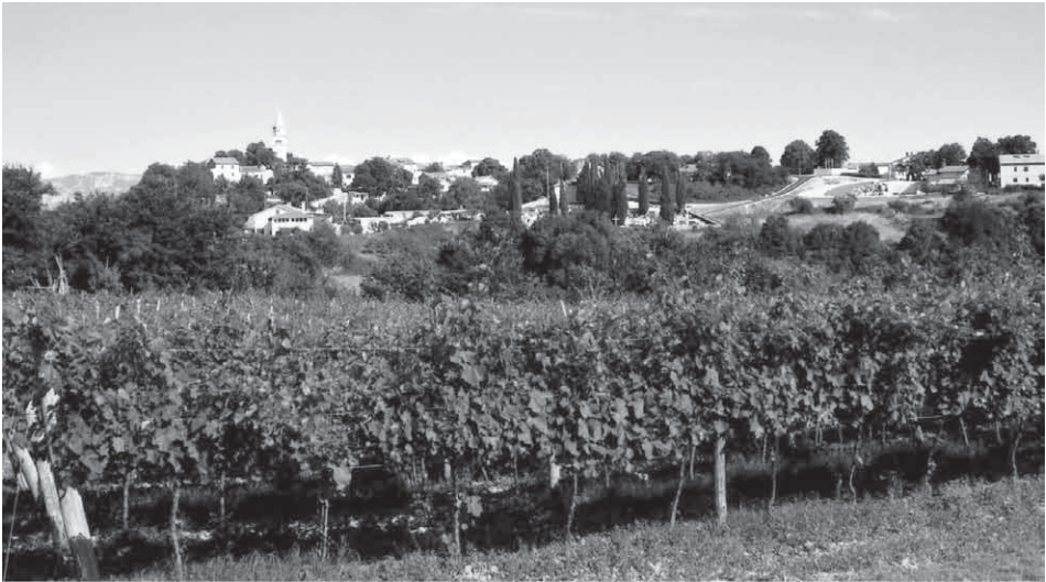
Slika 2. Zaselek Gračišće, jugovzhodno od Pazina na Hrvaškem Figure 2. The village Gračišće, southeast of Pazin in Croatia Foto (Photo): V. Mikuž 2008