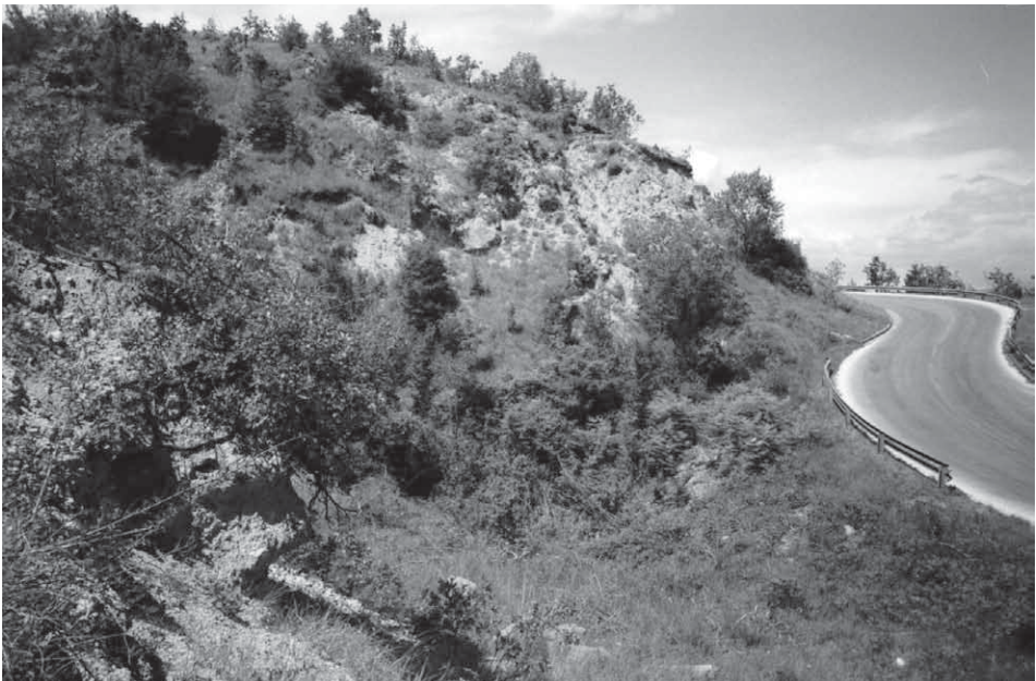
Slika 3. Izdanki srednjeeocenske olistostrome ob cesti Gračišće–Pićan Figure 3. The outcrops of Middle Eocene olistostrome along the road Gračišće – Pićan