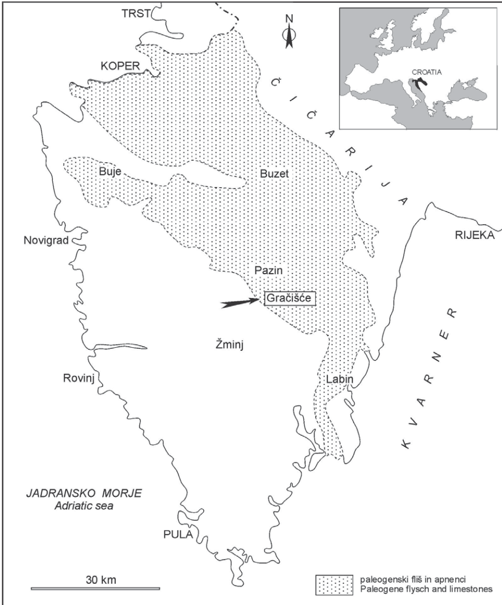
Slika 1. Geografski položaj najdišča Gračišće pri Pazinu v Istri

ke paličaste in nepravilne oblike, ki jim dolgo časa nismo posvečali večje pozornosti. V prerezi imajo okroglo, ovalno do subkvadratasto obliko. Na obeh