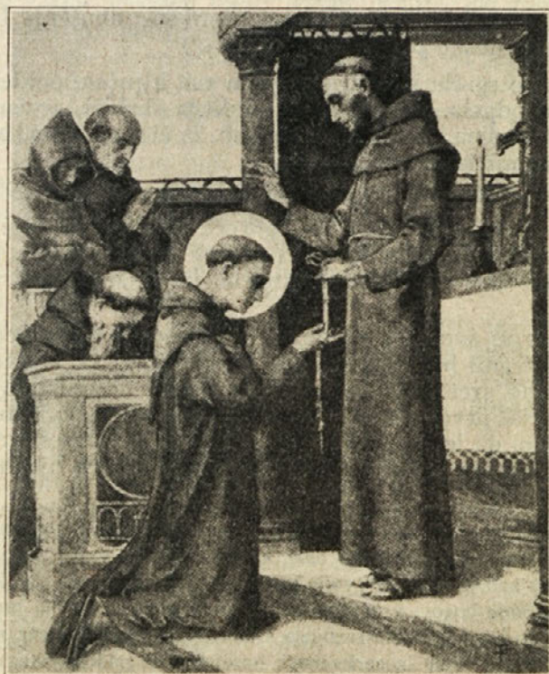
Sv. Anton prejme Frančiškovo obleko.

Dva brata frančiškana ga v celici preoblečeta v redovno haljo bratov frančiškanov, slovo se ima vršiti v cerkvi.