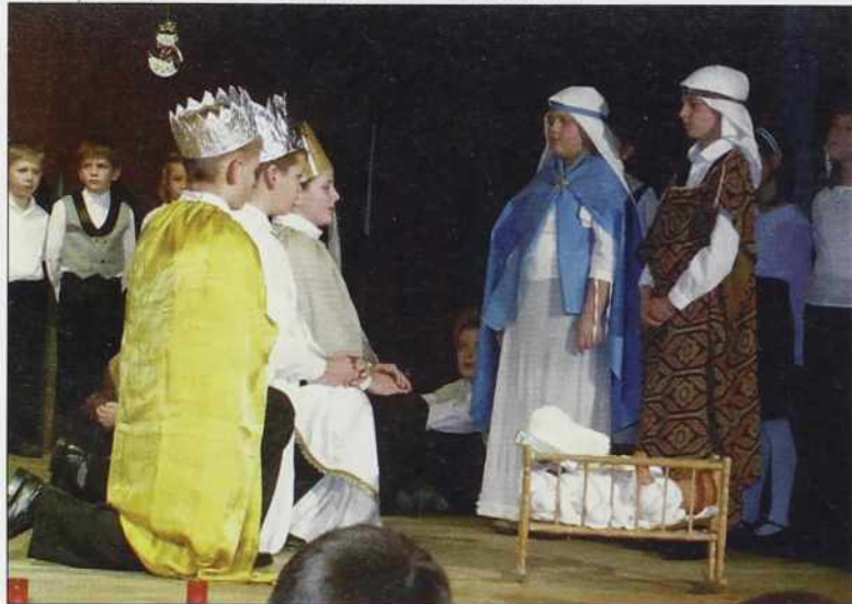
Trije kralji v betlehemiški štalici

in dedki so bili vznemirjeni in zgovorni. In slišalo se je veliko pogovorov v domačem slovenskem jeziku, kar me je posebej navdušilo.