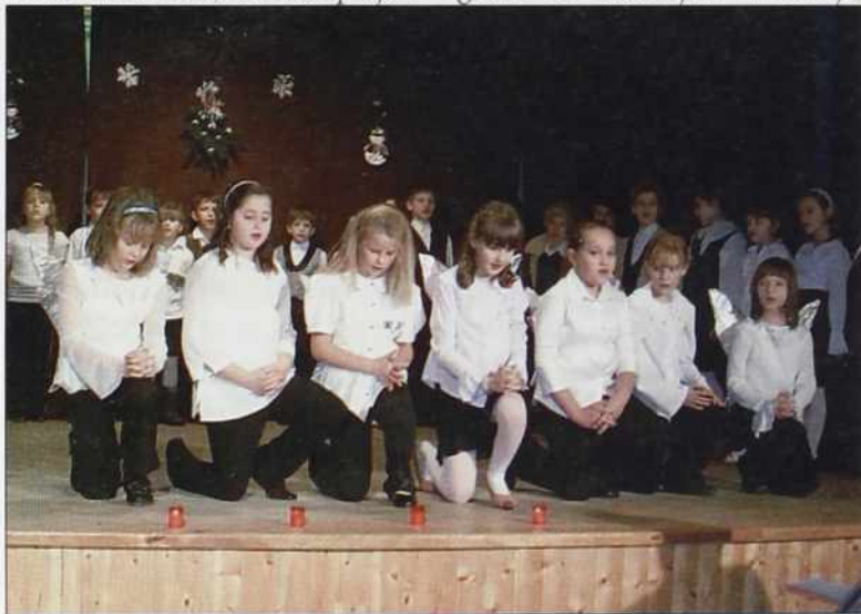
Lep prizor s prireditve