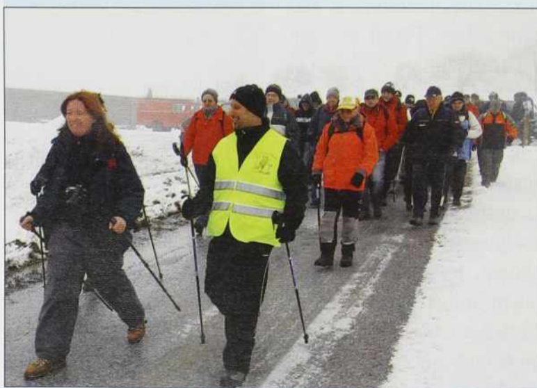
Začetek pohoda trej kralov po Pouti po dolaj pa bregaj se je začno pri vaškom daumi v Būdincaj

Pohod trej kralov se je začno pri Vaško-gasilskom daumi v Būdincaj, gde so pohodnike od daleč in blūzi (cejli autobus je prišo iz Lublane, bili so pohodniki s Primorske