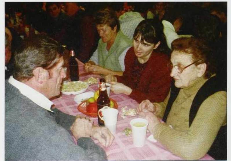
Malo smo goškice tō lüпали

kulturne skupine, stere delajo v vesi. Tau so gasilsko društvo, športno društvo Srebrni brejg, cerkveni pevski zbor sv. Cecilije, folklorna skupina pa Mešani