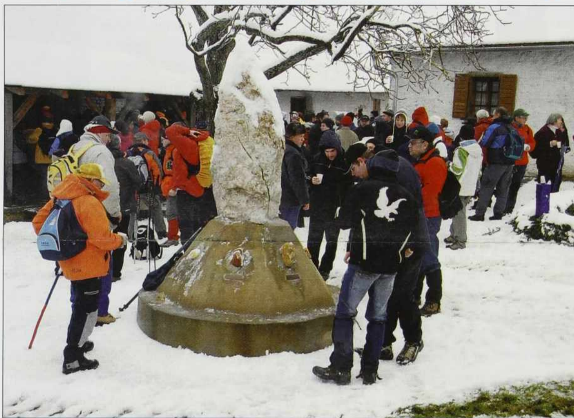
Pohodniki v Andovcaj pri Malom Triglavi

Če bi mi nekak po takšni napovedi pravo, ka se 9. januara zberé v Būdincaj kauli dvejstau pohodnikov, bi ma gvüšno nej dala valati. Dapa leko, ka je ranč tau vrejmen napravilo te pohod za nika ejkstra, za ovakšoga, kak so vsi drugi pohodi. Istina, ka na būdinske pohode po Pouti po dolaj pa bregaj ovak tō dvakrat, trikrat telko lidi pride kak na druge pohode po Goričkom. Največkrat majo od 350 do 400 lidi. Pout po dolaj pa bregaj, za stero si je največ prizadevo pa delo Vendel Žido ml., je bila uradno oprejšta lani geseni. Paut je označena, zatok go leko nūcajo nej samo organizirani pohodniki, liki posamezniki tō, na njej so vōsklajene informacijske table, gde si leko poglednejo, gde odijo (po nekdenišnji granici, na najsevernejšom punkti Slovenije itd.).