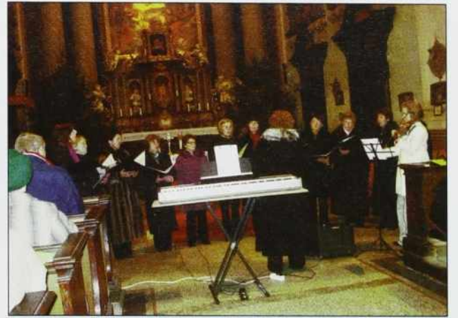
Ženski pevski zbor Marjetice

Obilo prireditev v adventu je ponujalo duhovno pripravo na božične praznike tudi Porabskim Slovenkam in Slovencem v vseh krajih Porabja in tudi v samem mestu Monoštru. Začeli smo 28. novembra v cerkvi v Trauščaj z adventnim koncertom in blagoslovitvijo adventnih vencev in zaključili 20. decembra v baročni cerkvi v Monoštru s slovensko mašo in božičnim koncertom.