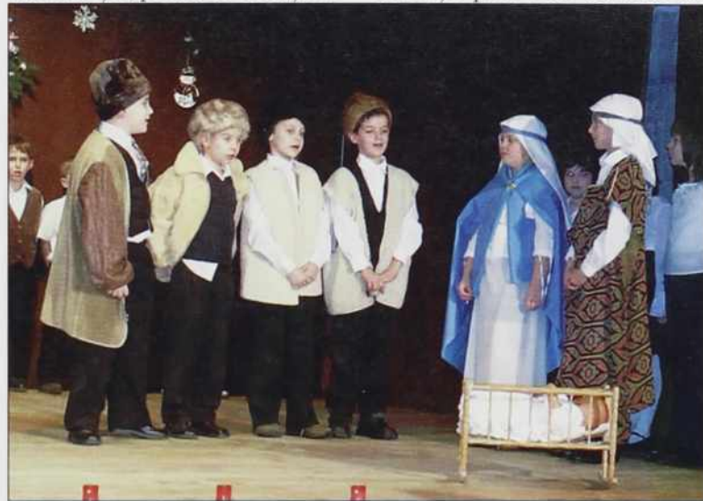
Jezusa so obiskali tudi pastirci

v spontanosti in izredno lepem izgovoru slovenskih besedil (recitatorji so razumeli, kaj govorijo) je bil poglobitveni čar prireditve. Še enkrat se mi je potrdilo, da otroci, ob pomoči prizadevnih učiteljev, zmorejo prav vse. Seniška bo-