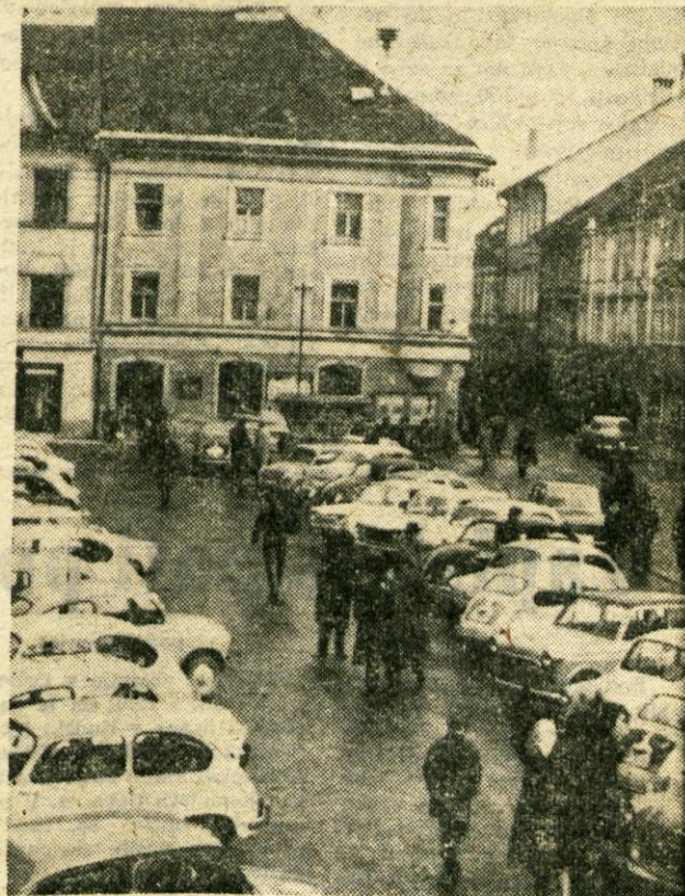
Poleg hitro naraščajočega domačega prometa se v Kranju kot središču turistične Gorenjske zlasti sedaj, v sezonskem času, zaustavlja mnogo tujih vozil. Posnetek na Titovem trgu prikazuje vsakodneveni pojav. To sicer pomeni zaslužek gostinstvu, trgovini itd., hkrati pa hudo zaostruje težave cestnega prometa v starem delu mesta

V ta namen je poštno podjetje Kranj že odobrilo milijon dinarjev, ki ga bodo porabili za organizacijske priprave in za izvedbo zleta samega. Zlet naj bi predvidoma trajal tri dni, in sicer dva dni bi bili razgovori med predstavniki mladine podjetij, zadnji dan pa bi se vsi udeleženci odpeljali na izlet, zvečer pa bi bila zabava s slovesnim zaključkom. Lansko leto je bil podoben zlet v Ulcinju v Črni gori.