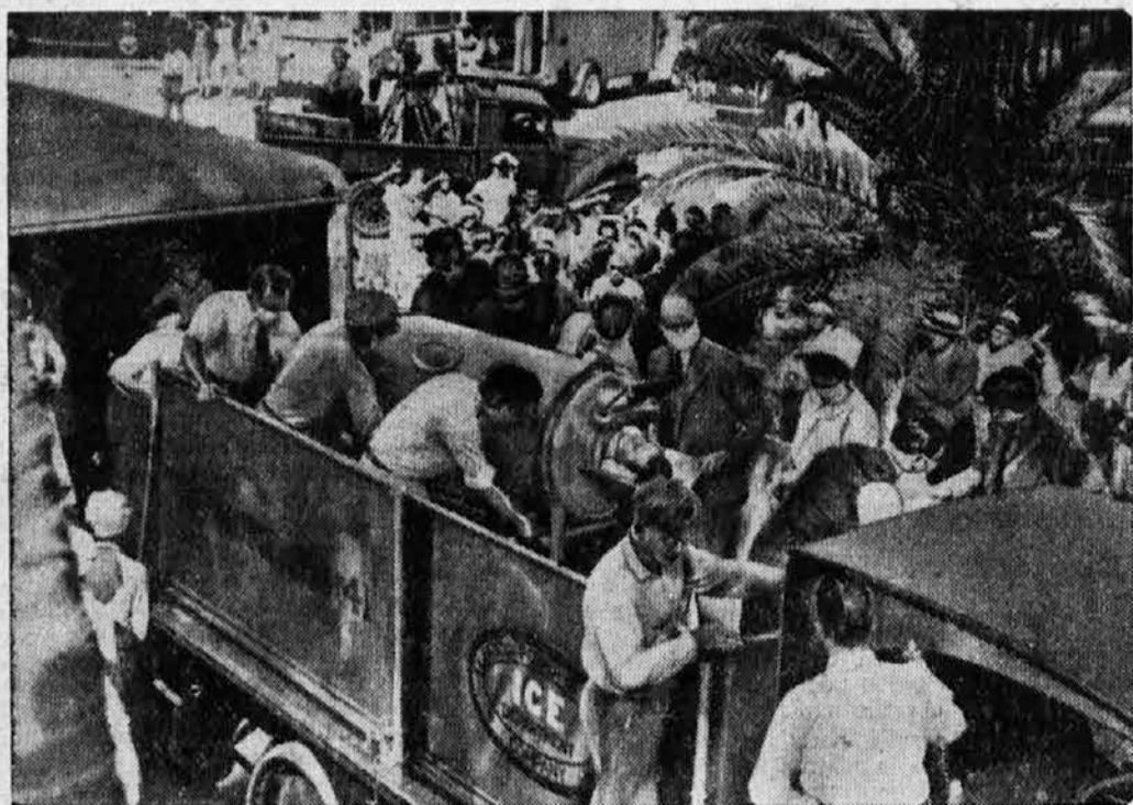
Takole so prepeljali iz Vzhodne Azije v ameriško Florido 27-letnega sina ameriškega milijonarja. Zdravniki so ga mogli rešiti le na ta način, da so zanj napravili umetna »železna pljučca«, t. j. pripravo, s pomočjo katere bolnik lahko diha. Na sliki vidimo valjasto pripravo, iz katere gleda bolnikova glava

Petek, 3. decembra: Belgrad-Zagreb: 20 Klavir, 20.30 Petje — Dunaj: 19.25 Plesna glasba, 20.05 Zalogra, 22.30 Orkester — Budimpešta: 19.45 Petje, 21.40 Orkestralni koncert, 23.05 Jazz — Trst-Milan: 17.15 Plesna glasba, 21 Simfonični koncert — Rim-Bar: 21 Opera »Paganini« — Praga: 20.05 Prenos iz Smetanove dvorane, 21.55 Plošče, 22.15 Prenos iz gledališča — Paršava: 20 Simfonični koncert — Berlin: 20 Eiharmonični koncert — Königsberg: 19.15 Plošče — Hamburg: 19.10 Glasba — Zabavni program, 21 Glasba — Vraštava: 19.10 Glasba — Lipsko: 19.10 Glasba — 20.45 Baletna glasba — Köln: 19.10 Plesna glasba, 21.10 Glasba — Beromünster: 20 Opera.