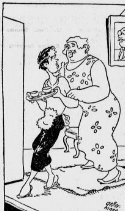
Da boste vedeli, Pepa, klepetanje in opravljanje mi je zoperno. Nočem, da bi postajali po veži in klepetali. Če pa kdaj kaj zammivega izveste, mi morate seveda povedati!

Vendar ni odnehal. Slednjič se mu je posrečilo priti z letalom pod večji roj in začel je z njimi tekmovali. Roj je letel zelo visoko nad njim. Ko je letalec začel tekmo, je brzinski kazalec kazal, da letalo brzi 250 km na uro. Brzina je pa vedno naraščala ter kmalu dosegla 300 km na uro. Tako je šlo nekaj časa. Deževniki so to naglico brez težav zmagovali. Ko so se je pa menda naveličali, so svojo hitrost znova povečali in dosegli kmalu 350 km na uro. Tako naglo so poslednji deževniki leteli. Dayton je sedaj nagnal svoj stroj v največjo brzino, toda že čez 200 km je spoznal, da ga ptiči počasi puščajo zadaj. Čez nadaljnjih 50 km pa so ptiči letalca pustili že daleč zadaj. Kmalu so mu izginili izpred oči. Letalec je že poprej ugotovil, da tako hitro deževniki lete lahko celih 4000 km daleč.