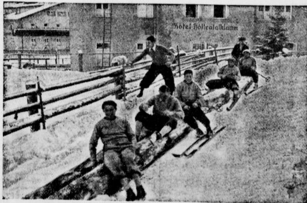
Tudi Italijani so že prišli v Garmisch-Partenkirchen na olimpijsko tekmo. - Pri treningu so srečali bavarskega drvarja, ki so po njegovih blodih zdržali v doline.