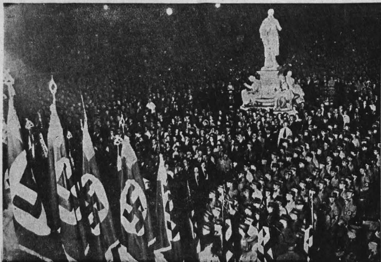
Velika množica hitlerjevcev je poslušala na trgu pred mestno hišo v Hamburgu govor, s katerim je “Fuehrer” zaključil kampanjo za plekiscit

Albantija in Rusija sta pretekli dni navezali redne diplomatske odnose.