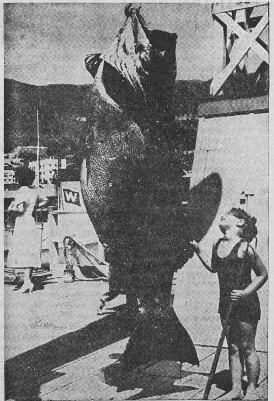
Orjaška riba in pritlikavo dekletce

Solospev "Ptička" je bil prilično dobro zapet, dasi je bila pevka nekoliko prehlajena. Pri solospevu "Nezakonska mati" se je glas izgubil v premočnem spremljevanju orkestra. Deklamacija "Delavcem" je žela obilo pri-