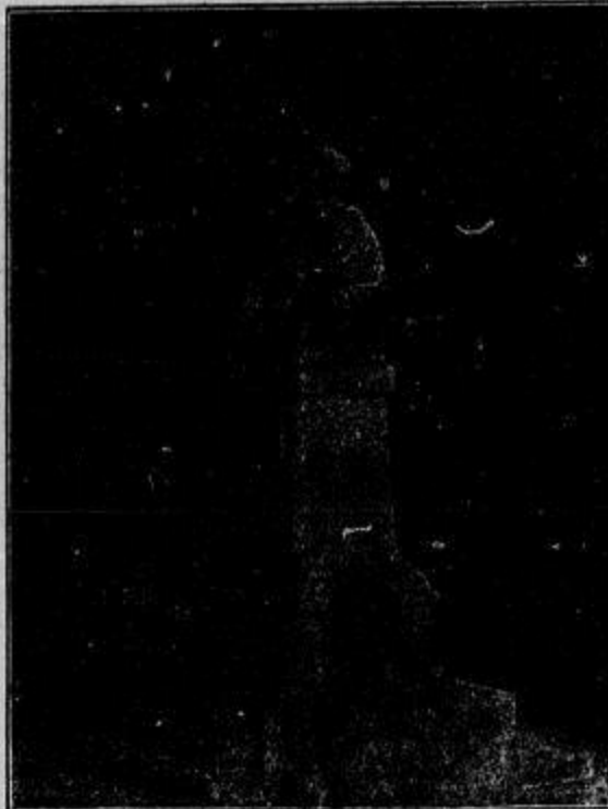
Das Scheffel-Denkmal in Säckingen. (Mit Text.)

„Karl,“ rief sie im Tone zärtlichen Vorwurfs, „Du hast mich lange auf Deine Rückkehr warten lassen!“