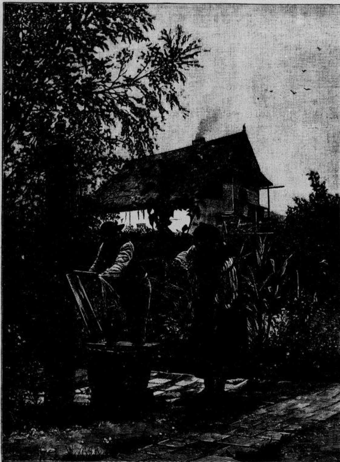
Was sich liebt, das neckt sich! (Mit Text.)