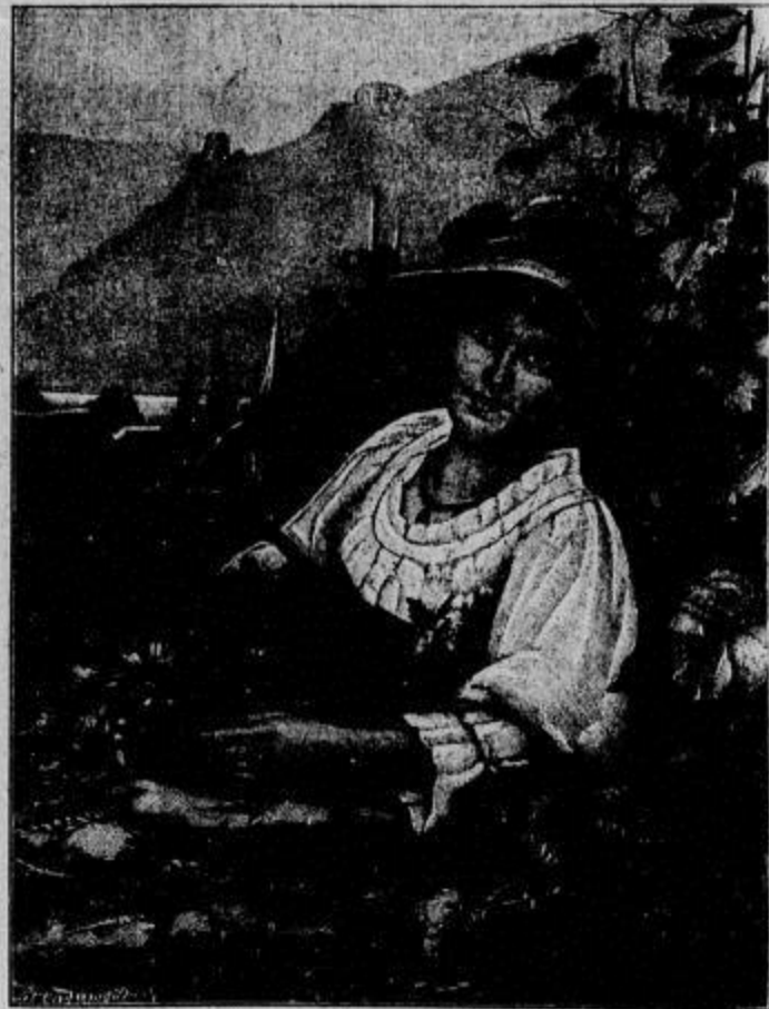
Das blonde Kind am Rhein. (Mit Text.) Nach dem Gemälde von H. Siepen.

Die beiden Frauen weinten mit ihm. „Das ist hart!“ meinte die Witwe. „Ach, hätten Sie doch die