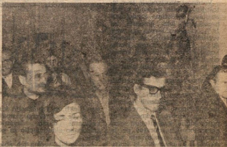
Razprava na konferenci OZKS je bila zelo živahna

Uresničevanje razvojnega programa pa ima več posledic, in sicer v sami gospodarski organizaciji in izven nje. Te posledice pa so lahko osnova za konflikte, kateri lahko preraščejo v širše dimenzije, zato moramo o tem več spregovoriti.