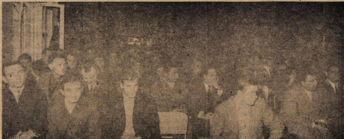
Komunisti so na konferenci obravnavali številne pereče probleme