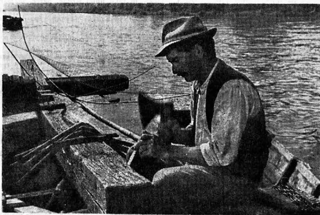
POSNETEK IZ SLOVENSKEGA FILMA

Prišel bo neki dan in bo ves moj, zaljubila se vanj bom kar takoj. Nasmeh mu bo igral, ko prvič bo poljub mi dal. Bo velik in močan moj fant srca, da več ne pojde stran, prosila ga bom prav lepo, dokler ne bo mi vzel roko. Nič ne vem še kdaj prišel bo, bo nedelja tisti dan, dušo mojo vso prevzel bo, z njim me sreče sončni dan ogrel bo. Zgradil bo majhen dom za naju dva in jaz ljubila bom ga kot moža. Nad nama sreče sij gorel bo dneve in noči.