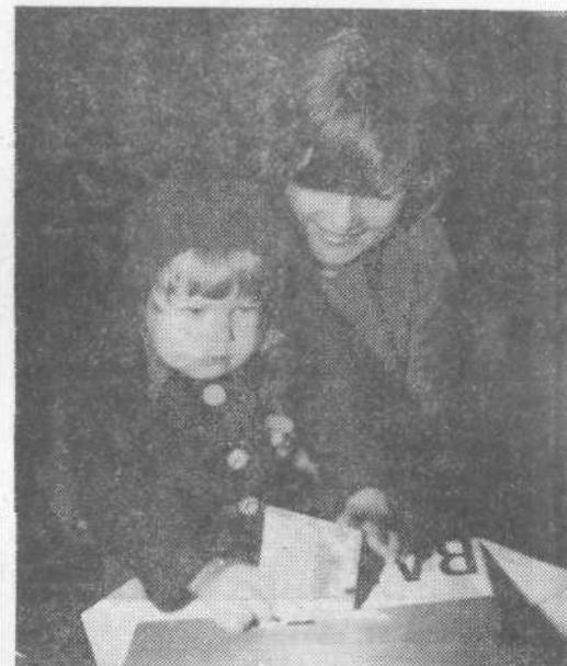
Na volišču v Smedniku je naša kamera zabeležila tale prisrčen prizor ...