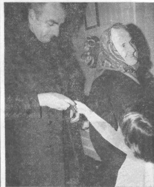
Na volišču v krajevni skupnosti Sentvid so cibani občanom delili lične značke, ki so jih pripravili v VVZ Rezke Dragarjeve