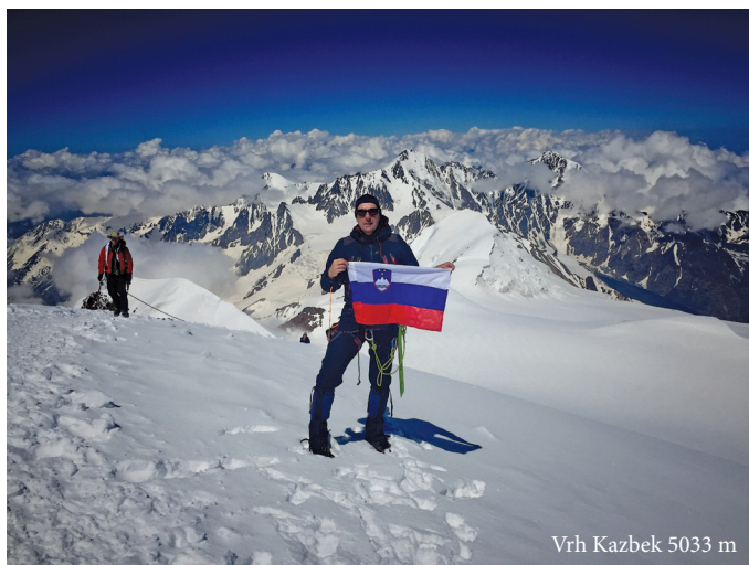
Vrh Kazbek 5033 m

Sončno. Jasno. Brez sapa vetra, preprosto neresnično. Kako čudna je narava. Temperatura na vrhu na soncu zagotovo 20 stopinj Celzija, a krenili smo približno z ničle. Neizogibno slikanje. Zastava. Moja Slovenija tudi tu.