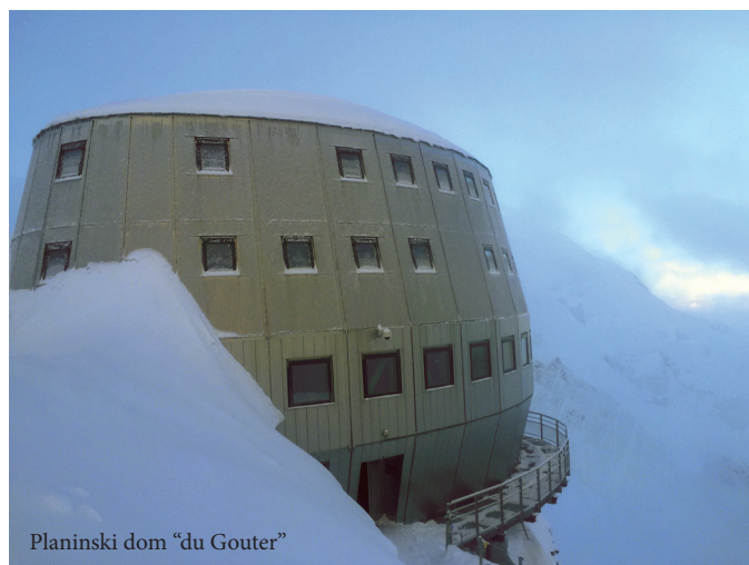
Planinski dom "du Gouter"

Počasi se dani. Glavno je, da smo skozi kuloar šli ponoči, ko so temperaturne razlike minimalne, s samim tem pa tudi nevarnost plazov. Dani se. Mimo nas leti helikopter. Prinaša hrano in opremo za zgornji dom. Slišali smo v dolini, da se francoski specialci pripravljajo na vaje s helikopterji. Reševalci so v bližini. Nekako mi je lažje. Pomislim, mogoče bo brezplačna vožnja navzdol, če se nam posreči (na žalost je vaja prestavljena na jutri). Končno prvi dan brez padavin. Jasni se in razgled se počasi razprošira na vse strani. Veličanstveno. Hitro prihajamo do doma vseh domov "du Gouter". Pravijo eden najsoodnejših. Dokončan 2012, gradnja je stala preko 15 milijonov evrov - space shuttle. Dom totalno energijsko neodvisen - obnovljiv in projektiran, da vzdri sunek vetra tudi do 300km/h. Imajo vse, razen pitne vode (steklenica stane 6 evrov), toda tu so zato moje zaloge.