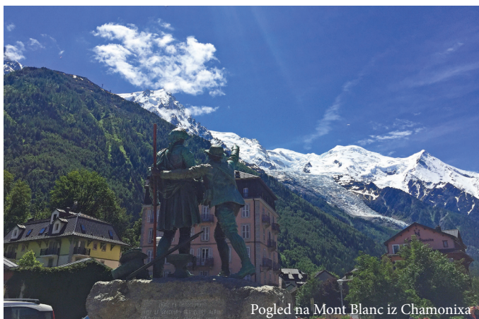
Pogled na Mont Blanc iz Chamonixa

Torej padel je še tretji vrh. Trije od treh. Hvala ti Bernard (Bernard de Menthon - zaščitnik planincev). Zgleda, da smo uspeli samo Rusi in mi. Čaka nas okrepčilo, počitek ter dolga pot domov.