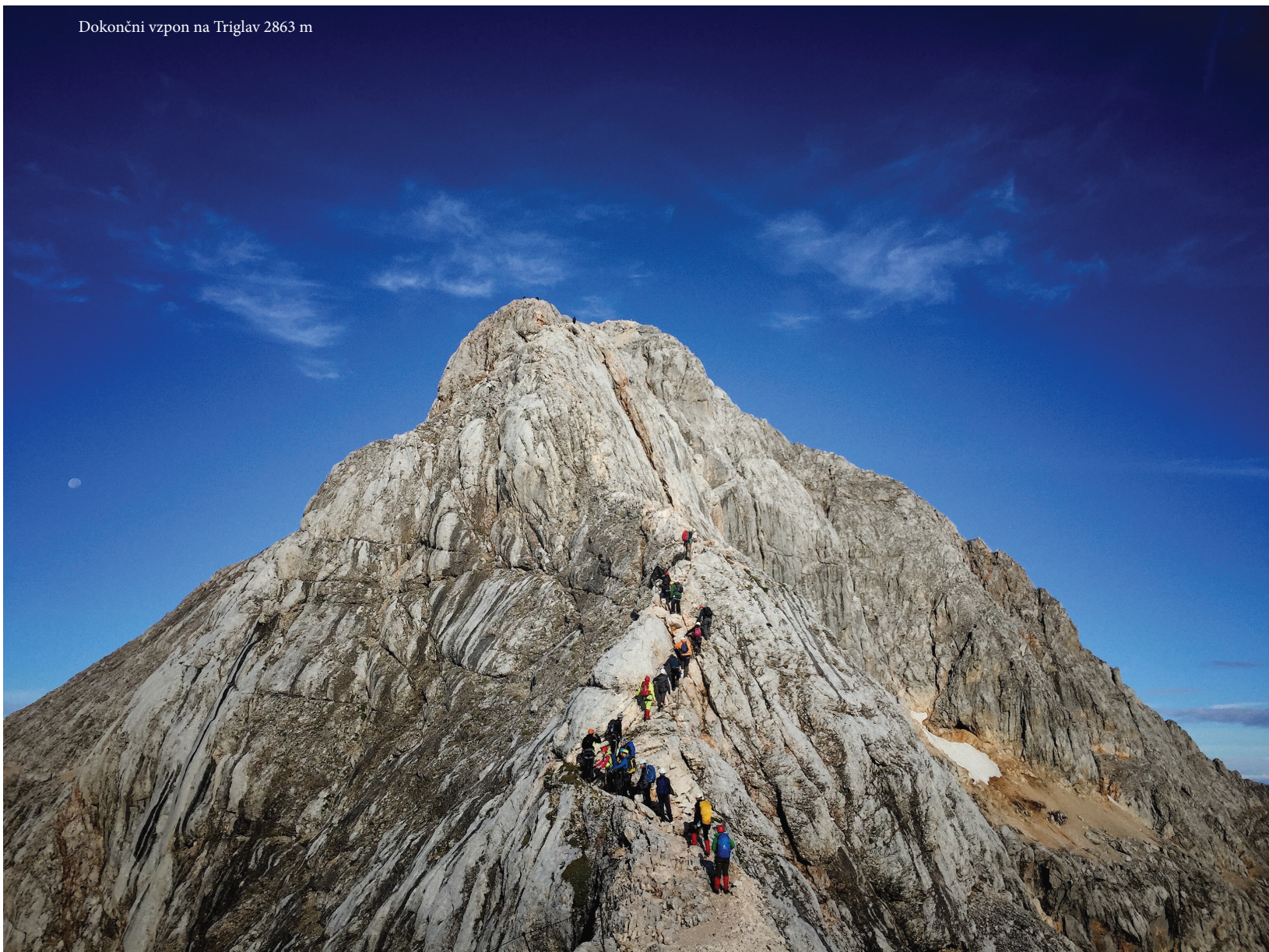
Dokončni vzpon na Triglav 2863 m

Sledi Gruzija, Turčija. Pred Istambulom slišimo, da je bil minulo noč poskus puča. Tako smo bili otopleli od potovanja, da nam je vsem menda bilo že vseeno. Samo da čim prej pridemo domov. Gremo tudi skoz tu. Na poti domov pa se, čim so minili simptomi utrujenosti, že postavlja vprašanje pri večini od nas: