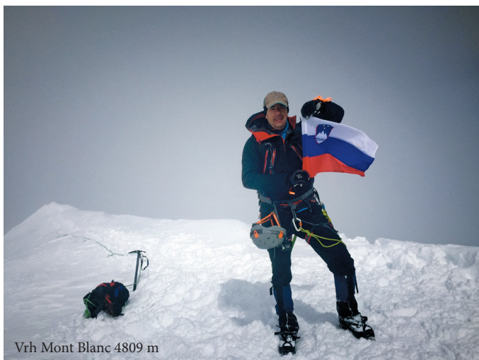
Vrh Mont Blanc 4809 m

zaklonišča Vallot pred vrhom, višina je 4362 m. Na žalost še en naš planinec hoče odnehati. Odloči se, da nas tukaj počaka. Višina jemlje svoj "danak", davek. Vrh se sluti v daljavi, še samo 450 m, vendar višinske razlike. Na poti do vrha še en strmi del. Oster. Počasi plezamo s cepinom v navezi. Prihajamo ven na Ženevski nož (ozka steza, ki povezuje dva vrhova z veliko strmino na obeh straneh). Niti tu mi ni jasno, kako se tu planinci ogneju drug drugemu, saj se skupina mora umakniti s steze, da bi spustila drugo. A prepad tu, takoj ob meni. Bolj ko smo se približevali vrhu, je z vsakim metrom obstajala vse večja možnost, da ga bomo osvojili. Devetdeset odstotkov je odnehalo. Menda so samo Rusi pred nami. Izza nas ni nikogar. Pred samim vrhom me premagujejo čustva. Ne morem zadržati solz. Ihtim, a smejem se. Moč se mi vrača. Oblaki se na kratko razgrnejo. Kakšen razgled z vrha Alp! Kakšna ekipa. Prihajamo na vrh 4809 m. Seveda Rusi. Nazdravljamo s šampanjcem, samo požirek. Za moje vse. Za mojo Slovenijo. Tu je tudi zastava. Neverjeten občutek.