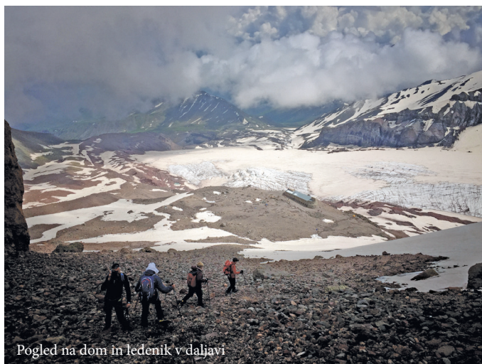
Pogled na dom in ledenik v daljavi

Spuščamo se. Odmor v domu, od koder se razprostira prelep pogled na ledenik pod nami značilne modre barve.