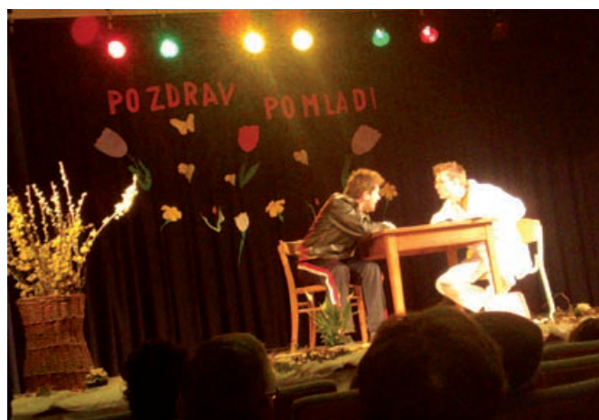
Člani ŠRD Dolnji Slaveči so prikazali skeč

Društvo za razvoj in promocijo turizma občine Grad »SKOURIŠ« je v sodelovanju z Občino Grad 21. marca 2010 organiziralo prireditev »Pozdrav pomladi«. Kot