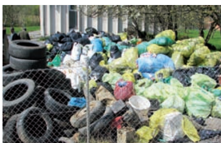
Zbrane smeti pri Gradu