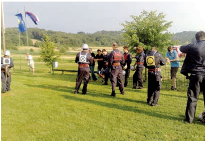
Met torbice

V soboto, 3. julija 2010, je bilo ponovno v središču dogajanja nogometno igrišče v Motovilcih, saj se je ob 20. uri začelo že 12. tradicionalno nočno gasilsko tekmovanje za prehodni pokal vasi Motovilci. Ostali smo zvesti tradiciji, saj nam je spet uspelo privabiti rekordno število tekmovalnih desetih. Tekmovanja se je namreč udeležilo kar 45 gasilskih enot iz širše regije ter Štajerske. Tako lahko s ponosom povemo, da je naše tekmovanje postalo največje v širši Pomurski in Štajerski regiji. Tradicionalna pa ni bila le dobra udeležba, ampak tudi vreme. Očitno brez »božjega blagoslova« v Motovilcih ni moč speljati prireditve. Toda tudi plohe nas niso spravile iz tira, saj se gasilci ne oziramo na vreme, ostali obiskovalci pa so se umaknili v šotor.