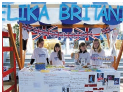
Stojnica OŠ Grad na Evropski vasi v Murski Soboti

OŠ Grad je bila letos drugič vključena v projekt Evropska vas. Glavni namen projekta je spoznavanje držav članic Evropske unije, vzgoja za medkulturni dialog in sprejemanje drugačnosti. V pomurski regiji je letos sodelovalo 31 šol, vsaki šoli je žreb določil državo, tako smo letos mi spoznavali Veliko Britanijo. Svoje delo smo predstavili na eni izmed stojnic, ki so popestrile zaključno prireditev v Murski Soboti 7. maja 2010. V ta namen smo