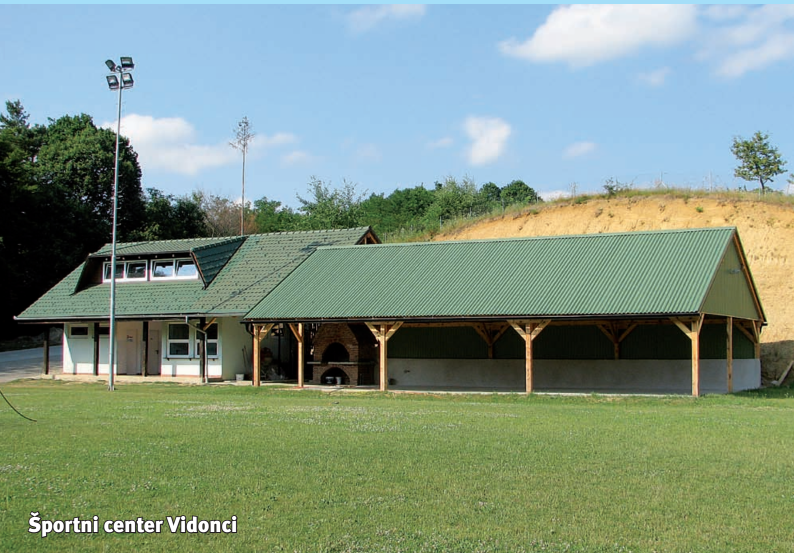
Športni center Vidonci