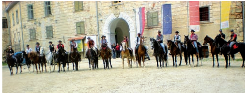
Jahači pred gradom