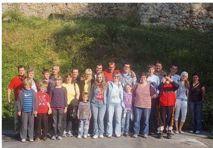
ŠD Kovačevci pred gradom Dubovac

Člani Športnega društva Kovačevci smo se letos odpravili odkrivat lepote naše sosede Hrvaške. Zgodaj zjutraj smo se dobre volje vkrcali na avtobus, ki nas je popeljal čez mejo do Karlovca, kjer je bil naš prvi ogled. Karlovac je mesto na štirih rekah, katere so čez zgodovino vplivale na sam razvoj in duh mesta. Karlovac je bilo ob ustanovitvi vojaško mesto, kar priča tudi sam grad Dubovac, katerega smo si ogledali. Naša naslednja postojanka je bil narodni park Plitvička jezera. Park, ki je že od leta 1979 pod zaščito UNESCO-a, je na vse nas naredil velik vtis. Jezera, slapovi, flora in favna tega