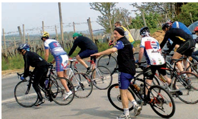
Kolesarji na poti!

Društvo »Skouriš« je v sodelovanju z Občino Grad 25. aprila 2010 organiziralo že 3. rekreacijski kolesarski