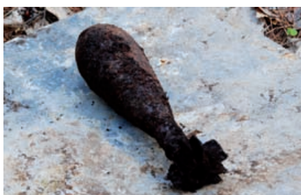
V Vidoncih so med smetmi našli tudi minometno granato iz 2. sv. vojne