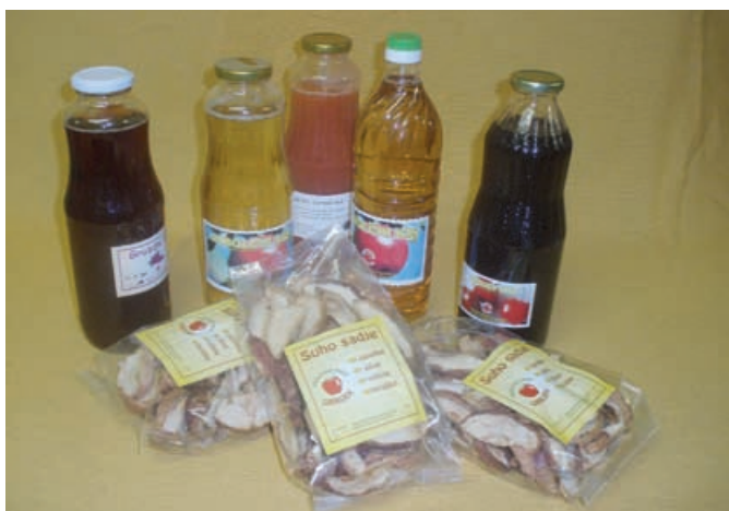
Njihovi izdelki

Že sama sem doživela, da ko sem povedala, da prihajam iz Kovačevca, so me vsi povprašali, a je to tam, kjer se da