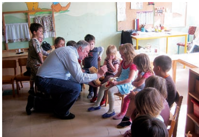
Najmlajše v vrtcu je obiskal medvedek Henry

najstarejšo mednarodno humanitarne organizacije, ki obstoji že 147 let, na tleh naše domovine Slovenije pa že 144 let, po ustanovitvi prvega Ženskega društva za pomoč ranjenim v vojni leta 1866 v Ljubljani. A letos mineva 151 let od bitke pri Solferinu, kjer je pravzaprav