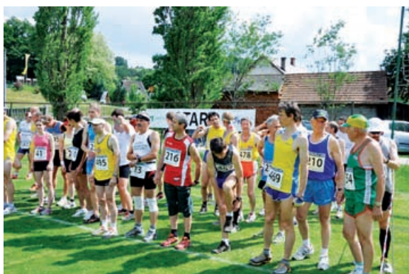
Tekači na štartu

več domačih tekmovalcev, ki pa so večinoma »ravninski« tekači in jih razgibana proga gor/dol ne privlači preveč. Večina tekmovalcev gorskih tekov, ki v slovenskem merilu veljajo za najboljše, pa so bili tu.