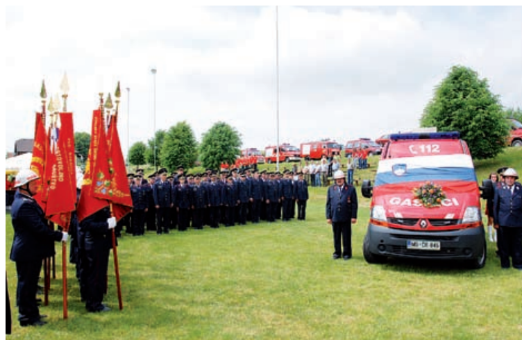
Zbrani gasilci pred novim vozilom GV-1

Kot pa se spodobi za vsako prireditvev po končanem kulturnem