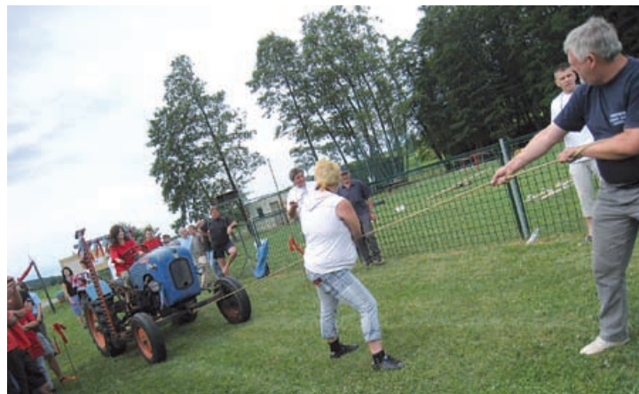
Najzanimivejša igra je bil traktor