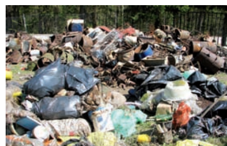
in v Vidoncih.