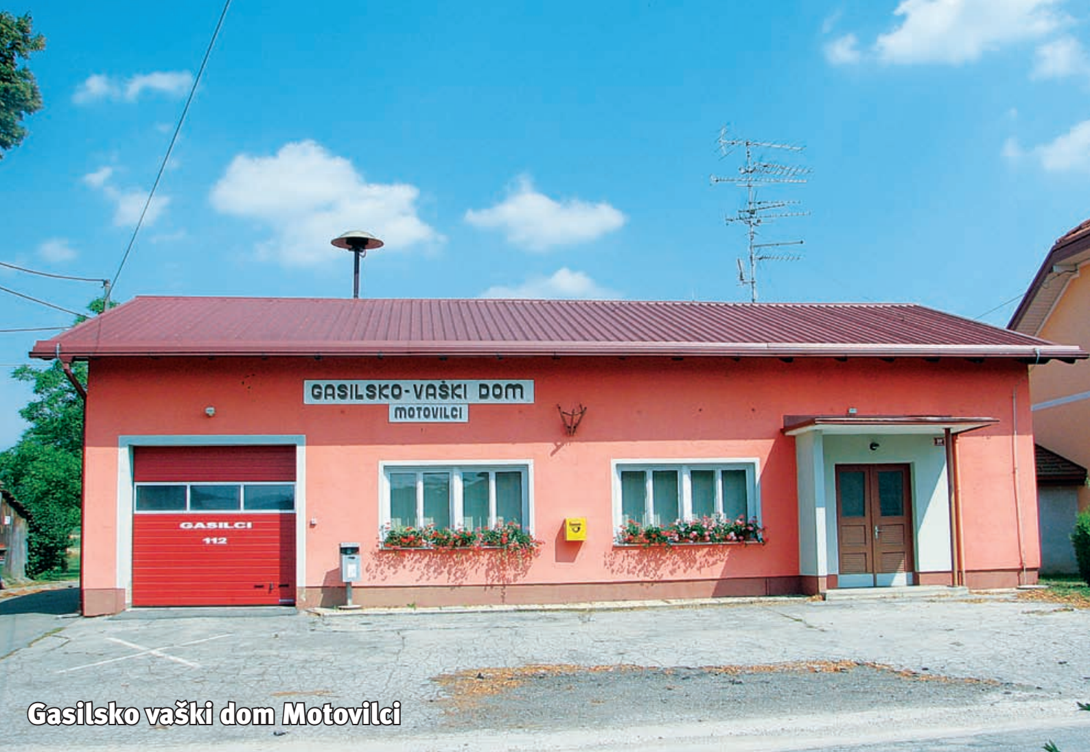
Gasilsko vaški dom Motovilci