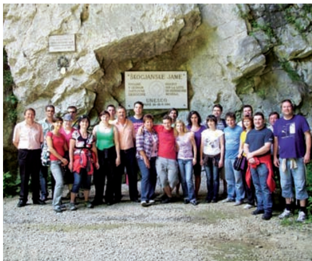
ŠD Vidonci pri Škocjanskih jamah

Najprej smo se seveda ustavili na jutranji kavici v Tepanju, da smo se popolnoma prebudili. Po nekaj urah vožnje smo prispeli na Kras v vasico Lokev, kjer smo si ogledali pršutarno Lokev na Krasu. Po ogledu pa je sledila degustacija kraških dobrot – pršuta, zašinka in pancete. Ob degustaciji pa seveda ni manjkalo pravega kraškega terana. Nato pa smo si ogledali lepote kraškega podzemnega sveta – Škocjanske jame. Po ogledu Škocjanskih jam smo postali malce utrujeni, zato smo se odpravili na kosilo. Poskusili smo pravo kraško kosilo, ki pa je bilo enim malo bolj vseč drugim pa malo manj. Ob prijetnem klepetu med kosilom je padla ideja, da se zapeljemo še do slovenskega morja. Zapeljali smo se do Izole in se odpravili na plažo. Ker pa žal nismo imeli kopalk, smo lahko namakali samo noge. Vese-