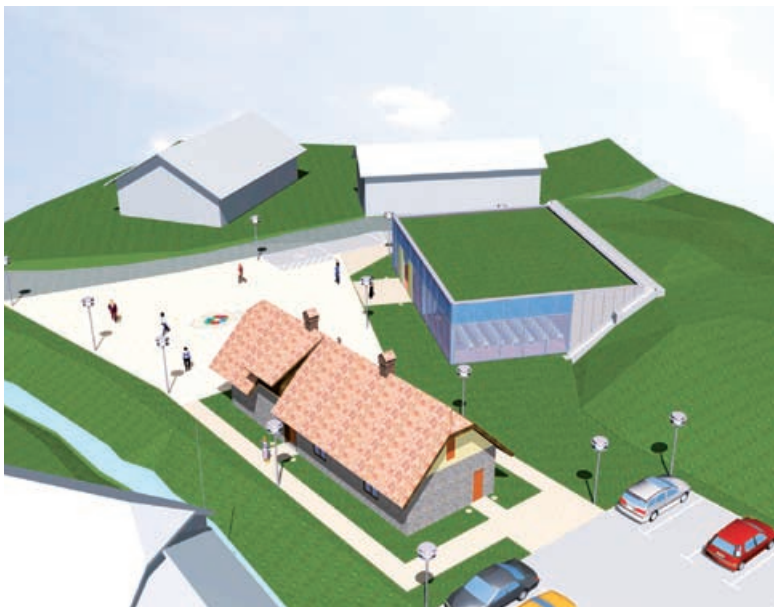
Center večpredstavnostnih umetnosti z Lednarjevo usnjarno

Načrt razvojnih programov je obsežen in ga želimo kar najbolj izpolniti. Z zadovoljstvom ugotavljamo, da nam je uspelo do sedaj narediti to, kar smo si zadali in upamo, da nam bo uspevalo še naprej.