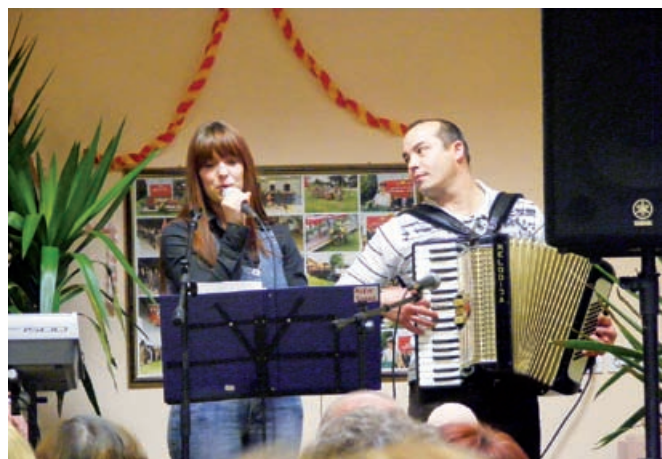
Tako so na materinskem dnevu uživali moški

Letos so se članice Društva žena in deklet odločile, da bodo materinski dan praznovale skupaj z moškimi. Vse skupaj se je odvijalo v vaško gasilskem domu v Kruplivniku, kjer je za popolno vzdušje poskrbela kratka proslava. Sledila je večerja, ob kateri smo ženske dobile energijo za zabavo in ples pozno v noč. Po večerji so gasilci matere in žene presenetili z nageljčki. Tako bi se