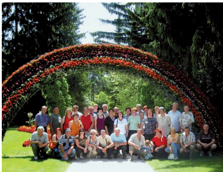
Med cvetjem v Mozirskem gaju