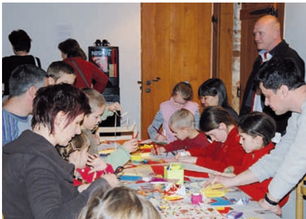
Izdelava velikonočnih voščilnic

Na gradu Grad so 27. marca 2010 potekale že 5. velikonočne delavnice in prodajna razstava izdelkov domače obrti in dobrot za praznično