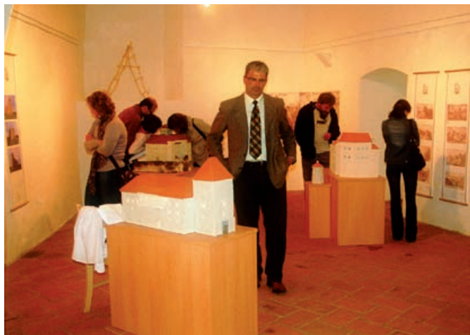
Otvoritev razstave