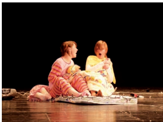
Predstava V ozvezdju postelje

Že na začetku šolskega leta smo se lotili igrice Borisa A. Novaka, V ozvezdju postelje. Preštudirali smo besedilo, označili osebe ter začeli razmišljati o sceni. Potem pa... Naša šola je za 4-letno delo na kulturnem področju prejela laskavi naslov »Kulturna šola 2009«. Kaj zdaj? Dogodek smo morali proslaviti in se zahvaliti vsem, ki so zanj zaslužni. To smo storili s kulturno prireditvijo, na kateri so se predstavile dejavnosti, ki jih povezuje delo na področju kulture.