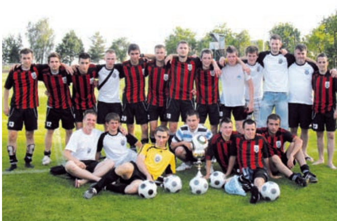
NK Grad so postali Pomurski prvaki

Člani komisije smo 12. julija 2010 obiskali in ocenili vse objekte v občini Grad, torej vse gasilske domove, vaško-gasilske domove in športne objekte. Pri svojem delu smo upoštevali kriterije, ki so pomembni za ocenjevanje, kot so namen in uporaba objekta, njihova urejenost, čistoča okolice, predvsem vzdrževanost, čistoča dvorišč, parkirišč, ostalih spremljajočih objektov, ki spadajo v celoten sklop objekta. Ob tem je potrebno povedati naše ugotovitve, torej prepričali smo se in