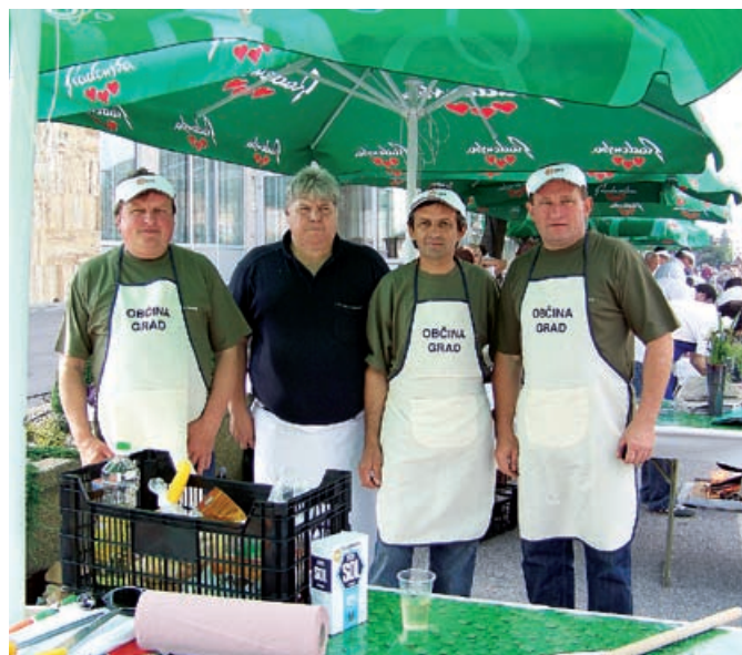
Ekipa Občine Grad pri pripravi bograča

Zadnji vikend v maju je potekal prvi soboški Bogračfest, ki se je odvijal pred hotelom Diana. Že v petek pa je potekalo promocijsko kuhanje bograča, na katerem