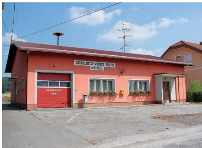
Gasilsko-vaški dom Motovilci

Jože Sever predsednik komisije za ocenjevanje