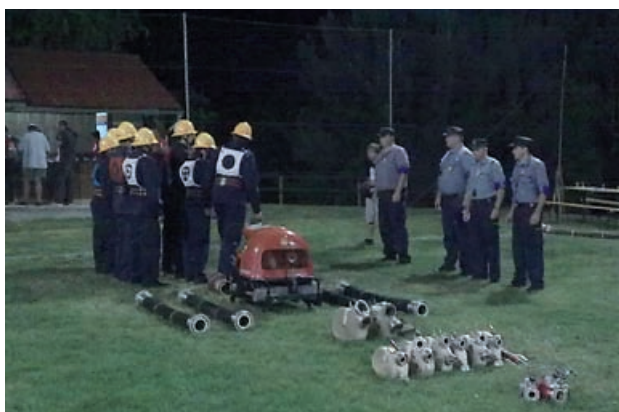
Na nočnem tekmovanju

da se bodo v prihodnje lahko kosale še s katero ekipo. Vse ekipe so se dokazale z znanjem, veliko težo pa je odtehtala izkušnost, zbranost in spretnost. Pa tudi kanček sreče ni zmanjkal. Tako je prvo mesto zasedla ekipa članov PGD Sela pri Ptujju, tik za njo je bila ekipa iz Bodoncev A1, tretje mesto pa je dosegla ekipa PGD Korovci.