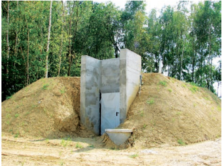
Vodohran v Radovcih

Občina bo praznovala občinski praznik 8. avgusta v Kruplivniku. Že dopoldne bo slavnostno, saj bo na gradu Grad ob 11. uri koncert mladih glasbenikov, učencev Glasbene akademije ISA. Takrat bo prvič zaigrano na nov koncertni klavir, ki je bil kupljen v okviru projekta Tourkult, sofinanciran s sredstvi Evropske unije. Vsi, ki bodo želeli, pa bodo imeli možnost peljati se s turističnim vlakom, ki je bil prav tako kupljen v okviru projekta Tourkult. Nadaljevalo se bo s slavnostno sejo ob 14. uri pod šotorom pred Gasilskim domom v Kruplivniku. Med kulturnim programom bo tudi slavnostna otvoritev novozgrajenega vodovoda Kruplivnik – Radovci. Svojemu namenu bo tako predano 17.200 m izgrajenega vodovodnega omrežja v naseljih Kruplivnik in Radovci. Vrednost investicije je bila 610.000,00 EUR, izvajalec del pa je bilo podjetje Blisk Montaža d.d. iz Murske Sobote. Velika pridobitev je vsekakor tudi vodohran Radovci, ki stoji ob Lovskem domu Radovci.