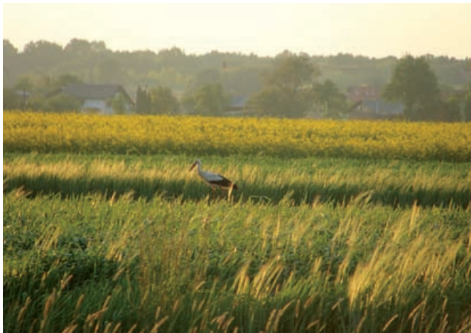
Zmagovalna fotografija Maruše Habinger

11. junija 2010 smo pod grajskimi arkadami odprli razstavo fotografij osnovnošolcev 2. Fotonatečaja Goričko 2010, Katera je tvoja najljubša? Na letošnji fotonatečaj