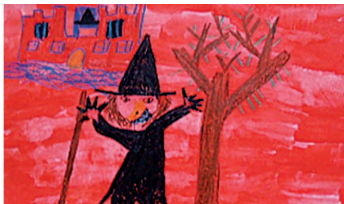
Risbica za slikanico Cumper camper

Z učenci smo tako spoznavali vsebino slikanice, se pogovarjali o čarovnici, o čarovništvu, likovno ustvarjali, poskusili smo tudi sami izvesti nekaj čarovniških trikov, skratka bilo je zanimivo, poučno in zabavno, pa čeprav danes ne znamo čarati nič bolj kot pred tem. Saj ne, da čarovnic ne bi poznali. Poznamo jih bolje kot marsikateri slovenski