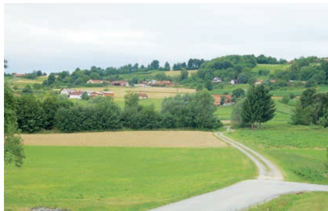
Pohodniki so spoznali Dolnje Slaveče

Tudi letos smo pripravili tradicionalni Pohod treh dežel, in sicer že šestič zapored. Vedno znova se veriga pohodov odvija v času binkoštnih praznikov. Kot vsako leto smo pohod tudi letos pripravili na binkoštno nedeljo. Veriga teh pohodov se je začela že v soboto zjutraj s pohodom na Madžarskem. Naslednji pohod je sledil