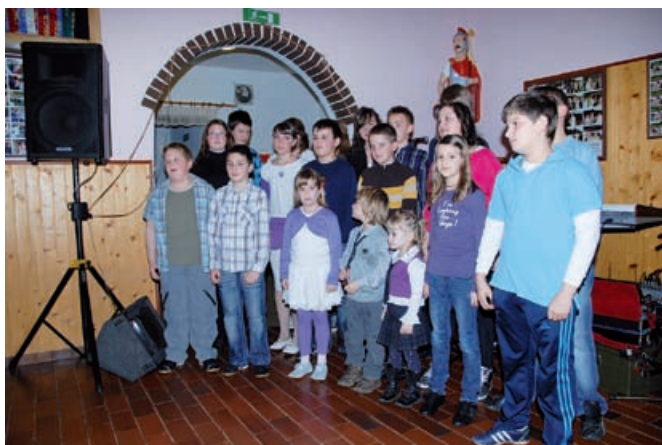
Vsi nastopajoči so zapeli pesem Mama, hvala ti

Kot je že tradicija v Vidoncih smo tudi letos pripravili praznovanje materinskega dneva. Zbrali smo se zadnjo soboto v marcu v Vaško gasilskem domu Vidonci.