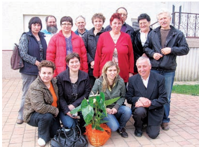
Udeleženci računalniškega tečaja