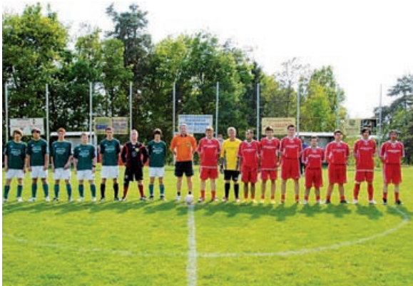
Utrinek s turnirja

turnir in kresovanje v spomin našim preminulim članom. Letos nam je vreme bolj ustrezalo in smo lahko turnir izvedli nemoteno. Na turnirju je sodelovalo 6 povabljenih ekip: Markgrafneusiedl z Dunaja, KMN Otovci, Veterani Otovci in Vidonci, PGD Vidonci, ekipa iz Kovačevcev in ekipa iz Matjaševcev. Vse tekme so bile odigrane na zelo solidni kakovostni ravni in seveda ni manjkalo lepih in atraktivnih potez. Vsak turnir pa ima tudi zmagovalca in zmagali so že drugič zaporedoma člani ekipe iz Matjaševcev. Že med turnirjem in seveda predvsem po turnirju pa ni manjkalo dobre hrane in pijače, kar je za naše prireditve značilno. V večernih urah pa smo prižgali tudi prvomajski kres. Srečanje po turnirju je potekalo še dolgo v noč. Letos smo dogajanje popestrili tudi z nastopom ansambla Sonček iz Osnovne šole Puconci.