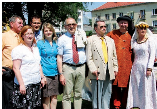
Z županom občine Bližyn (z ženo sta v srednjeveški opravi)

Letos je Bližyn praznoval 600 let obstoja in tako pripravil dvodnevno slovesnost, na katero je povabil tudi delegacijo iz naše občine. Tokrat smo se obisku odzvali trije predstavniki občine in jih razveselili s prisotnostjo na njihovem prazniku. V soboto, 26. junija, so v počastitev 600-letnice pričeli s slovesno mašo, kjer so se zbrali tudi predstavniki vseh društev in institucij. Dan je bil srednjeveško obarvan, saj so se v povorki do prireditvenega prostora sprehodili konjeniki, vojska, grof s svojim