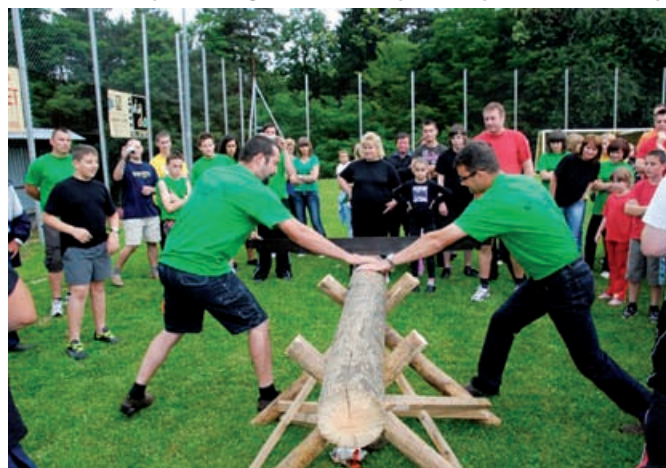
Igre so zahtevale spretnost in zbranost

Člani ŠD Vidonci smo letos organizirali že 4. vaške igre med zaselki vasi Vidonci. Zbrali smo se v soboto, 26. junija, v Športnem centru Vidonci. Iger se je udeležilo pet ekip iz naslednjih zaselkov: Pozvekov breg, Krčarov vrej, združeni Hajdičeva graba, Dolenjski vrej, Mlinarov vrej,