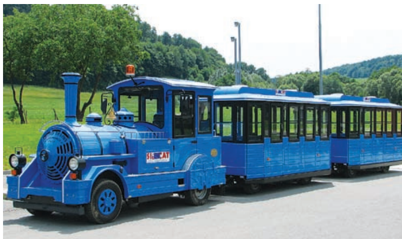
Turistični vlak

Občina Grad je s projektom, ki ga je sofinancirala v višini 69.462,75 EUR (393.622,25 EUR za slovensko stran sofinancira Evropska skupnost), pridobila nove produkte za obogatitev kulturne in turistične ponudbe. Te pridobitve so prireditveni šotor za tisoč ljudi z odrom in drugo opremo, koncertni klavir, ki se nahaja v grajski dvorani na gradu Grad, ter turistični vlak, ki bo s turističnimi programi ponujal spoznavanje naše pokrajine skozi