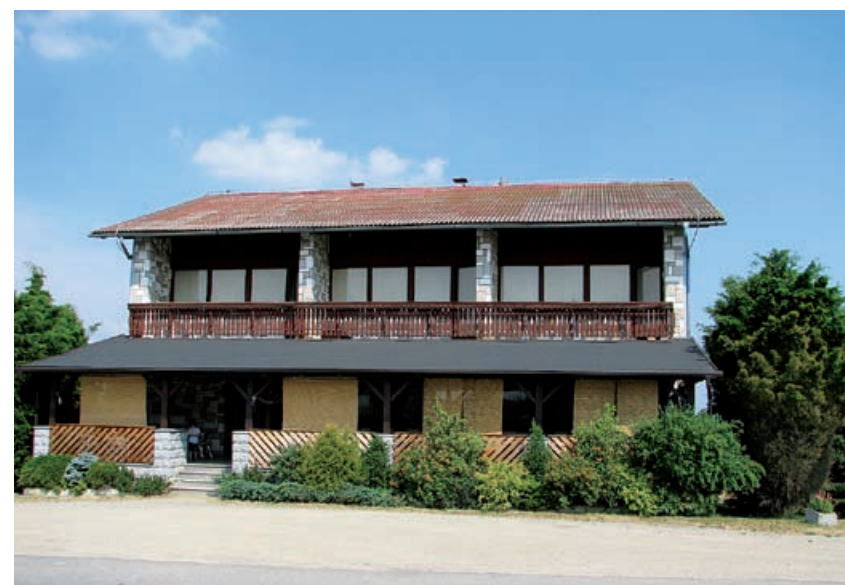
Okrepčevalnica pri Slavici danes

mere odražajo tudi v gostinstvu in mladi, ki se za to pot odločajo, res pretehtajo vse možnosti za razvoj te panoge. Pogosto v gostilni obiščeta gospodarico tudi vnučki Ines in Isela, ki bosta mogoče nekoč nadaljevali sloves "Fickove oštarije". Tako na tleh prve Fickove gostilne stoji danes moderno opremljena stanovanjska hiša hčerke Karine. Ob pogledu nanjo se nam mimoidočim večkrat utrnejo misli na ti-sto zeleno hišo, ob kateri smo radi postali in poklepotali.