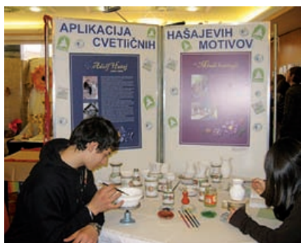
Učenci aplicirajo cvetlične motive

Mladi lončarji smo v šolskem letu 2009/10 nadaljevali z delom na lončarskem vretenu. Vodilo pri delu nam je bilo, do potankosti proučiti in aplicirati cvetlične motive pokojnega lončarja Hašaj