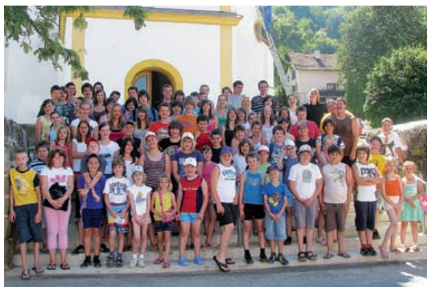
Udeleženci oratorija

Tako se je glasil naslov letošnjega oratorija, ki je potekal od 7. do 10. julija, in sicer v župnijah Grad in Kuzma. S 64 otroki in 20 animatorji smo skozi štiri