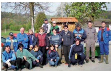
Prostovoljci na Dolnjih Slavečih,