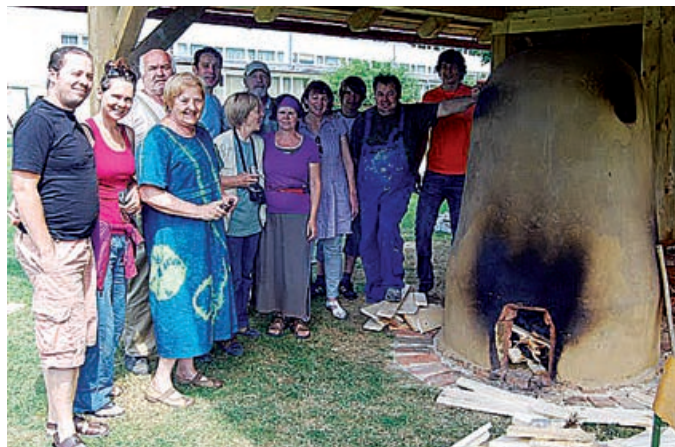
Lončarska peč pri OŠ Grad bo ostala vsem v lepem spominu

tenu in spremljali žganje glinenih izdelkov v kopasti peči, pri čemer so spoznavali lončarstvo kot ljudsko obrt. Delavnica je potekala na pobudo Zveze društev slovenskih likovnih umetnikov, in sicer v okviru priprav na II. mednarodni trienale keramike UNICUM 2012 in je uspešen primer oživljanja lončarstva kot ljudske obrti v povezavi s sodobnimi trendi izražanja v glini.