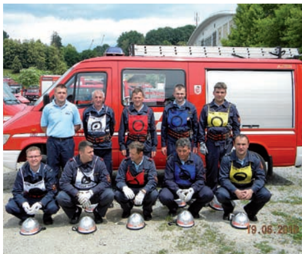
Ekipa PGD Dolnji Slaveči

V prejšnji številki občinskega glasila ste lahko zasledili, da se je PGD Dolnji Slaveči na regijskem tekmovanju uvrstilo zelo visoko. Za člane B je bilo znano že takrat, a člani A žal niso