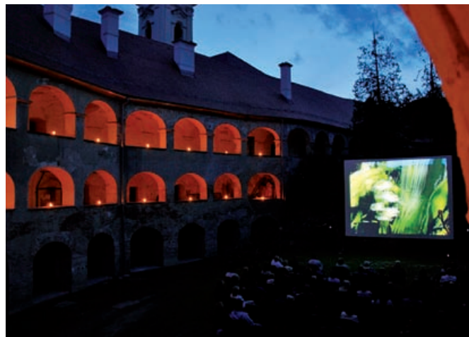
Prvi večer filma in kulture

V okviru projekta Porabje in Goričko – povezana v kulturi ali krajše Sosed k sosеду, katerega vodilni partner je Razvojna agencija Slovenska krajina iz Monoštra, se Javni zavod Krajinski park Goričko vsebinsko ukvarja z vzpostavitvijo novih vsebin dogajanja na gradu Grad in na območju Goriškega. Cilj, ki smo si ga zadali, je do leta 2012 vzpostaviti filmski festival naravoslovnega filma in