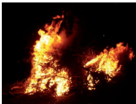
Prijeten večer ob ognju

Leto je ponovno naokoli. Tako so za nami tudi letošnji prvomajski prazniki. Na predvečer prvega maja je bil ponovno čas, ko so se zbrali fantje in možje ter pogumno odšli v gozd. Na večer