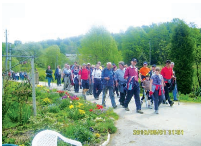
Pohodniki na poti k prigrizku

se na eni vmesni postaji okrepčali z namazanimi kruhki in s pijačo, na končni postaji pri gasilskem domu pa jih je pričakala topla malica.