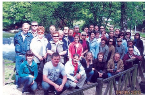
V Sarajevu

Tako kot nam je že v navadi vsako leto, smo se tudi letos člani Društva za šport, kulturo in turizem »Lukaj« Motovilci odpravili na izlet. Tokrat nas je pot vodila v prestolnico Bosne in Hercegovine. Po večurni vožnji smo srečno prispeli na prvi zadani cilj, mesto Jajce, kjer smo si ogledali stavbo in muzej, v katerem je potekalo zasedanje AVNOJ-a. S prijetno panoramsko vožnjo in radovednimi pogledi na porušene hiše in okoliške vasi iz nedavne jugoslovanske vojne smo prispeli v samo mesto Sarajevo. Ob prijetni družbi naše vodičke oz. animatorke smo si ogledali samo mestno jedro, kulturne spomenike, spoznali življenjske navade Sarajevčanov ter z njimi tudi pokramljali. Da potešimo lakoto, smo okusili prave »bosanske čevape« in njihovo znamenito kavo. Zvečer pa je sledila prava bosanska veselica z živo glasbo v hotelu in kratek čas za počitek. Po dokaj kratki noči smo se odpravili v naravni park »Vrelo Bosne« in si ogledali podzemni tunel, ki je bil edina vez z zunanjim svetom v času vojne. Po opravljenih nakupih suvenirjev in daril najbližjim smo se še pustili razvajati ob bogato obloženih specialitetah sarajevske kuhinje, nakar smo se polni lepih spominov