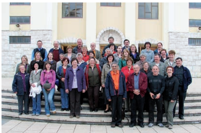
Romarji pred međugorsko cerkvijo

Tridnevno romanje smo zapolnili z molitvijo, mašami, razmišljanjem in petjem. Na poti smo se ustavili v Sinju, kjer smo imeli sv. mašo v cerkvi Gospe Sinjske. Ko smo prispeli v Međugorje, smo se najprej povzpeli na Križevac. Naslednji dan smo spoznali Majčino selo, kjer so nastanjeni otroci, ki so izgubili starše ali jih je kruta usoda kako drugače zaznamovala. Ob molitvi rožnega venca smo se vzpenjali na Crnico, kraj, kjer se je Marija prikazala pastirjem. Romarji smo tokrat svoje misli posvetili le Njej. Mariji pa se posvečajo tudi dekleta in žene, ki smo jih nato srečali v komuni. Spoznali smo delo in življenje teh deklet, ki so zašla s poti in sedaj v komuni s pomočjo molitve iščejo pravo pot življenja. Popoldan smo namenili ogledu međugorske cerkve, priporočanju Mariji, spovedi, sv. maši in tudi nakupu spominkov. Zadnji dan našega romanja smo pričeli s slovensko mašo v kapeli ob međugorski cerkvi. Na poti domov smo se