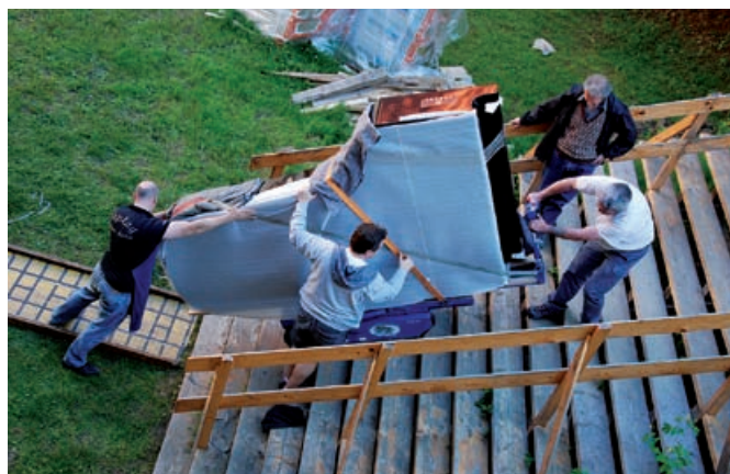
Transport klavirja v prvo nadstropje