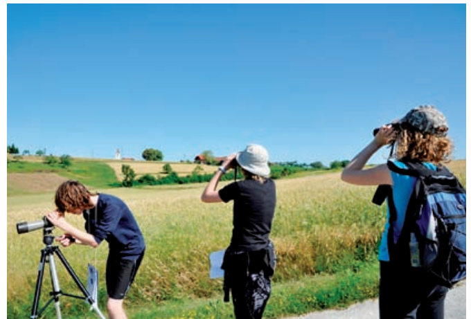
Opazovanje na terenu

Ornitološki mladinski raziskovalni tabor je Društvo za opazovanje in proučevanje ptic Slovenije (DOPPS) organiziralo že osemnajstič zapored. Tokrat smo ga v sodelovanju z Zvezo za tehnično kulturo Slovenije in Javnim zavodom Krajinski park Goričko pripravili na Osnovni šoli Grad. Na tabor se je letos prijavilo šestnajst