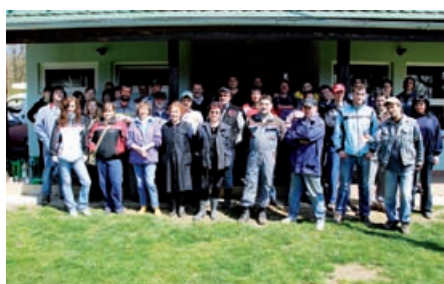
in v Vidoncih.