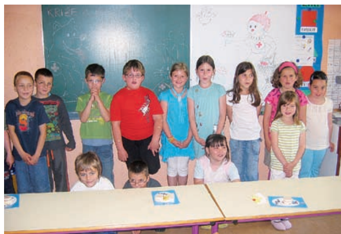
Drugošolci sprejeti med mlade člane RK na OŠ Grad

Vsako leto med 8. in 15. majem, v Tednu Rdečega križa, po osnovnih šolah potekajo sprejemi najmlajših v to