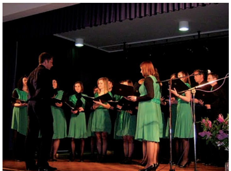
Mešani pevski zbor Cantate Mor. Toplice

Lepo majsko nedeljo so 9. maja polepšali ubrani glasovi 12 pevskih zborov, ki so se udeležili 4. Majske pesmi, koncerta pevskih zborov in vokalnih skupin z območja trideželnega parka Goričko-Raab-Őrség v kulturni dvorani občine Grad. Prireditelj je v sodelovanju z JZ KP Goričko in Občino Grad pripravilo Goričko društvo za lepše vütro. V tekmovalnem delu se je pomerilo 9 zborov in sicer: Mešani pevski zbor Cankova, Moški oktet KPD Rogašovci, Mešani pevski