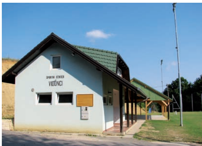
Športni center Vidonci

ugotovili, da se domovi oziroma objekti v naši občini zelo razlikujejo prav v teh naštetih elementih; urejenost, čistoča in vzdrževanje, ker sam prostor oziroma objekt ne pomeni dosti, če ni urejena okolica, če smeti niso pospravljene, trava ni pokošena in če je vidno, da takšno stanje traja že dalj časa.