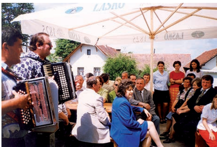
Ob otvoritvi nove gostilne leta 1998