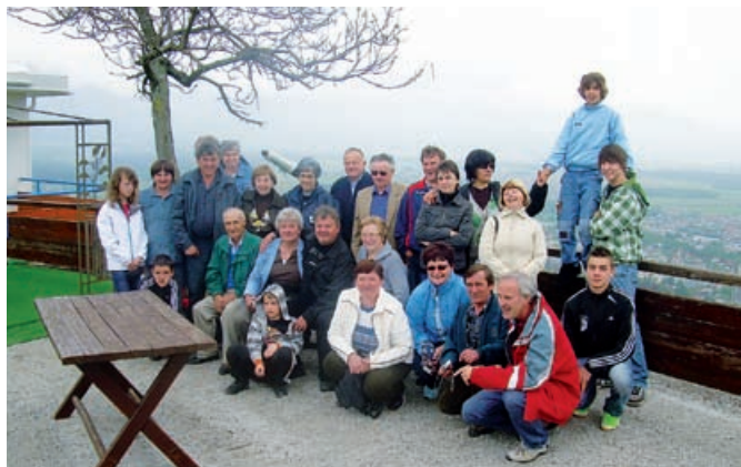
Na Šmarjetni gori nad Kranjem

Letos so se naši člani odpravili na izlet na Gorenjsko. Pot jih je v sicer deževnem dnevu vodila najprej na ogled Brniškega letališča, kjer so jim razkazali vso prenovljeno letališče. Nato so se odpravili na Šmarjetno goro nad Kranjem, kjer so lahko kljub deževnemu in muhastemu vremenu uživali v lepotah narave. Po zaužitju svežega zraka so odšli do Kranja, kjer so si ogledali jedro mesta. Zatem je sledil ogled izvira reke Kamniške Bistrice. Ker