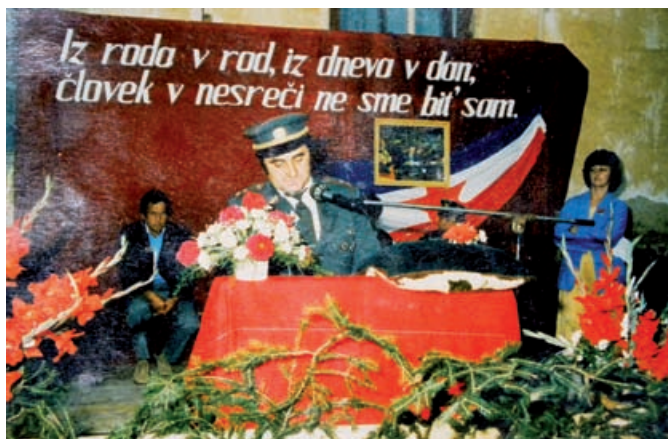
Štefan ob prevzemu orodnega vozila 1987

leta 1995 pa ponovno prevzel odgovornost predsednika in tako je kot predsednik gasilskega društva za svoje delo odgovoren še danes. Leta 1978 je bil boter pri prevzemu motorne brizgalne, leta 1987 pa je organiziral nabiralno akcijo za nabavo novega orodnega vozila, katerega uporabljamo še danes. Za svoje vestno opravljeno delo je leta 1999 prejel gasilsko odlikovanje II. stopnje, lansko leto ob 70. obletnici delovanja gasilstva pa je prejel značko za dolgoletno delo, katerega opravlja že več kot 40 let. Štefan je bil zaposlen v Avstriji, kjer je tudi stanoval med tednom, ob koncu tedna pa je svoj prosti čas žrtvoval za razna dela v gasilskem domu in za pomoč sovaščanom. Nepogrešljiva je njegova pomoč tudi še danes pri raznih delih v gasilskem domu, pri urejanju okolice in pri raznih vaških prireditvah.