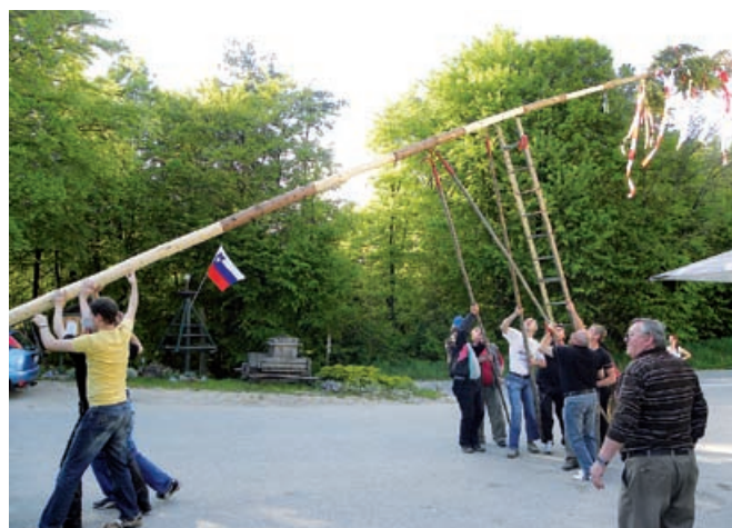
Postavitev mlaja pri Okrepčevalnici Pri belem križu

V sklopu praznovanja 1. maja so letos piknik v Kruplivniku organizirali Društvo žena in deklet, Prostovoljno gasilsko društvo in vaški odbor. Najprej smo se zbrali pri Okrepčevalnici pri Belem križu, kjer se je postavil mlaj. Mlaj se je tudi okrasil in ko je bil postavljen, je že bila