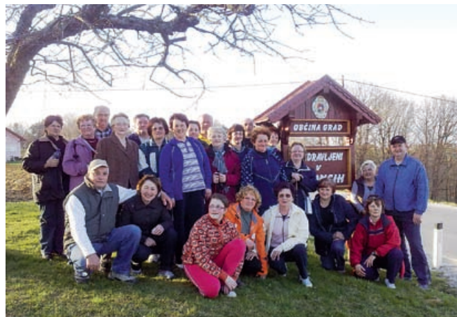
Na pohodu po Vidoncih

Tudi v tej zimi se je okrog 25 občanov udeleževalo zimske rekreacije, ki je potekala od novembra do marca v telovadnici OŠ Grad. Na rekreaciji smo pod vodstvom