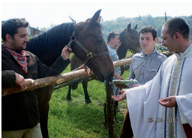
Blagoslov in prigrizek za konje