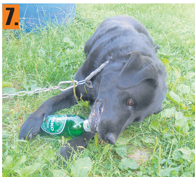
Nero obožuje pivo, pa ne katerokoli ...