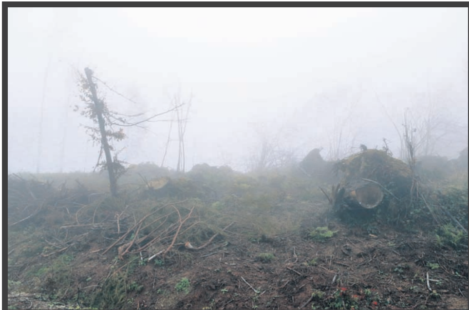
Preden so lahko na delo prišli prostovoljci, so sodelavci zavoda za gozdove pripravili teren. Čiščenje območja je bilo zelo zahtevno, saj so drevesa ležala drug na drugem. Sanacija posledic zledoloma na območju Magolnika na srečo ni terjala večje delovne nesreče, razen zloma noge.