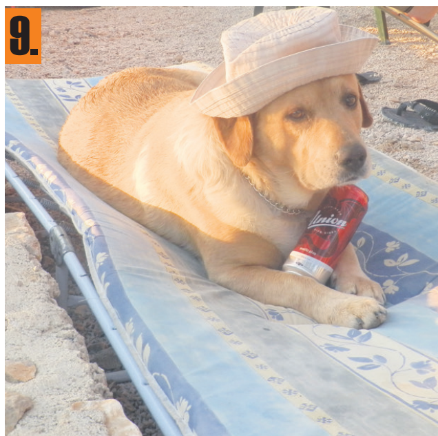
Maxi je poleti užival na morju, če je le imel na voljo prave pripomočke. Suzana Požlep iz Celja nam je poslala njegovo fotografijo.

Kupon pošljite na Novi tednik, Prešernova 19, 3000 Celje. Sprejemali jih bomo do 25. novembra!