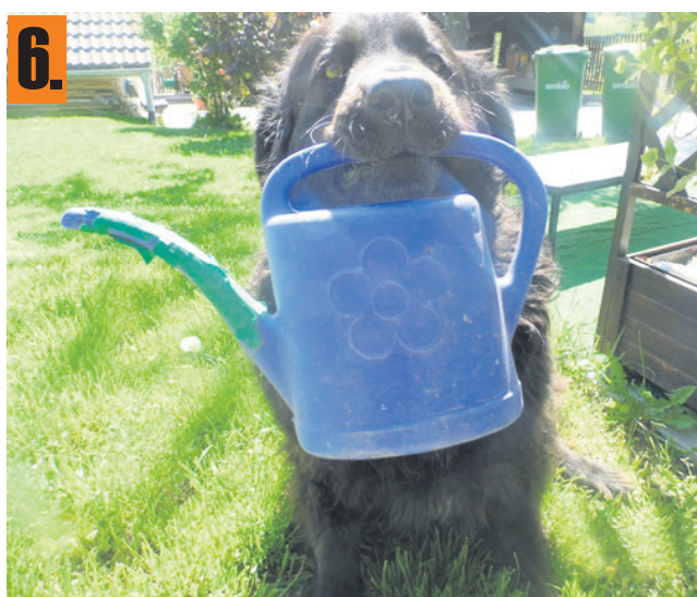
Naja je mešanka med zlatim prinašalcem in labradorcem. »Je zelo prijazna in igriva,« je zapisala lastnica Katja Verhovšek iz Celja. »Najrajši pa nam pomaga pri vrtnih opravilih.«