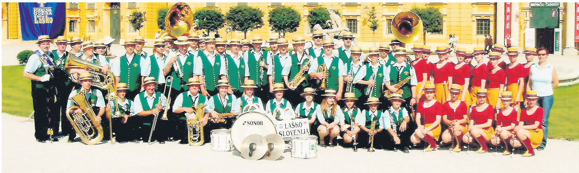
Leta 2005 so se Laščani Dunajčanom predstavili s svojim šov programom in jih navdušili z mažoretno skupino.