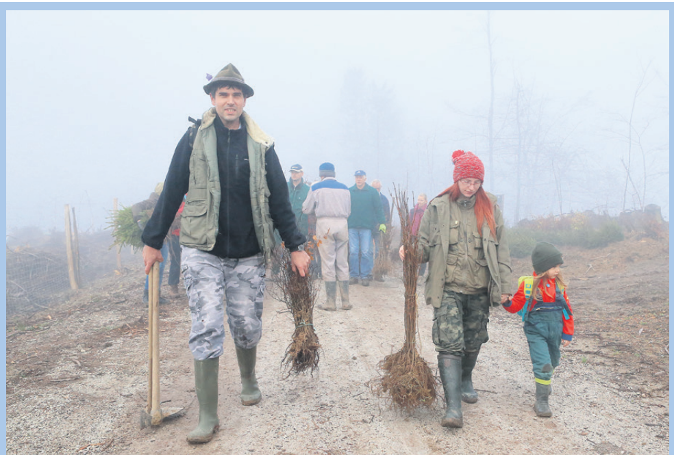
Družine so s seboj pripeljale tudi svoj podmladek, saj je prav on tisti, ki bo čez desetletja žel sadove današnjega dela.