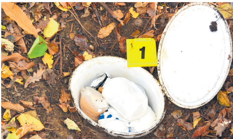
Takole sta Konjičana »poskrbela« za drogo.