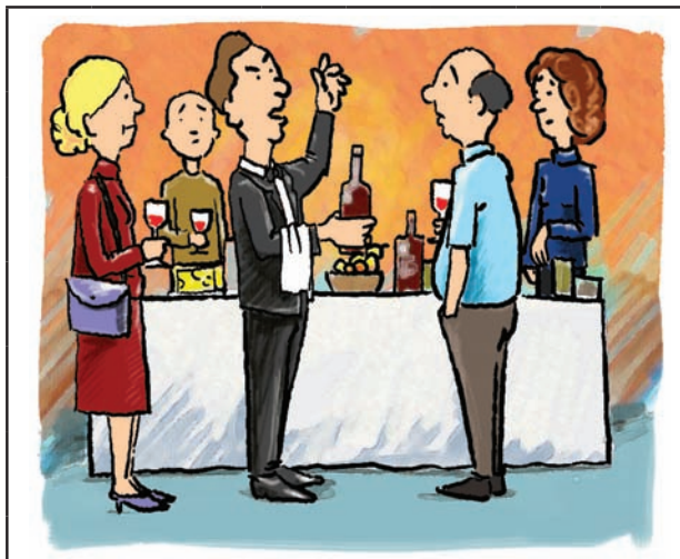
Umaknite se! ...