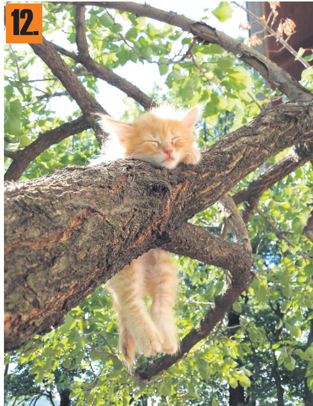
12. »Naš muc se pogosto povzpne na marelico in tam ure in ure spi. Še nikoli ni telebnil na tla ...« je nenavadno fotografijo pokomentiral Igor Verdev iz Andraža nad Polzelo.