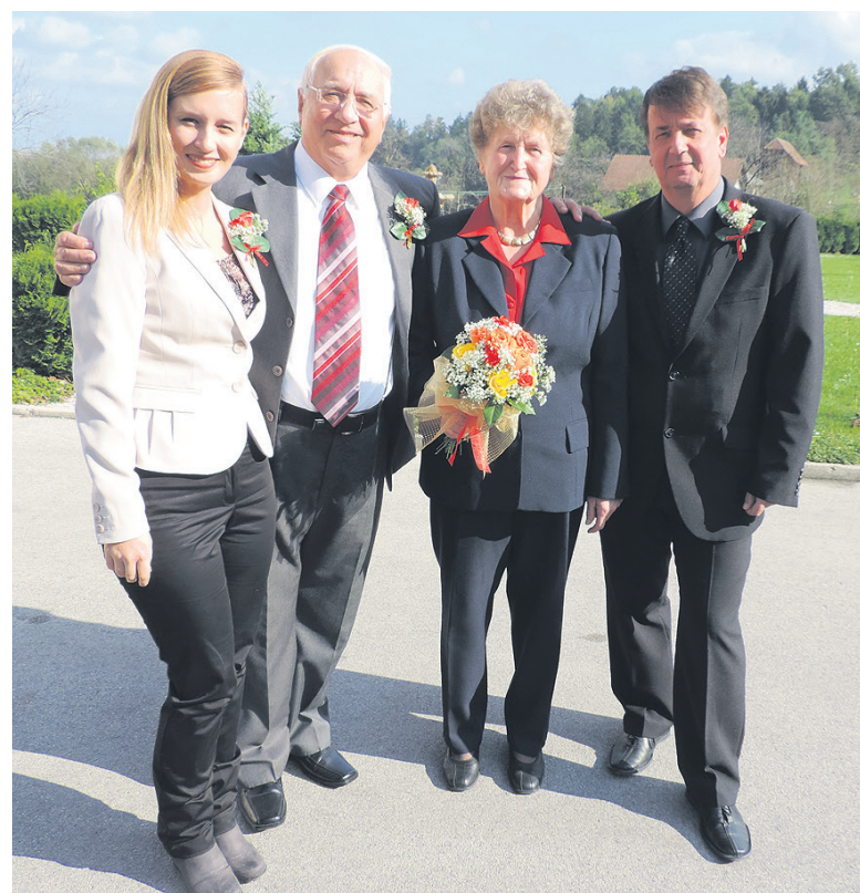
Zlatoporočena s pričama