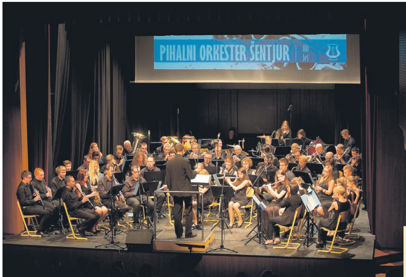
Pihalni orkester trenutno šteje 66 članov. V svoje vrste bo tudi v prihodnje z veseljem sprejel nadebudne mlade glasbenike. Le prostor za vajo bodo morali malo razširiti. Dvorana v nekdanji knjižnici, Centru kulture Gustav, bo s kakšno prezidavo v prihodnje morda končno sprejela celo stotnijo članov, ki se ji z leti vztrajno približujejo.