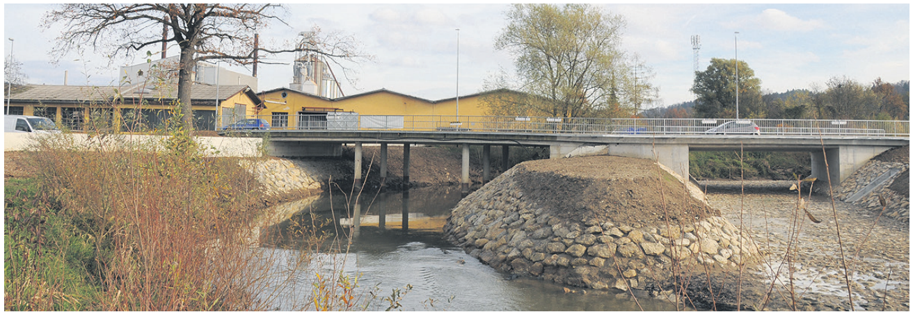
Ker je zelo prometna cesta proti naselju Hruševce pri mostu čez Kozarico trenutno zaprta, so uredili obvoz s pontonskim mostom po Cesti Leona Dobrotinška, mimo trgovine Jager in centra Aspara do obstoječe javne ceste pri Osnovni šoli Hruševce. Dela naj bi predvidoma zaključili do konca novembra.

Čeprav je protipoplavna zaščita načeloma stvar države, v Šentjurju uspeh na tem področju pripisujejo predvsem lastni proaktivnosti. Tako so levji delež priprav zajeli že v strategiji prostorskega razvoja občine z urbanistično zasnovo. Pri tem so izdelali tudi ustrezne strokovne podlage za izdelavo vodnogospodarske presoje. Posledično so k akciji spodbudili pristojno ministr-