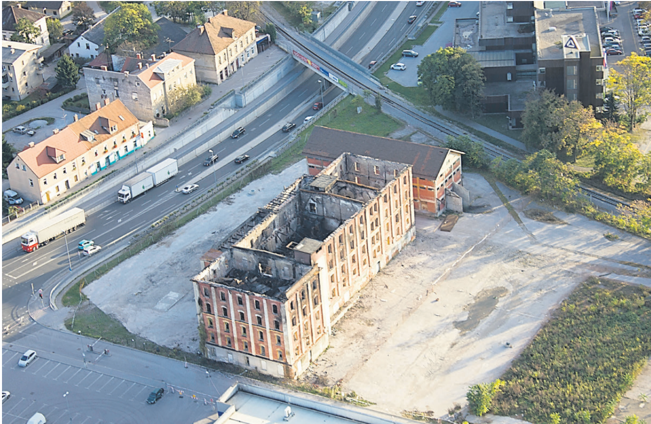
Območje ob Rakuševem mlinu, vključno z Lidlovo trgovino, ostaja še naprej začasno zaprto, v mestni občini pa v tem času zagotavljajo 24-urni nadzor varnostne službe.