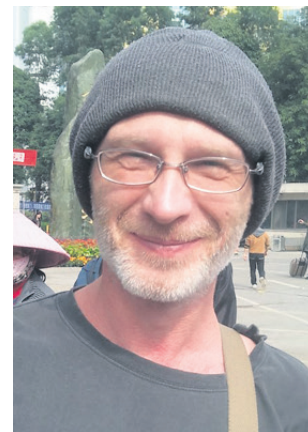
Piše: Peter Zupanc

če ne manj. Kdo torej kupuje te karte oziroma kdo odloča, kdaj in zakaj bi šel v kino?