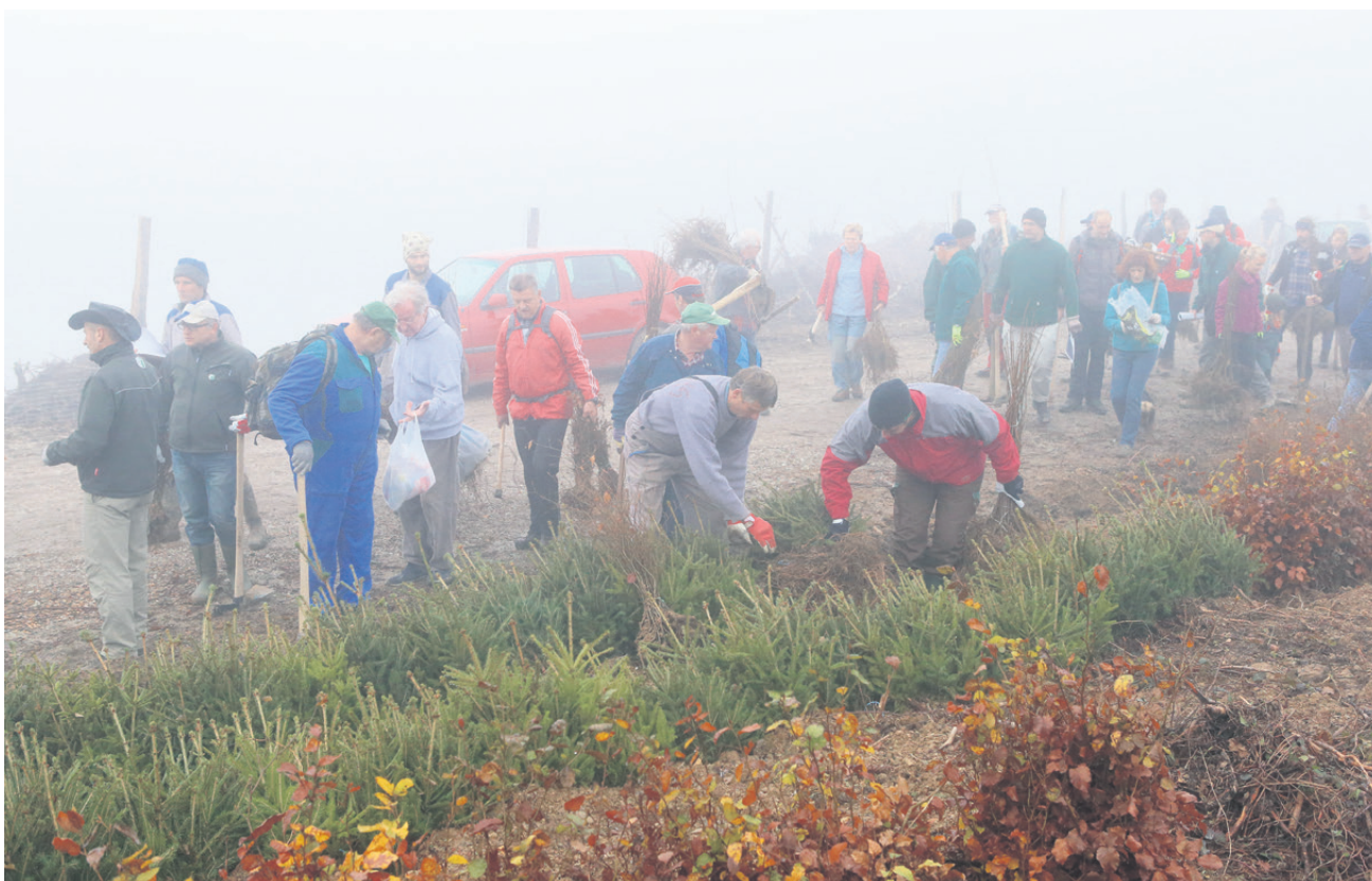
Prostovoljci so sadili bukev, gorski javor, češnje in smreke.