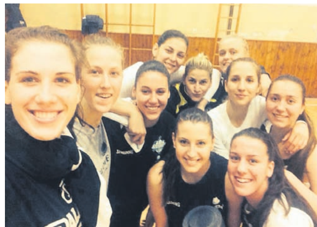
Nasmejanih celjskih deset v Skopju

Zasedba Athleta je bila v Skopju nastanjena v hotelu Vip ob nacionalni televiziji. V bližini je bilo v večernih urah na ulici ogromno prodajalk ljubezni. Cene v trgovinah, na tržnicah in v lokalih so v primerjavi z našimi izjemno nizke. Bivanje v hotelu s polnim penzionom stane le 26 evrov. Cene pijač in hrane so skoraj za dve tretjini nižje.