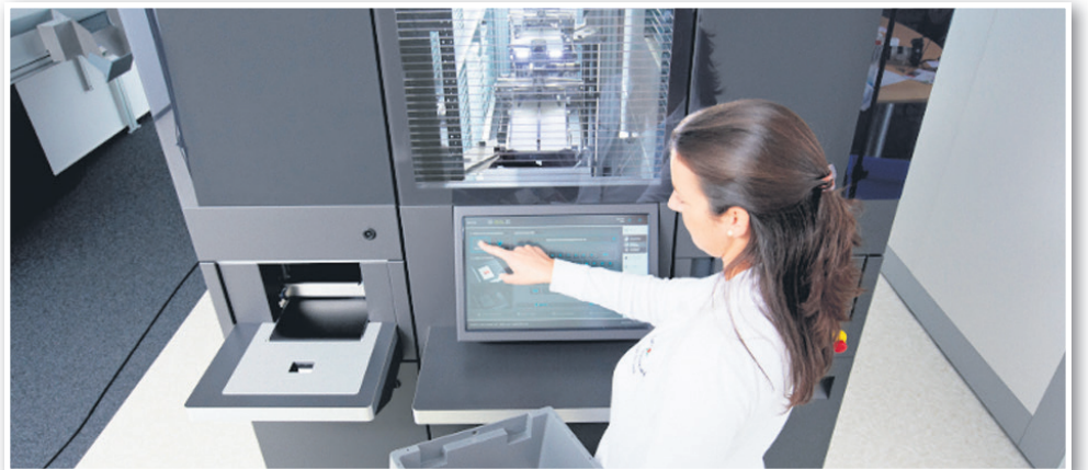
Skladiščni robotski sistem Rowa Vmax

Po napadu je bolnik ponavadi zmeden. Zmedenost lahko traja dlje časa. Pri večini napadov nujna medicinska pomoč ni potrebna, saj napadi prenehajo po nekaj minutah. Včasih pa je prva pomoč, ki jo nudijo reševalci, še kako potrebna. Napad pri osebi, ki sicer nima epilepsije, je lahko znak resne bolezni. Reševalce morajo očitvidci poklicati tudi, če napad traja dlje od 5 minut, če oseba počasi okrevi, spet dobi napad ali težko diha po napadu, če oseba ostane zmedena ali se ne zaveda popolnoma dogajanja okoli sebe, če gre za nosečnico in če ima bolnik znake poškodb ali je hudo bolan.