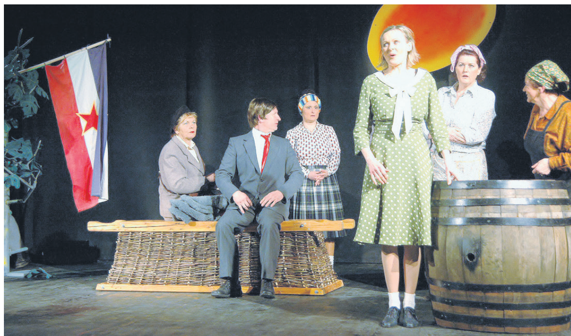
Prizor iz predstave Češpe na figi (Južič in Juča) v režiji Sergeja Verča

že omenjenih, pisal tudi za pod Magnificovo glasbo za Siddhartha in več oddaj na film Montevideo, vidimo se! RTV Slovenija. Nazadnje se SPELA OŽIR je kot aranžer podpisal tudi