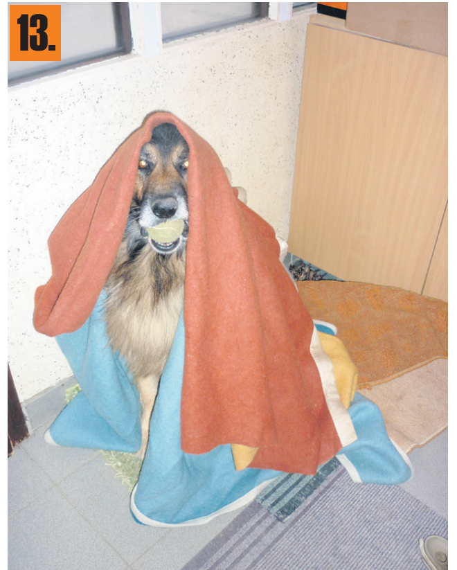
13. »Fotografija je nastala, ko je bilo že mrzlo in je našega psa Idola zeblo, zato se je prelevil v volka z oblačili Rdeče kapice. Najvažnejša pa je žoga, ki reši vse težave,« je zapisal Boris Maroh iz Kasaz.