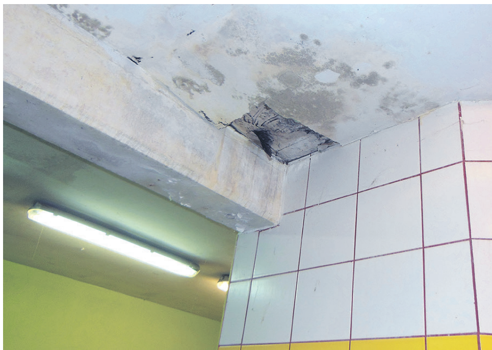
V garderobah odpada omet, zaradi zamakanja se je pojavila tudi plesen.

Okoli pomožnega igrišča so raztrgane mreže za lovljenje žog, v garderobah odpada omet, okvarjenih je ogromno tušev, iz nekaterih že leto pušča voda, prav tako tudi streha na objektu že dlje pušča, žlebovi prav tako, po stenah se razširja plesen. V eni od garderob se je pred kratkim udrl strop, so v sporočilu za javnost zapisali starši. Bojijo se, da se bo to zgodilo tudi v drugih garderobah. Težavo predstavlja tudi pomanjkanje prostora za trening. »Imamo igrišče, ki je preobremenjeno, na igrišču z umetno travo, ki je pod reflektorji, pa se izmenjujejo vse selekcije,« je potarnal Dover. Pomožno igrišče naj bi bilo v dežju neprimerno za