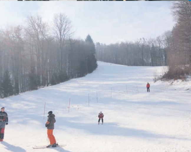
rand hotelom Donat. Dolžina smučarske proge je 400 metrov, višinska vlečnica lahko prepelje 640 oseb na uro.