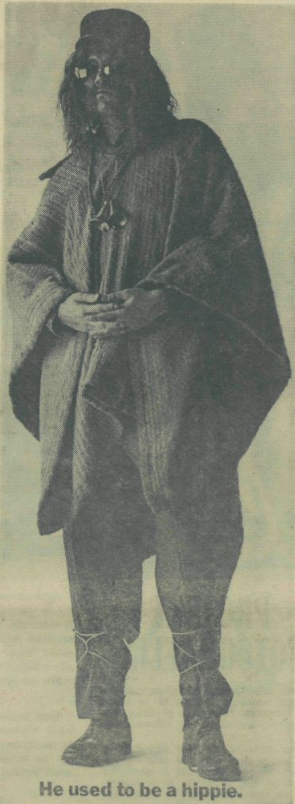
He used to be a hippie.