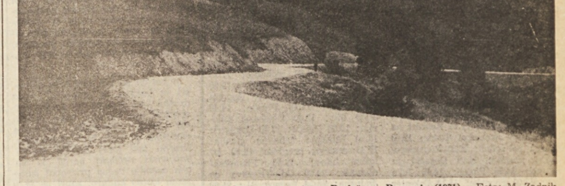
Pod Karlovcu pri Pregarju: ko je prodrla prva cesta s Prelož na Pregarje (1971)