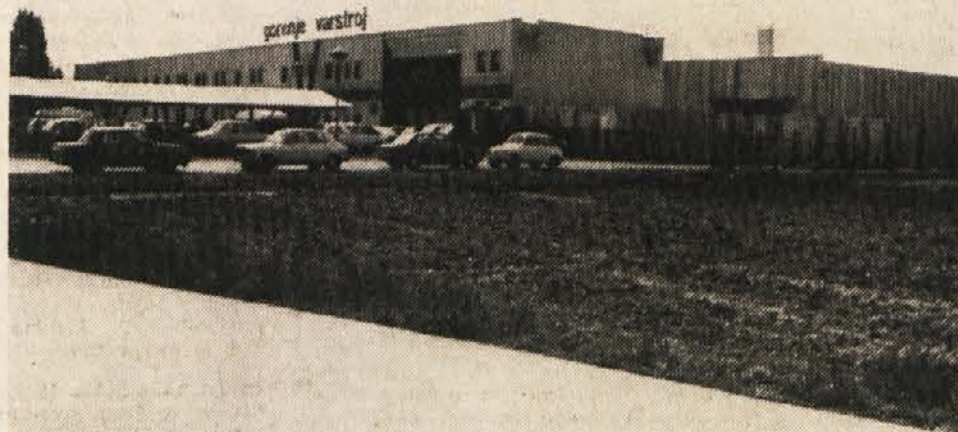
Levo: Proizvodna hala iz „VEMONT“ elementov

Z vse večjo izdelavo in finalizacijo v sami tovarni se vse bolj uresničuje geslo — „od obrtniške do industrijske gradnje“.