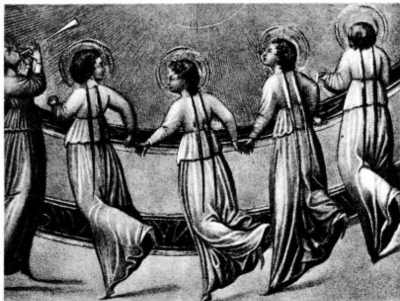
„Slava Bogu na višavah!“