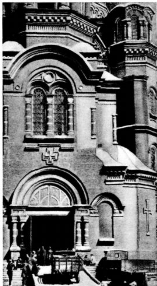
Krasna ruska cerkev, ki so jo komunisti spremenili v avto-garažo