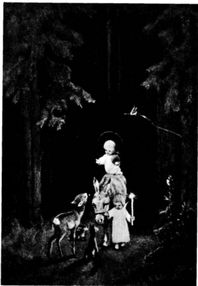
„Majhen otrok nam je danes rojen: imenoval se bo Bog, Močni. Aleluja, aleluja“