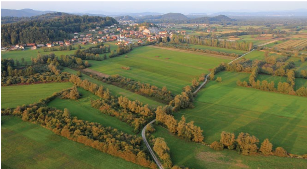
Slika 1: Prepletanje življenjskih okolij na Ljubljanskem barju.

Na južnem robu Barja iz več kraških izvirov izvira reka Ljubljanica, ki ne prinaša velikih količin naplavin. Nekraški pritoki, predvsem Iška na jugovzhodu in Gradaščica na severu, pa so nasuli obširne vršaje, tako da je površje Barja najnižje v sredini in se postopoma dviguje proti robovom. Ljubljanica je v barjanske naplavine vrezala več metrov globoko strugo, vendar ima pri svojem 20 km dolgem toku izredno majhen padec (dno struge pri Verdu je na nadmorski višini 285,31 m, pod Tromostovjem v Ljubljani 284,00 m), kar povzroča stalne poplave (4).