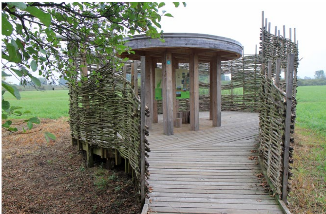
Slika 5: Na Ljubljanskem barju nastaja mreža interpretativnih vsebin.

Zato je eden od namenov zavarovanih območij prav interpretacija naravnih vrednot in kulturne dediščine; namenjena mora biti tako lokalnemu prebivalstvu kot obiskovalcem. Turizem in rekreacija prinašata na takšnih območjih številne vplive na ekosisteme, tako pozitivne kakor tudi negativne. Ključna