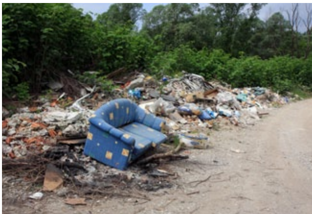
Slika 4: Divja odlagališča kazijo podobo Barja in ogrožajo vodne vire.

Ustanovitev krajinskega parka in režimi delovanja torej ne pomenijo zgolj ohranjanja rastlinskih in živalskih vrst ter njihovih življenjskih prostorov, temveč tudi aktivno vključitev lokalnega prebivalstva, lokalnih skupnosti, interesnih skupin ter podjetniških pobud v vse trajnostno naravnane dejavnosti načrtovanja in upravljanja z zavarovanim območjem. Park je namenjen predvsem ohranjanju pokrajine in sprostitvi človeka.