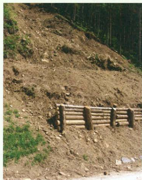
Sanacija zemeljskega plazja v Velunjskem jarku

Po intervencijskem zakonu za večletno sanacijo žledoloma, nastalega med 31. januarjem in 10. februarjem 2014, ki določa tudi pogoje za pridobitev finančnih sredstev v letu 2014, je bil narejen tudi