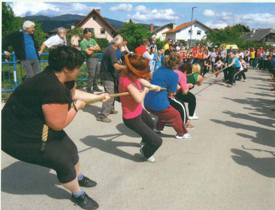
Ženski ekipi; močnejša je bila starotrška.

Tekmovanje v vlečenju vrvi je potekalo na mostu čez Suhodolnico (Podgorska cesta–Stari trg). V preizkušanju moči med levim in desnim bregom na novo regulirane struge je sodelovalo šest ekip, in sicer dve ženski (ČS Štibus in ČS Stari trg-mesto) in štiri moške (ČS Štibus, VS Stari trg in ČS Stari trg-mesto). Po zelo izenačeni borbi je pokal za letošnje leto v ženski konkurenci romal na levi breg Suhodolnice v ČS Stari trg. Med moškimi ekipami pa je pokal osvojila ekipa ČS Štibus. Lepa pomladna sobota je na prireditvev pritegnila več kot sto obiskovalcev z obeh bregov Suhodolnice, organizatorji (ČS Štibus in Stari trg ter GD Stari trg) pa so za vse obiskovalce skuhalo golaž in poskrbeli za hladno osvežilno pijačo. Ob prijetnem druženju smo bili vsi udeleženci enotnega mnenja, da mora biti tekmovanje tradicionalno.