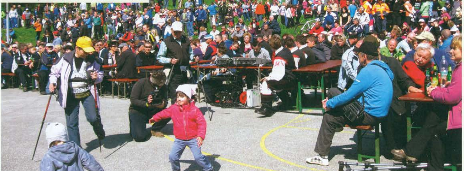
Množica ljudi se zgrinja na prireditvenem prostoru.