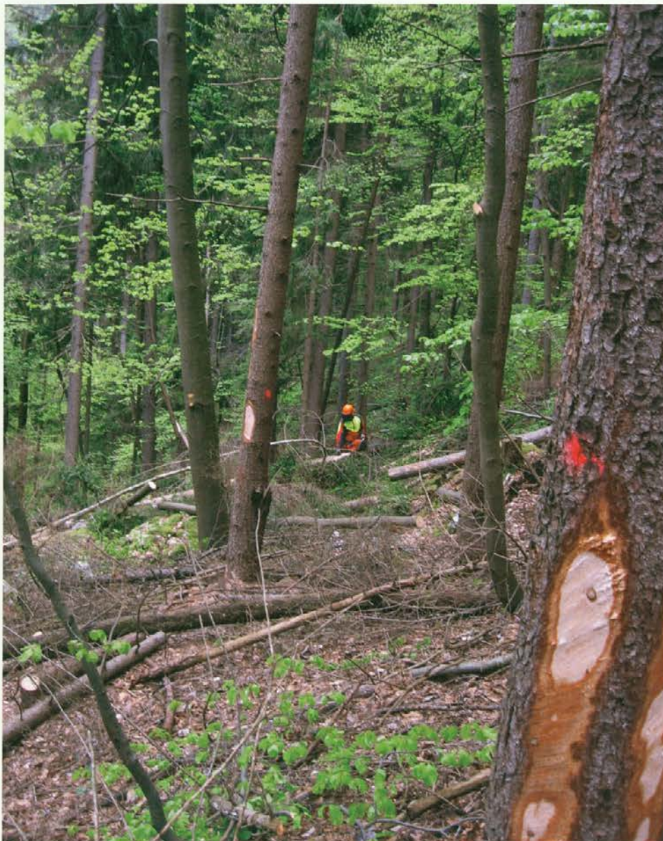
Izdelava lubadark in po žledu poškodovanega drevja

razdelilnik teh sredstev – večji del je namenjen izvajanju prevoznosti gozdnih prometnic v po žledu poškodovanih gozdovih, del pa tudi za preventivno varstvena dela.