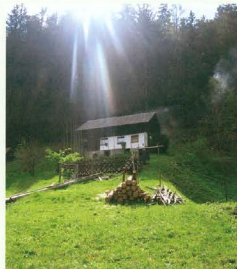
Sončni žarki in kontrolno lovna past za podlubnike pri Fujsu na Riflovemu vrhu nad Prevaljami