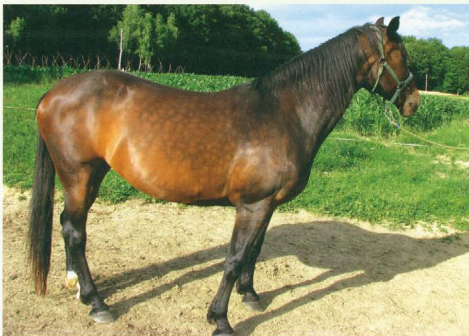
Konj slovenske toplokrvne pasme

"Vem za eno fino restavracijo na Bledu!" sem se spomnila. "Tam smo jedli, ko sem še hodila v službo!" Nepozabno, kake jedi smo jedli. In na koncu blejska kremna rezina in kupica žlahtnega vina!" sem se v mislih kar oblizovala. Manček, ki se ga je moje zanesenost prijela, me je kar vlekel s klopi: "Hitro, hitro greva, da bova dobila prostor." "O, ne skrbi, tam je tako drago, da je vedno dovolj prostora," sem ga preizkušala, on pa nič, ker je bil prepričan, da ga jaz vabim in častim in da