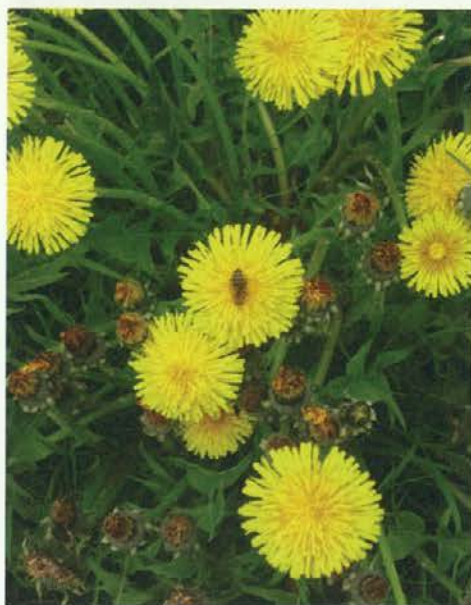
Čebela na regratu (27. 4. 2014)

iglavcev izdane odločbe, je ZGS poslalo obvestilo s priloženim obrazcem za podaljšanje roka. V OE Slovenj Gradec je bilo poslanih 1350 obvestil. Na osnovi prejetih obvestil lastniki v dogovoru z revirnim gozdarjem glede na podane vzroke nedokončanja sečnje prejmejo novo odločbo o določitvi novega roka. Ne glede na vse težave, ki ovirajo odkup lesa, naj lastniki in izvajalci čim prej in dosledno, z upoštevanjem gozdnega reda, izvedejo sanacijo žledoloma v svojem gozdu, da se naslednja leta ne bomo ubadali s še večjimi težavami, ki nam jih bodo povzročali podlubniki!