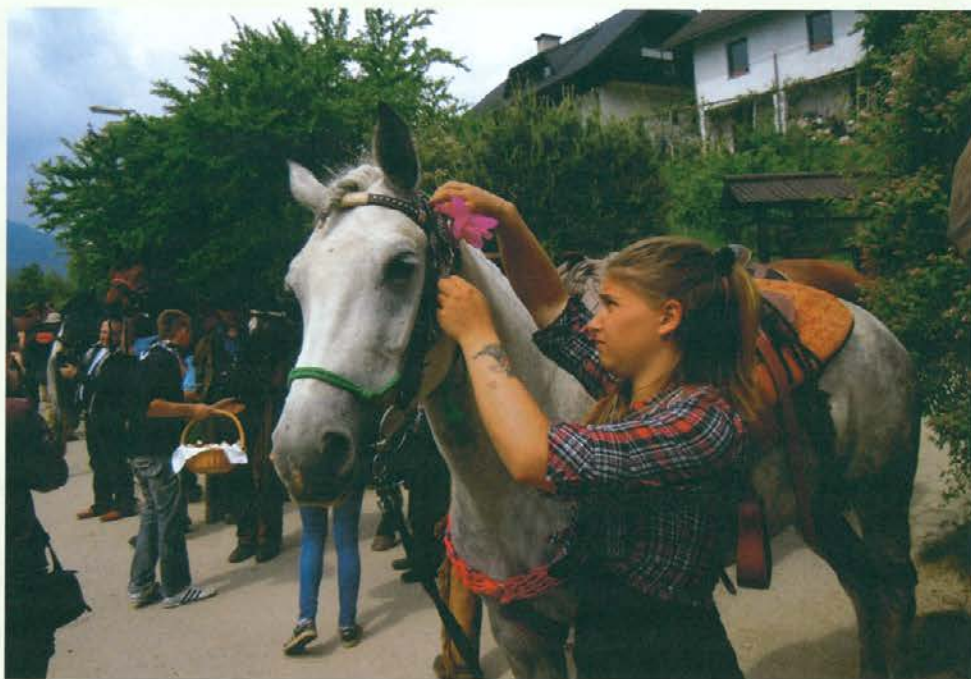
Blagoslov konj pri sv. Pankraciju v Grajski vasi

Tako smo se lahko v slovenjgraški občini v dveh majskih nedeljah zaporedoma udeležili blagoslovov konj. 4. maja je Cross Country Club Legen priredil že dvaindvajseti Jurijev blagoslov na Legnu, tokrat na športnem igrišču Legen. Prijezdilo je 70 konjenikov, tudi vprega je bila na ogled in nepogrešljiv