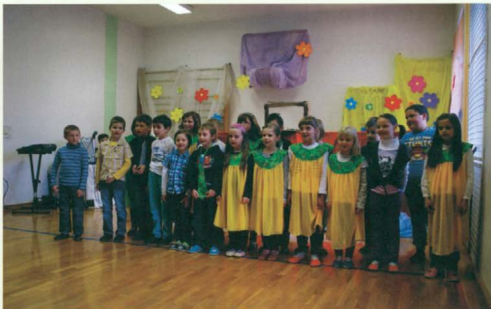
Ob materinskemu dnevu

Skupaj z zgodnjim začetkom pomladi so se zavzeto lotili spomladanskih opravil tudi učenci OŠ Sele-Vrhe skupaj z učiteljicami ter prostovoljci, ki so jim pomagali pri