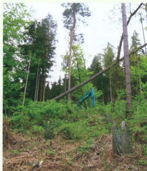
„Zverina“ čisti poškodovano vlako.