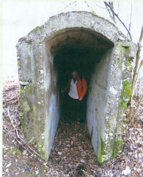
Bunker Rupnikove linije

pod sabo, a ni tako, ta je bila zgrajena med II. svetovno vojno in končana po njej, utrdbe pa so zgradili še v stari Jugoslaviji. So pa bili zgrajeni za varovanje Dravograda pred možnimi napadalci s severa in za zaščito železniškega mostu Labotske proge čez reko Dravo, ki ga je jugoslovanska vojska minirala pred vdorom Nemcev leta 1941.