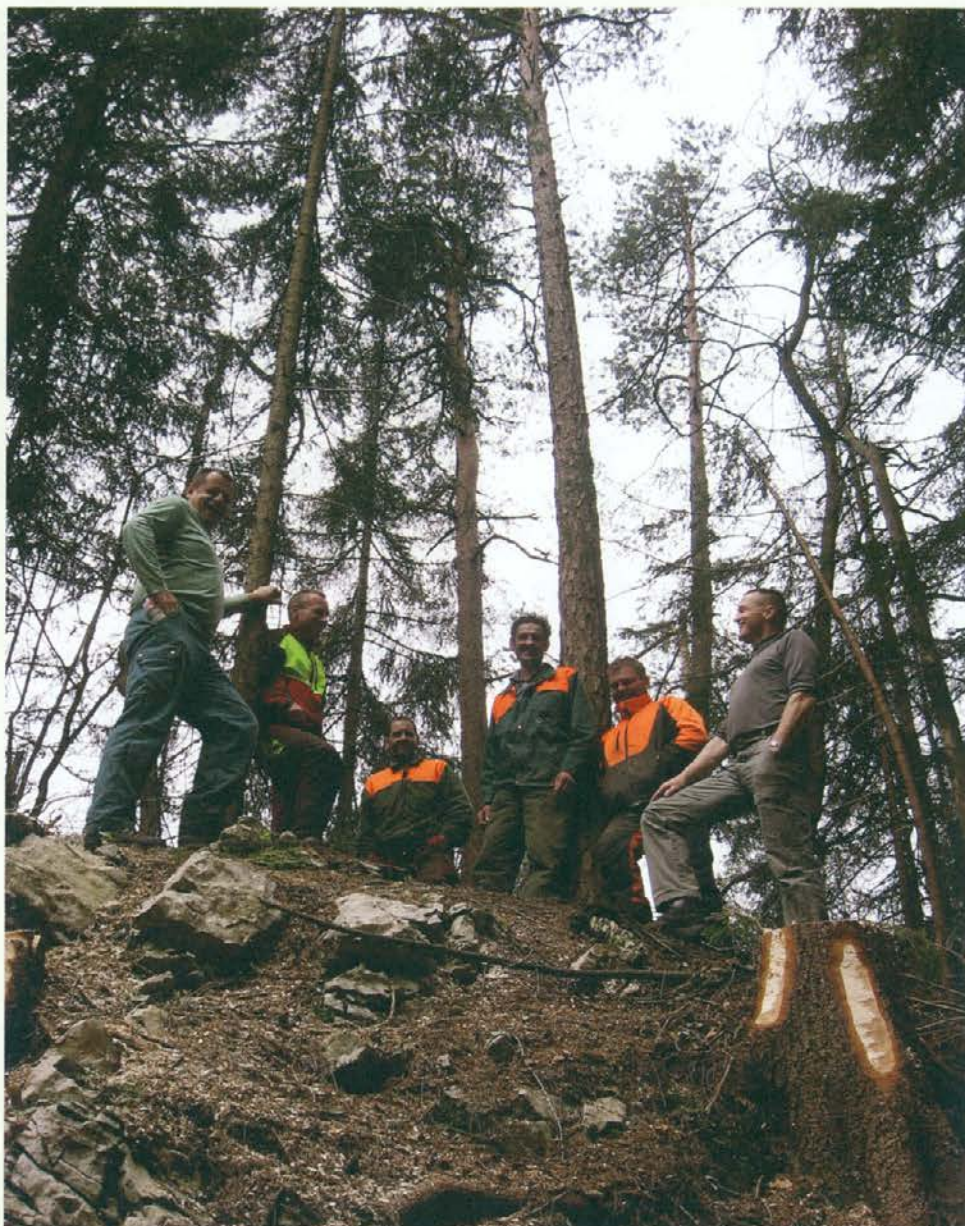
Slovenjgraški olcarji v družbi gozdarjev KE Slovenj Gradec med malico nad Suhim dolom

Da bi zmanjšali prekomerno namnožitev podlubnikov, je zelo pomembno, da pravočasno posekamo poškodovane iglavce. Upoštevati je treba navodila revirnih gozdarjev, podana na odločbi. V koroškem gozdnogospodarskem območju so revirni gozdarji izdali lastnikom poškodovanih gozdov individualne C-odločbe z rokom izvedbe poseka in izdelave označenih iglavcev do 15. maja 2014. Vsem lastnikom gozdov, ki so jim bile za sanacijo žledoloma