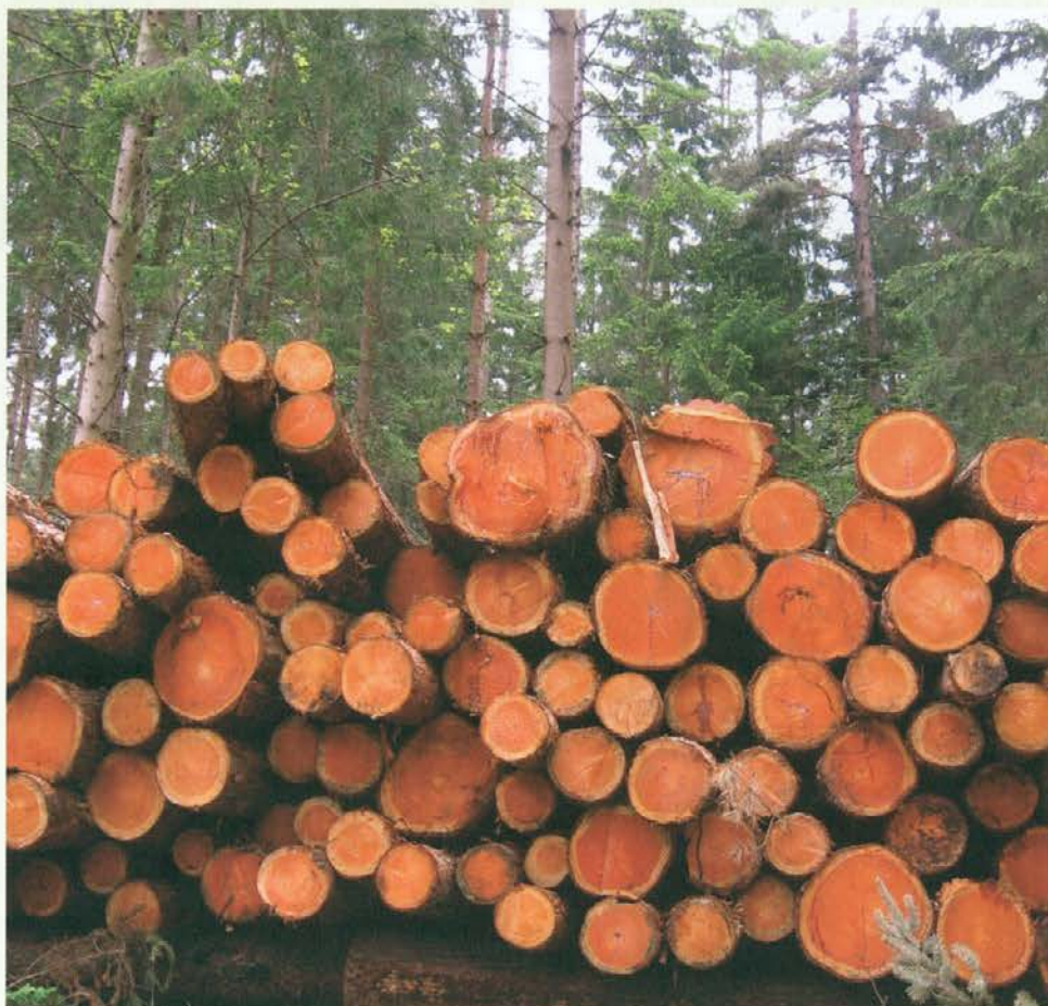
Skladovnica hlodov po žledu poškodovanega rdečega bora čaka na kupca

Za nami sta prva dva pomladanska meseca, ki sta bila tako vremensko kot gozdarsko pestra. Oba sta bila mokra, a količina padavin ni bila obilna. Časovno so bila na Koroškem dnevna deževna obdobja v marcu krajša kot v aprilu. Mokro je bilo v marcu prvi in tretji teden, v aprilu pa so ta obdobja bila prisotna kar čez ves mesec. April se glede na dež ni izneveril. Več sončnih dni je bilo v marcu. Marčevske najnižje dnevne temperature so bile med -4 (12. 3.) in 11 °C (23. 3.) in najvišje dnevne temperature med 4 in 22 °C. V marcu je bilo topleje v drugi polovici meseca. Najnižje dnevne temperature v aprilu so bile med -2 in 21 °C (8. 4.). Kljub večjemu deležu oblačnosti in dežja je bila povprečna mesečna temperatura v aprilu okoli 10 °C. Zemlja se je v globini 10 cm