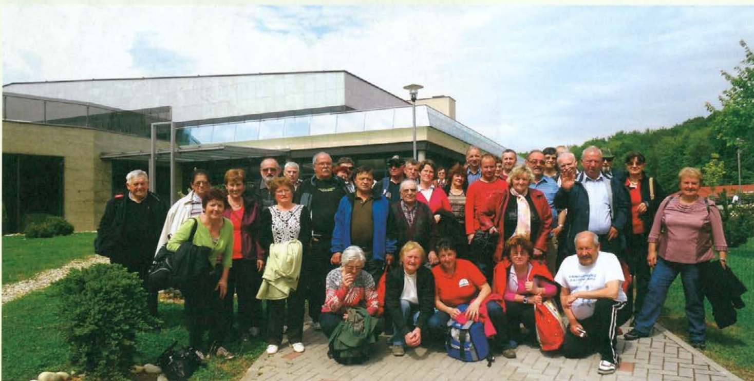
V Biotermah smo se imeli res dobro.

je pitna in ugodno vpliva na težave z želodcem, z žolčnimi izvodili in sečili, seveda pa tudi na dobro počutje. Voda je zelo bogata, vsebuje od natrija, kalija, magnezija, železa do drugih primesi. Namakanje v topli vodi je zelo prijalo. Za vse je bilo lepo poskrbljeno, kopanje, prevoz in hrano, ki je bila zelo okusna. Za priboljšek pa je poskrbela žena predsednika društva iz Pameč, saj so bili rogljički res dobri. Da smo zapolnili še čas, smo se odpeljali v Veržej, kjer smo si ogledali mlin na Muri in nakupili moko.