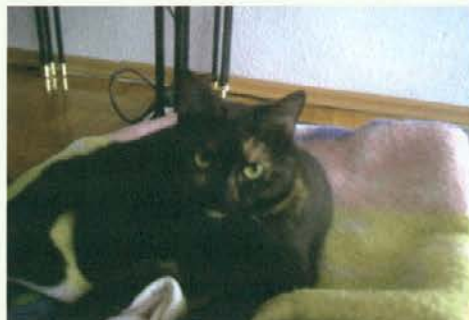
Zastrupljena mačka je že okrevala.

Po definiciji so insekticidi snovi naravnega ali umetnega izvora, ki so toksične za žuželke in jih uporabljamo za zatiranje tistih žuželk, ki so s stališča človeka škodljivci. Zaradi svoje kemijske zgradbe negativno vplivajo na metabolizem žuželk in bistveno povečajo njihovo smrtnost.