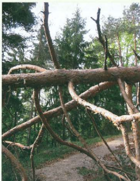
Pogled skozi podrto krošnjo rdečega bora na po žledu poškodovano gozdno površino

V aprilu je potekala tudi načrtovana sadnja v prejšnjih letih po ujmah poškodovanih gozdov (sanacija starih žarišč). Začeli smo tudi s pripravami na aktivnosti ob letošnjem tednu gozdov, o katerih vas bomo obvestili v naslednji številki Viharnika . Izbrali smo tudi najbolj skrbne lastnike gozdov na krajevnih enotah in