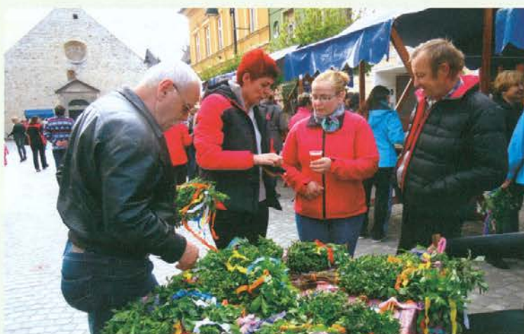
Izbira velikonočnih snopov je bila velika.