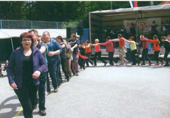
Prijetno razpoloženi plesalci na družabnem delu srečanja.

Srečanje se je nadaljevalo v prijetnem druženju udeležencev ob glasbi skupine Bratov Avbreht. Nekateri pohodniki so iz Završ nadaljevali pot še na Graško goro, kjer so Velenjčani pripravili svoj prvomajski shod, drugi pa so se po različnih poteh vrnili nazaj v dolino.