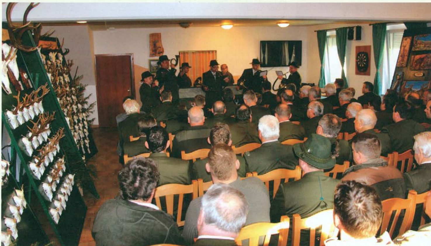
Lovska razstava v Slovenj Gradcu je pritegnila veliko zanimanja med lovci iz LGB Slovenj Gradec.

Za "pritajevalce" je značilno, da v zgodnjem obdobju živita mati in mladič ločeno, mladiči pa so spočetka gibalno slabo razviti. To so ugotovili po tem, da mladič prepozna oglašanje matere, obratno pa ne. Zato se mladiči skrivajo in izogibajo plenilcem v gozdnih robovih in kmetijskih kulturah. Pri srnjadi takšno vedenje traja do osem tednov in postopoma slabi, kar se kaže z večanjem ubežne razdalje. Travniske razmere so priljubljen prostor za odlaganje in pritajevanje mladičev srnjadi, zaradi tega predstavlja človek s košnjo veliko nevarnost za njihovo smrtnost. Nasproti pritajevanju pa poznamo tudi "mladiče sledilce", med katere spadata denimo alpski kozorog in muflon. Ti so že takoj ob