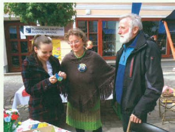
Da je prireditev pomembna, s svojo prisotnostjo potrjujejo predstavniki MO SG in Koroške nasploh.