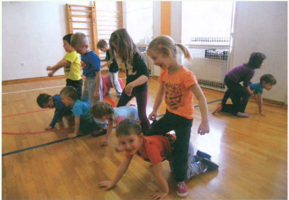
Igra je učenje.

V vrtcu smo v sodelovanju s starši otrok, tudi nekdanjih, pripravili razstavo gob in drugih gozdnih plodov. Ogleдал si jo je tudi naš župan, ko je obiskal POŠ Sele. Izrezane gobe iz kartona so otroci