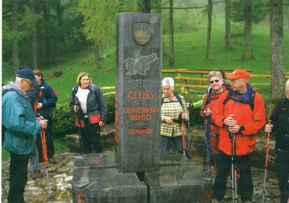
GEOS, geometrično središče Slovenije

Doliški gasilci vsako leto v čast zavetnika gasilcev sv. Florjana pripravljajo tudi srečanje gasilcev iz Mislinjske doline v njihovem domačem kraju. Letošnje srečanje je bilo že 21. po vrsti, udeležila pa so se ga domala vsa gasilska društva, ki delujejo v Mislinjski dolini. Po gasilski paradi, ki poteka od gostilne Repolusk do farne cerkve, opravijo tudi blagoslov gasilcev in gasilske opreme. Nato se udeležijo slovesne svete maše v cerkvi svetega Florjana, prikažejo krajšo gasilsko vajo, praznovanje pa nadaljujejo in