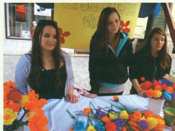
Rož'ce iz krep papirja so delile srednješolke.