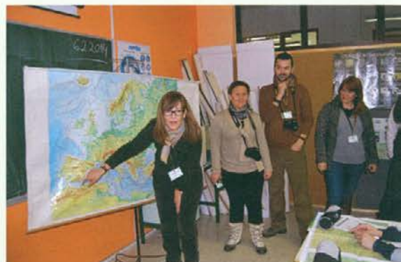
Tu nekje smo doma ....

Če zaključim s španskim pregovorom, ki pravi "Modrost je naš najboljši popotnik", si lahko zaželim samo to, da bi s tem projektom postali bolj modri in bi izboljšali kvaliteto bivanja in sobivanja. Naslednje srečanje lokalnih partnerjev bo spomladi v Luceni, kjer se bomo učili od Špancev.