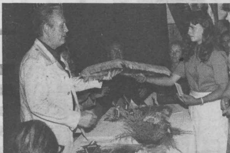
Mladinci Šentruperta so s simboličnim darilom zaželeli, da bi se mladi obeh krajevnih skupnosti večkrat srečali in s svojim delom doprinesli k boljšemu življenju in delu obeh krajevnih skupnosti.

Pobratenje je pri naših narodih vedno pomenilo potrditev dobrega medsebojnega sodelovanja in prijateljstva. Tega so se zavedale tudi KS Prule in KS Šentrupert na Dolenjskem, ki sta podpisali listino o pobratenju in s tem zaključili daljše prizadevanje krajanov obeh krajevnih skupnosti o skupnem sodelovanju na področju ekonomskega in kulturnega življenja.