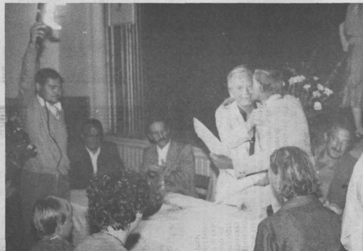
Svečana izmenjava listin o pobratenju je zaključila nekajmesečno dogovarjanje o sodelovanju med obema krajevnima skupnostima, ki resnično temelji na družbenoekonomskih temeljih planov razvoja obeh KS.