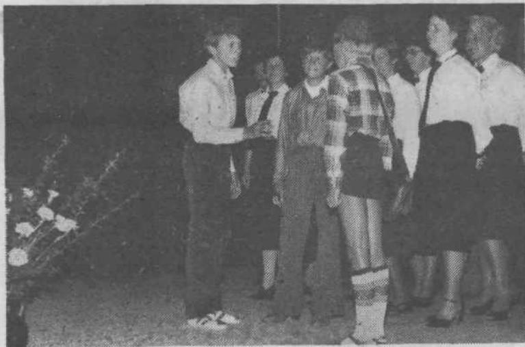
K svečanosti trenutka so doprinesli tudi pionirji KS Šentrupert in pevski zbor Zavoda SRS za statistiko iz Ljubljane, ki so s prijetnim programom razveselili delegate obeh skupščin ob sprejemu listine o pobratenju.