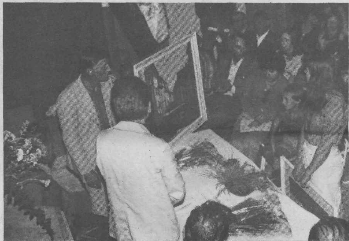
Izmenjava spominskih daril je simbolično potrdila, da se krajan obeh krajevnih skupnosti zavedajo pomembnosti trenutka, ki naj s simboličnimi darili pokaže, da je sodelovanje potrebno in da je to tudi temelj večje povezanosti mesta in vasi.