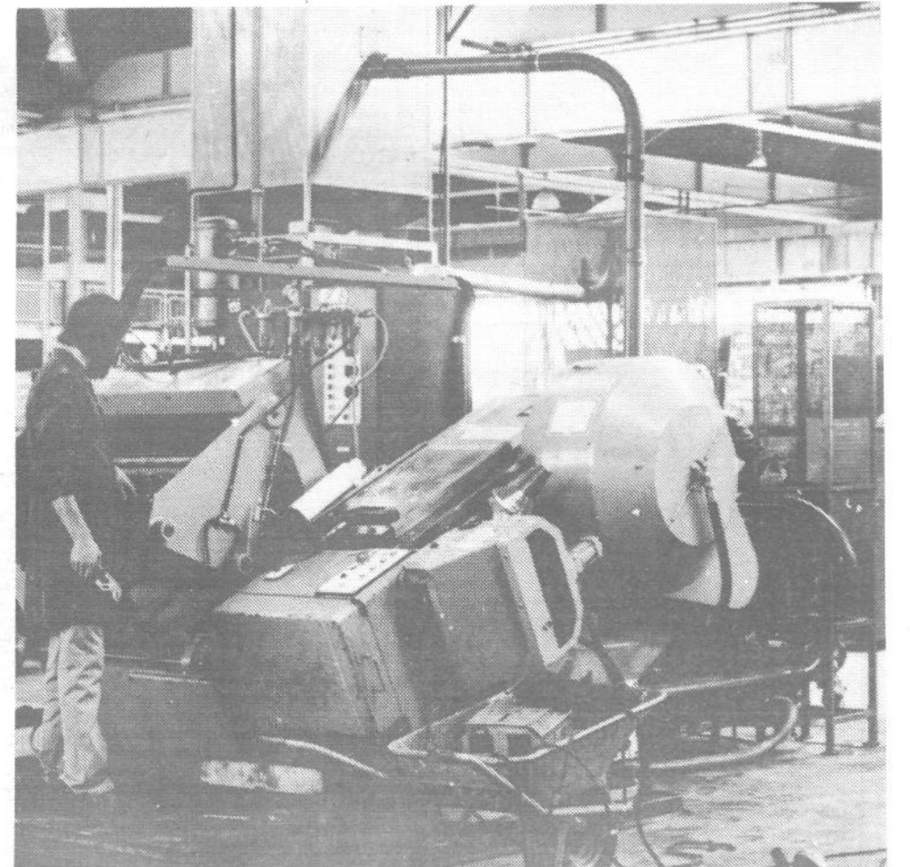
Na linijah za izdelavo navojnih zapork, ki so jih preselili v novo proizvodno dvorano, bodo pričeli v Plutalu izdelovati tudi navojne zaporke za vinske buteljke za jugoslovanske polnilnice. Podobne zaporke za družinske steklenice za vino že izvažajo v velikih količinah v Italijo