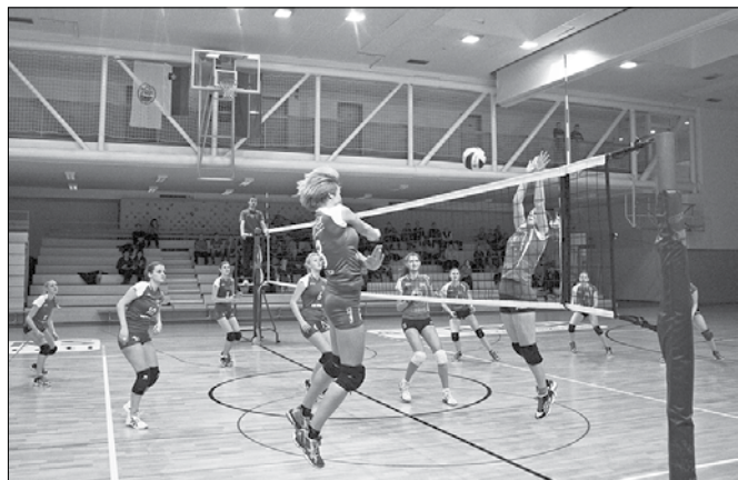
V drugem nizu so Mozirjanke (levo) dobro nasprotovale gostjam iz Šoštanja.