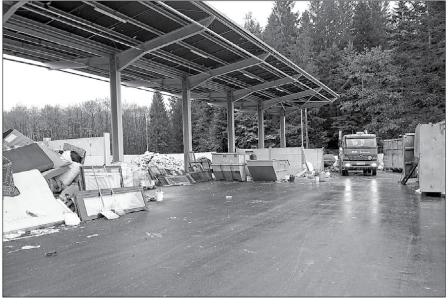
V zbirnem centru koncesionar PUP Saubermacher zbira odpadke pred odvozom v Regionalni center za ravnanje z odpadki Celje.

Občine Gornji Grad, Ljubno, Luče, Solčava in Nazarje so sklenile, da bodo uredile skupni zbirni center. V letu 2010 je gornjegrajska občina pričela s pridobivanjem dokumentacije, v vseh petih občinah pa so sprejeli odloke o podelitvi koncesije za ravnanje z odpadki, pripravili javni razpis in izbrali koncesionarja. Koncesijo za zbiranje in prevoz odpadkov so vse občine podelile edinemu prijavitelju na razpis, podjetju PUP Saubermacher, za odlaganje pa podjetju Simbio iz Celja.