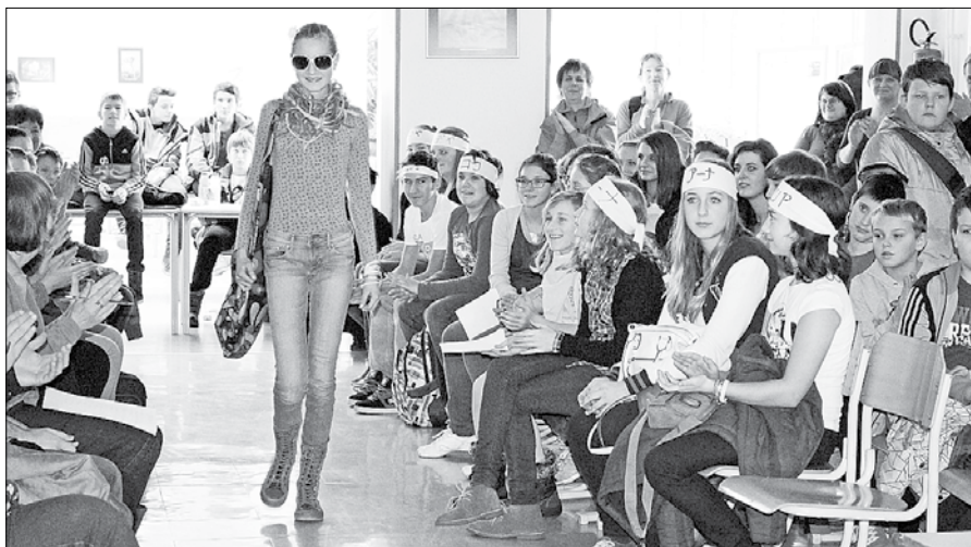
Udeleženci delavnice japonščina in Japonci spremljajo modno revijo.

Najbolj zgovorni so bili prav gotovo udeleženci delavnice japonščina in Japonci, ki so na zaključek prišli z naglavnimi traki, na katere so imeli z japonskimi črkami napisano svoje ime. Poleg tega, da so se pogovarjali o deželi, kultu-