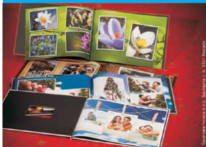
Savinjske novice d.o.o. Savinjska c. 4, 3331 Nazarje