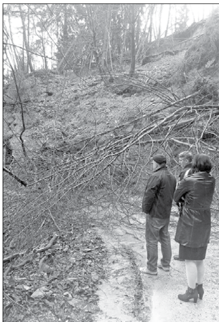
Okoli 500 do 600 kubičnih metrov zemljine in dreves se je odrgalo in zasulo gozdno cesto. (Fotodokumentacija Občine Nazarje)

odredbe o ravnanju z ločeno zbranimi frakcijami pri opravljanju javne službe ravnanja s komunalnimi odpadki je potrebno na območju vsake občine in za vsako naselje z več kot 8.000 prebivalci urediti najmanj en zbirni center. Zbirnega centra ni treba urediti na območju občine, ki ima manj kot 3.000 prebivalcev, če je v okviru javne službe zagotovljeno, da povzročitelji komunalnih odpadkov lahko oddajajo ločene frakcije najmanj v enem zbirnem centru na območju sosestnjih občin.