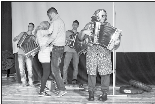
Dijaki so svoje šole predstavili preko zabavnega kulturnega programa.