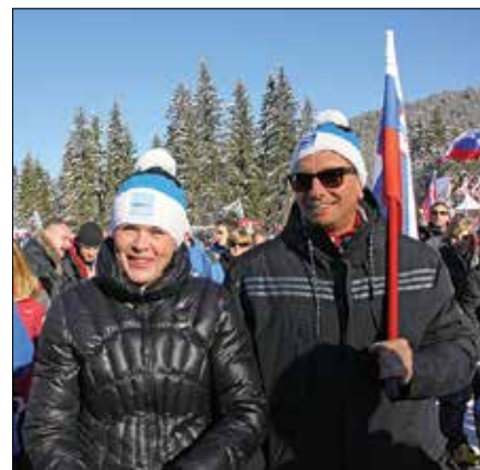
Skoke sta si ogledala tudi predsednik države Borut Pahor in predsednica vlade Alenka Bratovšek, in to v ljubenskih kajah.

Prečudovito vzdušje, podobno kot na Ljub-