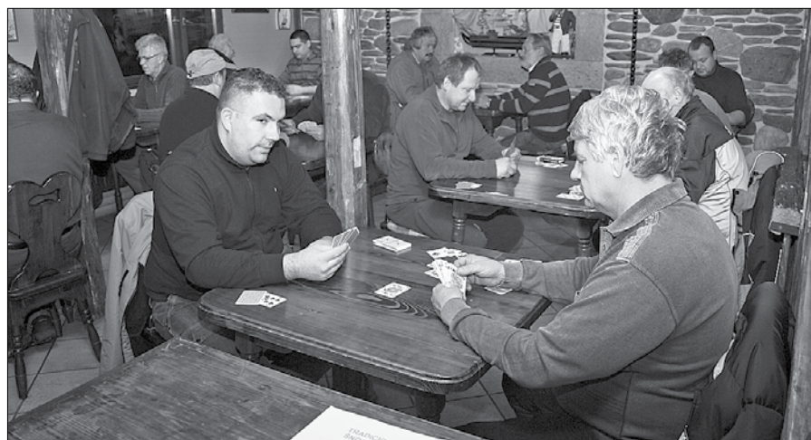
V vsaki ekipi je bilo osem zagrizenih kvartopircev.

Na tradicionalnem turnirju v igranju šnopsa v domu Ribiške družine Mozirje so se zbrali mozirski ribiči in lovci. Slednji so zabeležili še eno v dolgem nizu zmag.