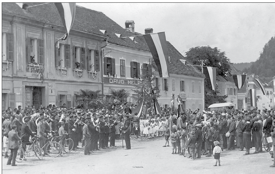
Zbiranje udeležencev proslave ob otvoritvi sokolskega doma 22. julija 1934 na mozirskem trgu.