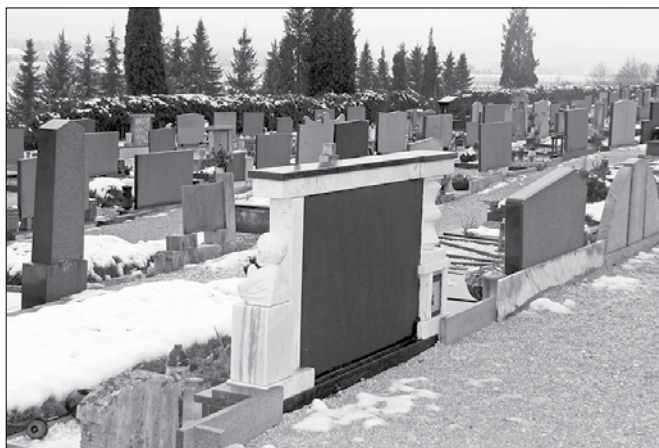
Tudi naše poslednje domovanje postaja vedno bolj cenjena nepremičnina, ki si jo nekateri le še stežka privoščijo.

Pogrebnina je pravica do denarne pomoči ob smrti svojca za plačilo pogrebnih stroškov. Po novem je nekoliko višja, znaša 530 evrov, do nje pa je upravičena samska oseba, ki poskrbi za pogreb in ima dohodek, ki so nižji od 606 evrov,