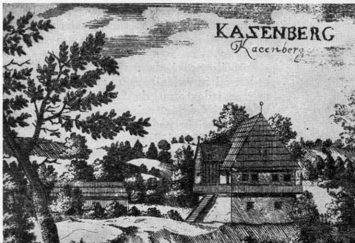
Sl. 1. Katzenberg po Valvasorju

Tudi opatinja iz Mekinj je v pisni vlogi zahtevala, da ne sme Žigan odvajati iz Bistrice vode, ki teče na mekinjski mlin in Fajdigove stope. Obenem je želela zavaroovati samostan, ki je imel pravico drvarjenja v bistriških gozdovih.