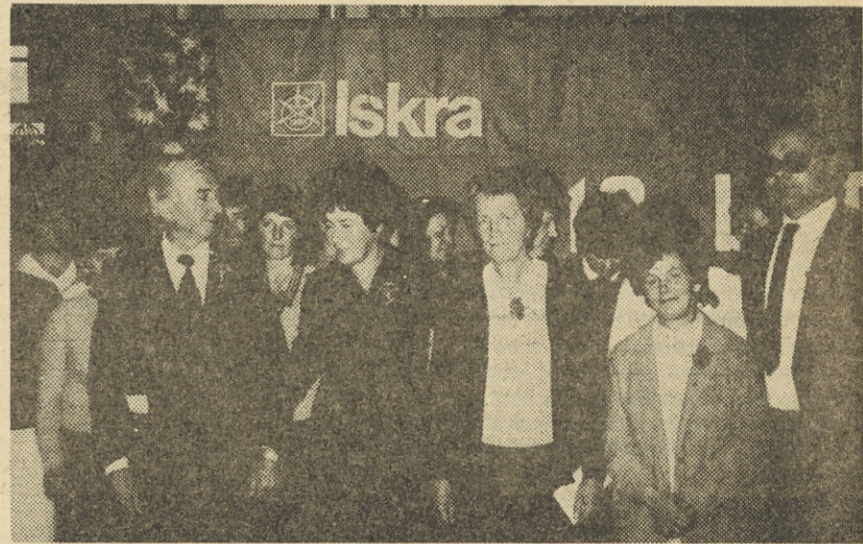
Jubilanti iz Industrijske elektronike.