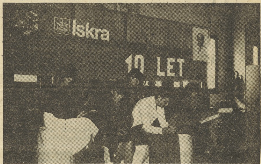
Iz kulturnega sporeda proslave.

so bila postavljena izhodišča za nadaljnji razvoj in mesto varilnega programa v Avtomatiki, so sodelovali tudi predstavniki TOZD Avtomatske in varilne naprave, kot proizvajalka varilne