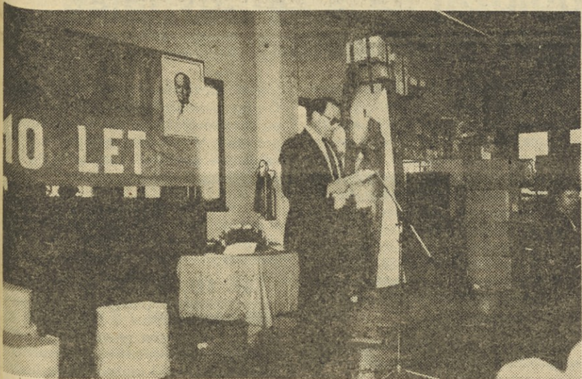
Govori direktor TOZD.