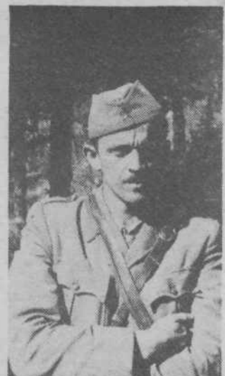
Ivan Maček-Matija, komandant slovenske partizanske vojske

postavil za komandanta Ivana Mačka-Matijo, za komisarja Borisa Kidriča-Petra, za namestnika komandanta Jako Avšiča, za organizatorja vojaško strokovne vzgoje čet pa Eda Miheva.