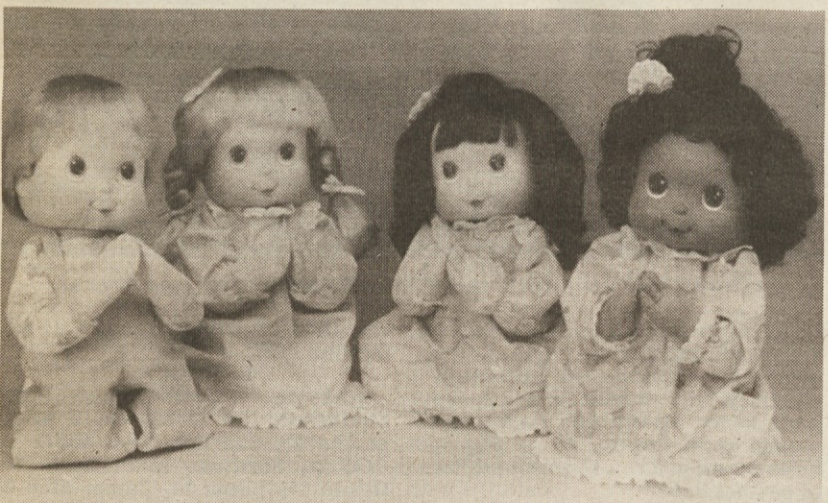
Punčke se cmerijo, lulajo, govorijo, prepevajo, ponavljajo besede, zdaj pa še molijo. S punčkami »Poseben blagoslov« so tudi veroučitelji odveč