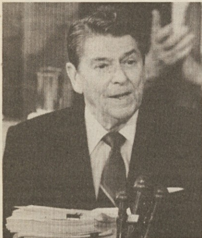
Predsednik Ronald Reagan

WASHINGTON — Ameriški predsednik Ronald Reagan je predsedništvu odigral svojo zadnjo pomembno vlogo. Zbranim delegatom predstavnika doma in senata je predstavil obračun poslovanja ameriške vlade v minulem letu. Kot izkušen igralec se je prerinil do govorniškega odra, medtem ko mu je ameriški politični svet ploskal. S pristnim igriškim trikom je iznenadil še svojo soprogo Nancy, ko se ji je javno zahvalil za trud in požrtvovalnost, s katero se »first lady« bori proti mamilom. Slušateljcem pa je »pokazal«, kako bremenilo je predsedništvovanje, saj je demonstrativno dvigoval po sedem kilogramov težke tipkopise, v katerih je bil zbran predmet njegovega govora, državni obračun.