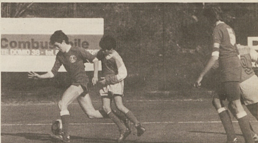
Dvoboj med derbijem naraščajnikov Primorje - Breg na Proseku