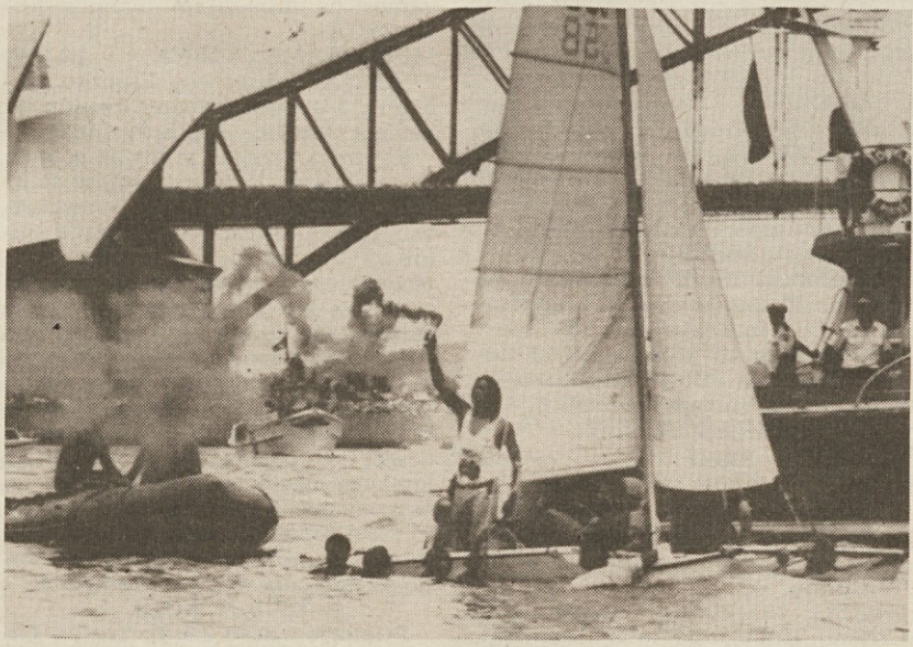
Avstralski domorodci so mirno protestirali tudi v Sydneyem zalivu, neda-leč od Opere

SYDNEY — Dva milijona ljudi se je včeraj v Sydneyu udeležilo začetne slovesnosti ob 200-letnici prihoda prvih belih kolonizatorjev v Avstralijo. Vsi slavnostni govorniki so se potrudili omiliti nesporno zgodovinsko dejstvo, da so bili prvi beli priseljenci le navadni kaznjenci, da je Avstralija postala ogromna kaznilnica, ker je Velika Britanija v ameriški državljanski vojni zgubila svoje severnoameriške kolonije. Waleski princ Charles je zato poudaril, da je ob iskanju primerne kazenske kolonije prve angleške raziskovalce vodila na peti kontinent predvsem želja po novih znanstvenih odkritjih. Navedel je tudi, da se je v novih pogojih, daleč od matične domovine, razvila »nova človečnost«, ki je bistveno vplivala na prve avstralske sodnike, ki so tako dali svoj pečat in postavili temelje avstralski demokraciji. Britanski prestolonaslednik je omenil tudi napake in trpljenje, ki ga je hitra kolonizacija prizadela domorodcem, avtohtonemu prebivalstvu, ki je 40 tisoč let v miru živelo na tem kontinentu. Takoj pa je dodal, da je