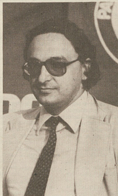
Gianni De Michelis

Včerajšnja preostala razprava je potekala mirno. Sprejeti so bili trije popravki s privoljenjem večine v korist znanstvenim pobudam, mladinske brezposelnosti in malih ter srednjih podjetij. Zadnja točka včerajšnjega dnevnega reda pa je povzročila, kot rečeno, nov potres.