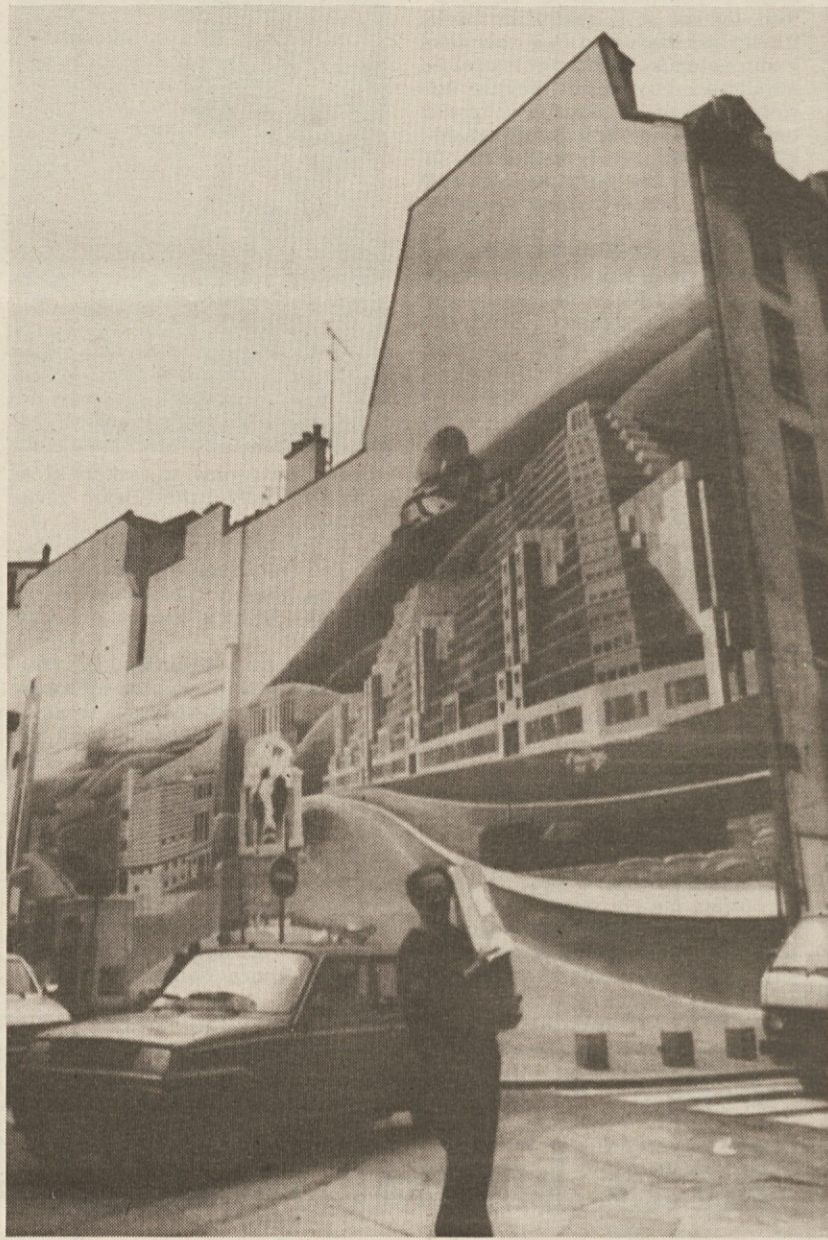
Pariz bodo v kratkem krasile »freske«, ki bodo predstavljale šest utopičnih načrtov futurističnih mest. Ko jih že niso zgradili, jih bodo vsaj naslikali...