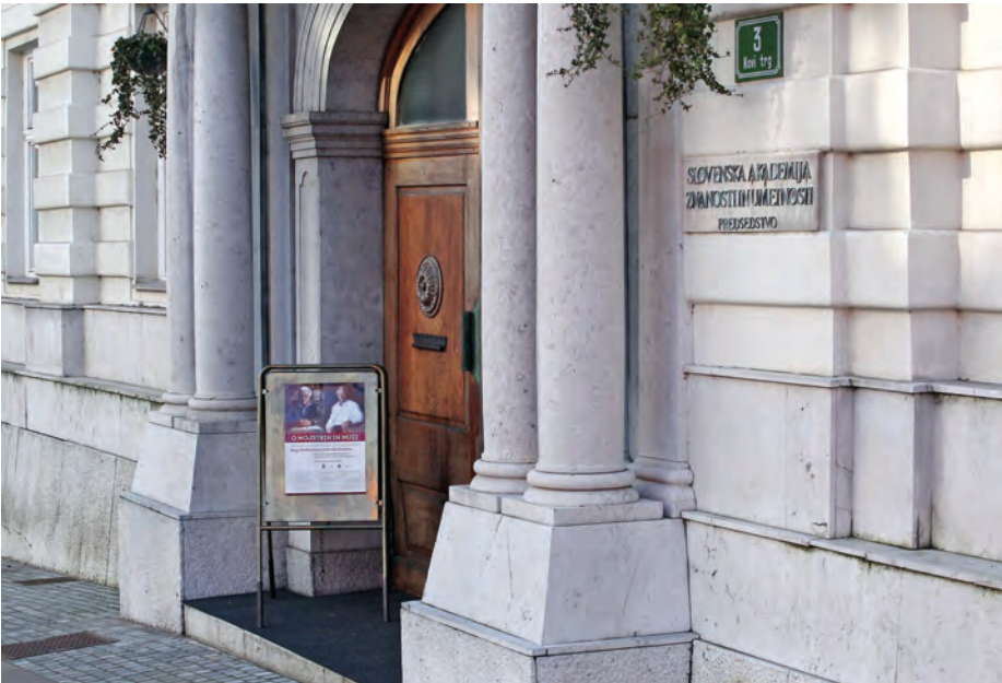
Ob stoletnici rojstva akad. Boga Grafenauerja in akad. Ferda Gestrina je bil znanstveni simpozij O mojstrih in muzi . / The conference On Masters and the Muse on 100 th birthdays of late Academy Members Bogo Grafenauer and Ferdo Gestrin.