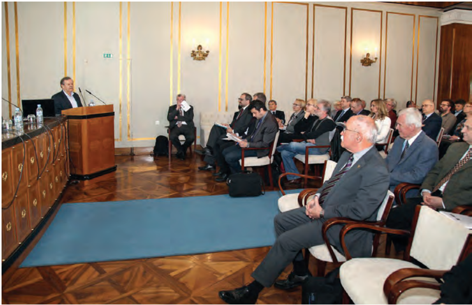
Posvet o pravilniku in zakonu o raziskovalni dejavnosti, ki ga je Akademija organizirala z IAS in ARRS. / Conference on the Rules and Research and development Act, organised by the SASA, Slovenian Academy of Engineering and the Slovenian Research Agency