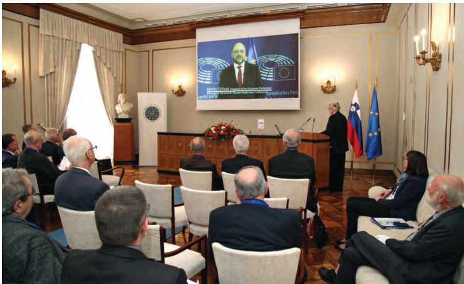
Udeležence 7. konference podonavskih akademij je po videu nagovoril tednji predsednik Evropskega parlamenta Martin Schulz. / Martin Schulz, President of the European Parliament, during a video address at the 7 th Danube Academies Conference.