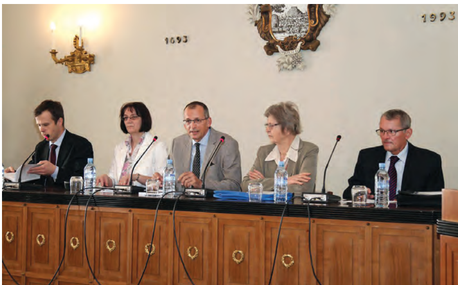
Razred za zgodovinske in družbene vede je predstavil svoje nove publikacije. / The Section of Historical and Social Sciences presented their new publications.