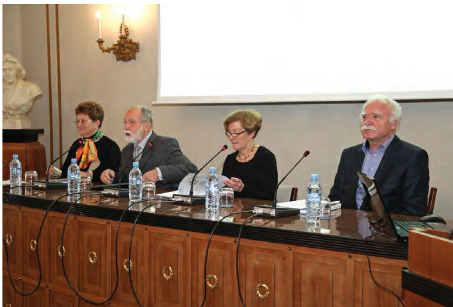
Januarski posvet o metodologijah pri ocenah vplivov tveganja za okolje / January conference Risk Assessment Methodologies