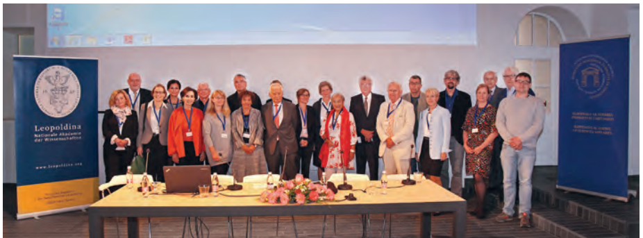
6. simpozija Človekove pravice in znanost: Človekove pravice in begunci v organizaciji SAZU in Nemške nacionalne akademije znanosti Leopoldina se je udeležilo mnogo uglednih gostov in predavateljev. / A number of reputed guests and lecturers participated in the 6 th Symposium Human Rights and Science, organised by the SASA and German national Science Academy Leopoldina.