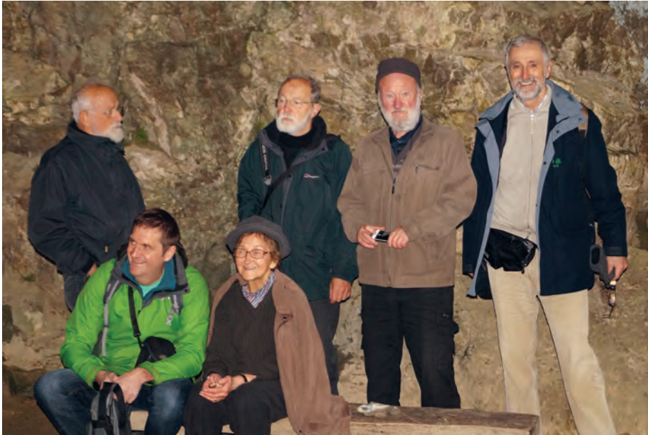
Člani IV. razreda na strokovni ekskurziji parka Škocjanske jame / Members of the Section of Natural Sciences on an excursion to the Škocjan Caves Park.