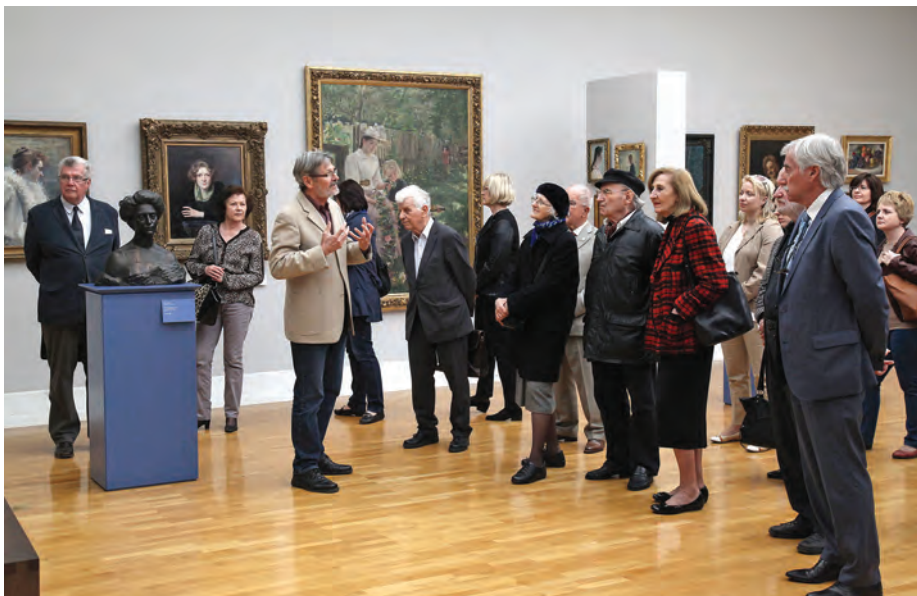
Člani SAZU in zaposleni so obiskali Narodno galerijo. / SASA Members and staff visited the National Gallery.