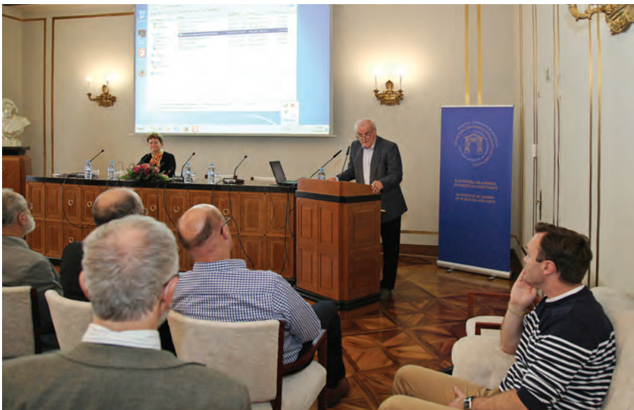
Znanstveno srečanje Sistemski problemi obnove gozdov v sklopu Gozd in les / The conference Forest and Wood – Systemic Problems of Re-forestation .