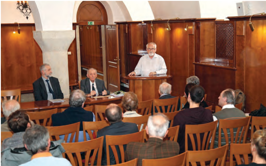
Predstavitev novih zvezkov revije Folia biologica et geologica / Presentation of new folios of the journal Folia biologica et geologica