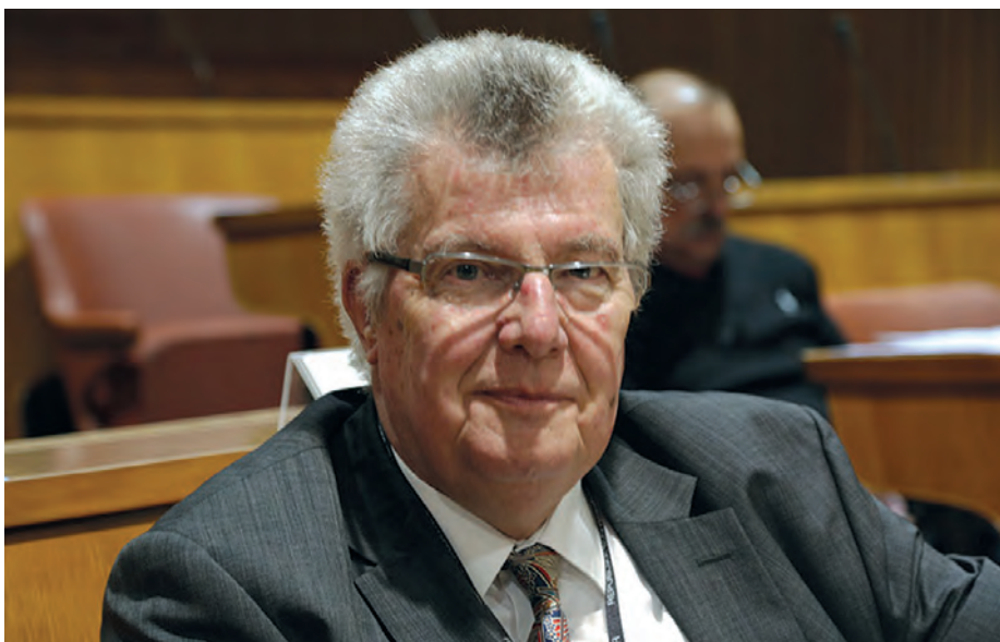
Predsednik Tadej Bajd v državnem svetu na posvetu o javni rabi slovenščine / President Tadej Bajd attended a public debate on the use of Slovenian in the National Council of the Republic of Slovenia