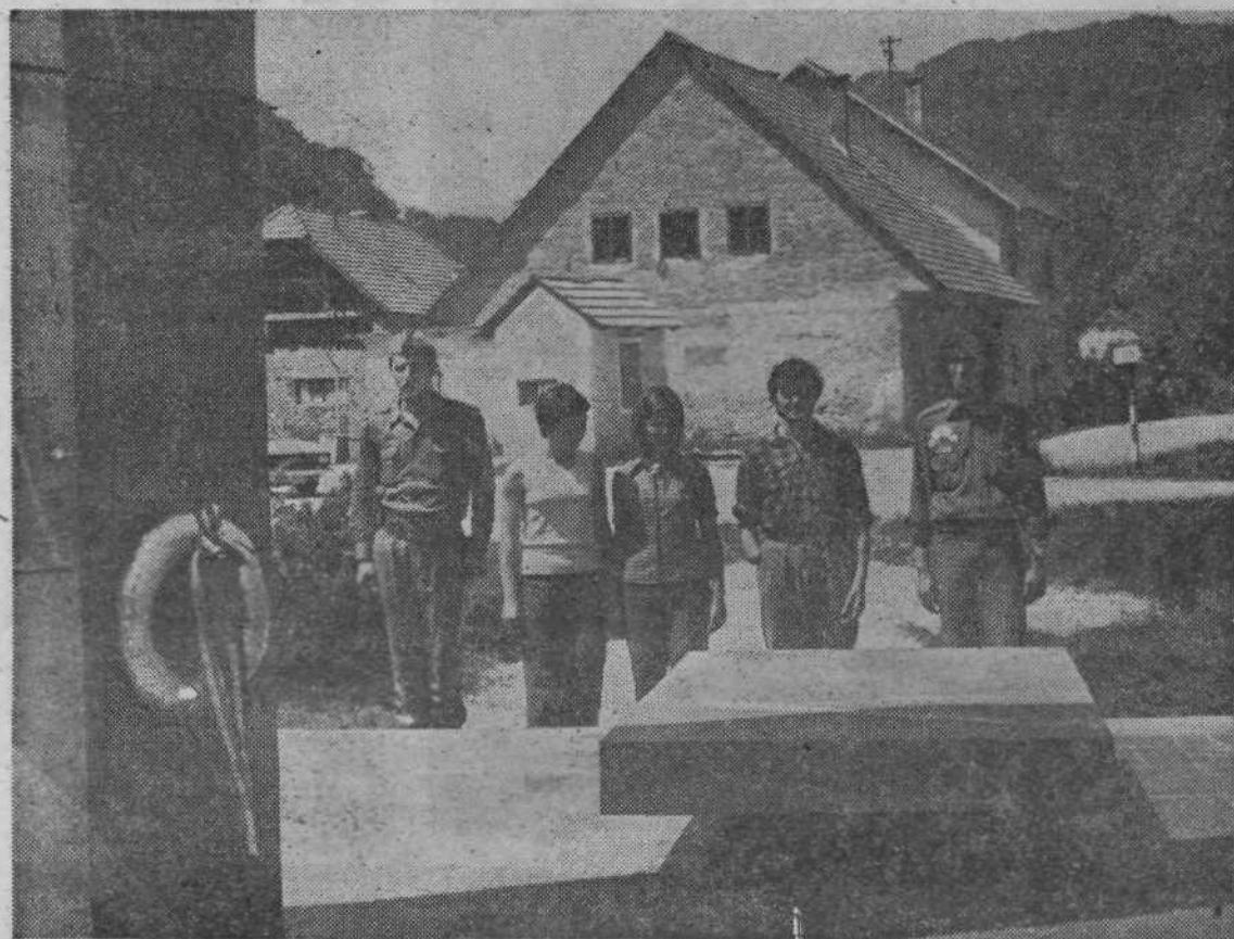
Počastitev spomina padlih borcev

Kot ena izmed oblik pomoči Kozjanskemu je tudi mladinska delovna brigada iz Centra, ki dela v Lesičnem.