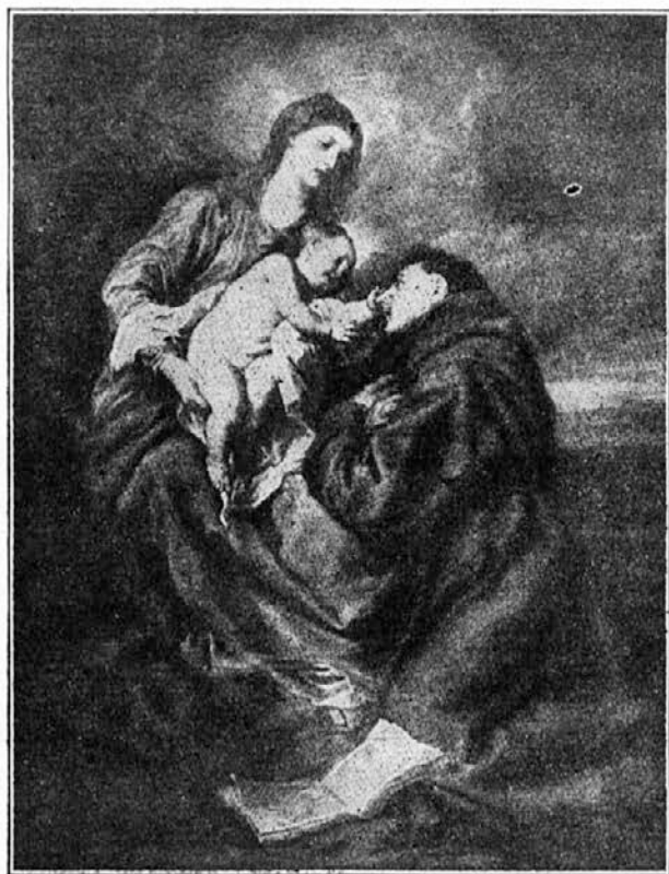
K nedolžnemu svetemu Antonu je prišel Jezusček.

Sveti oče Pij XI. je določil, naj traja 700letna proslava smrti sv. Antona Padovanskega od 13. junija lanskega leta do letošnjega 13. junija. Po celem svetu so se v tem času vršile velike slavnosti cerkvene, pa tudi izven-cerkvene.