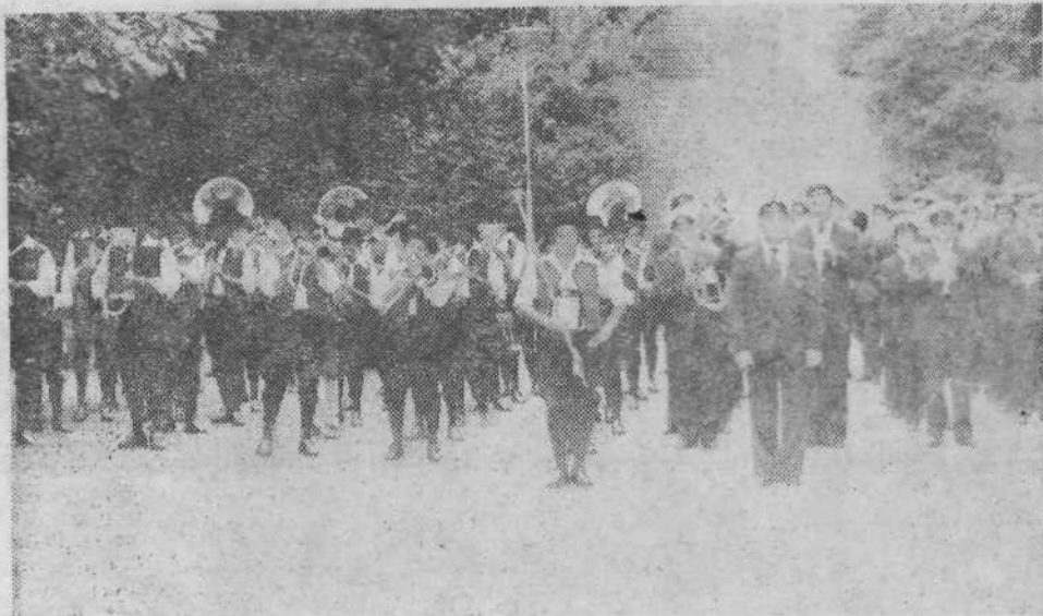
Poleg pogovorov o nadaljnem, še bolj plodnem sodelovanju, predvsem na področju gospodarstva, so se pomerili še v več športnih panogah. Pred razglasitvijo rezultatov pa so za vedro razpoloženje poskrbeli Planšarji.