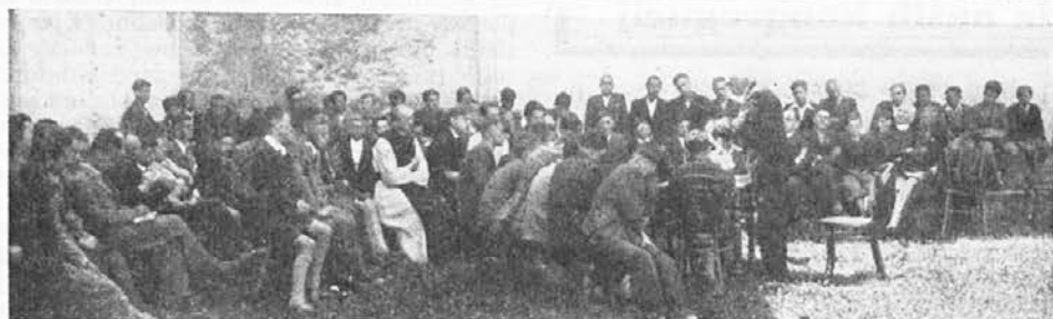
Prizor iz kongregacijskega zborovanja v Stični

in navdušenje za apostolat. Ko je bil sedanji papež še kardinal, se je mudil na počitnicah v Manzingenu v Švici, kjer je bilo ravno takrat veliko kongregacijsko zborovanje. Zaključka dne 22. okt. 1938 se je tudi sam udeležil in izjavil med drugim: »Božja Previdnost vam je naložila resne naloge v resnih časih. Vi ste KA v duhu Marijinem in poklicani, da zarezete nove brazde v njivo bodočnosti in da božji resnici pripravite uspešno žetev.« Po vsem svetu pa so odjeknile besede, ki jih je naslovil letos ob binkoštih na skupino Slovencev kardinal Pacelli že kot Pij XII., ko jih je pohvalil zaradi njihovega verskega življenja, katerega bujno rast je pripisovati predvsem češčenju presvetega Srca Jezusovega, Marijinim kongregacijam in Katoliški akciji. (Dalje.)