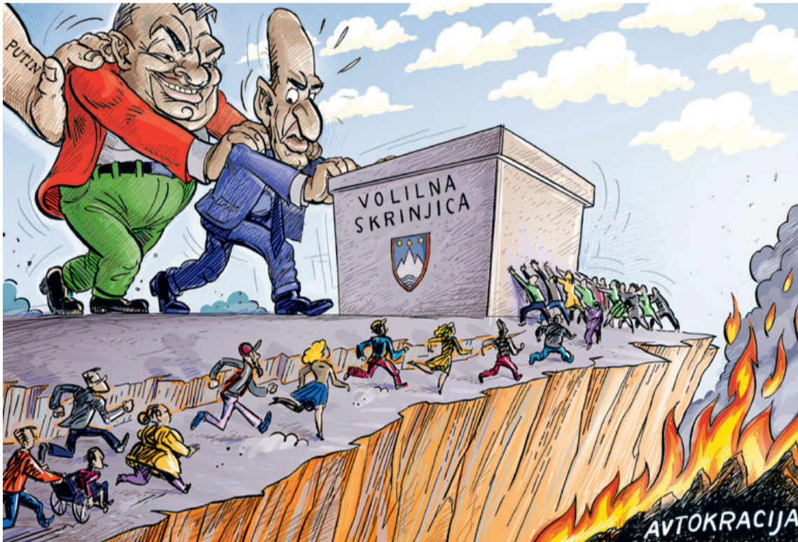
Vsi na volitve Ilustracija: Ciril Horjak

Ko se volivke in volivci, članice in člani ZZB, odločamo, kateri stranki ali državljski pobudi bomo dali svoj glas, premislimo, kdo spoštuje uporniško zgodovino Slovenije in dejanja Slovencev, ki so v času okupacije z zmagovitim bojem postavili temelje naši državi, in komu so blizu vrednote narodnoosvobodilnega boja, ki so hkrati tudi vrednote Evropske unije, Organizacije združenih narodov in drugih mednarodnih organizacij. Prav tako pogledajmo, katere stranke utemljujejo svoje delovanje na vrednotah protifašizma ter zavračajo laži, podtikanja in druge poskuse diskreditiranja narodnoosvobodilnega boja in Osvobodilne fronte.