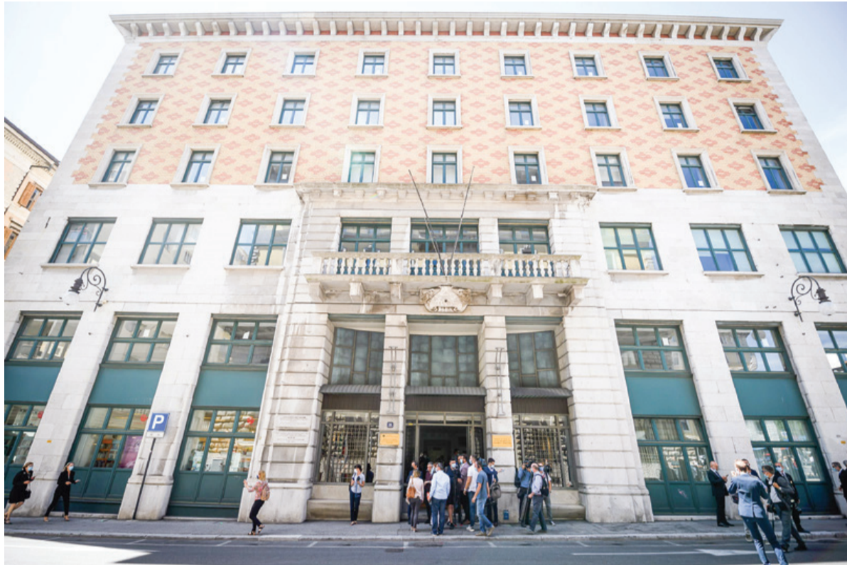
Narodni dom v Trstu spet v rokah Slovencev