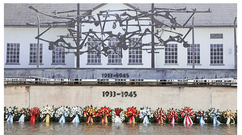
Nekdanje nacistično koncentracijsko taborišče Dachau je spremenjeno v muzej

reke Soče. 28. aprila 1945 so italijanski odporniki ustrelili fašističnega diktatorja Benita Mussolinija, njegovo truplo pa skupaj s trupli njegovih sodelavcev javno obesili. 29. aprila 1945 je ameriška vojska osvobodila koncentracijsko taborišče Dachau. Takoj po osvoboditvi je ameriška vojska ustrelila stražarje in pripadnike SS v taborišču, del stražarjev pa so ubili taboriščniki sami.