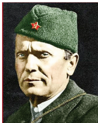
Josip Broz Tito