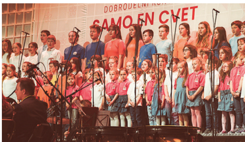
Nastopajoči so navdušili obiskovalce.