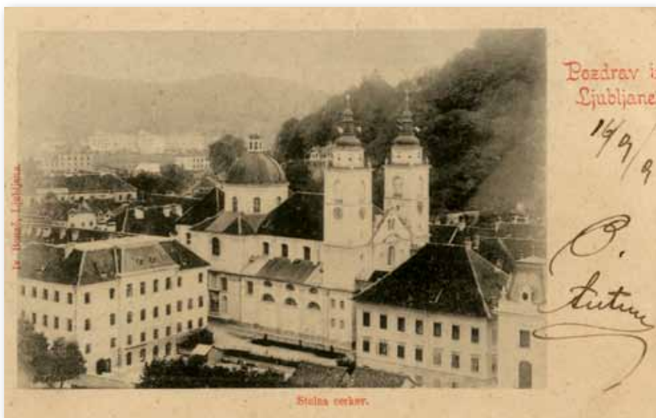
Stalna cerkev sv. Nikolaja in semenišče v Ljubljani na razglednici iz leta 1899.