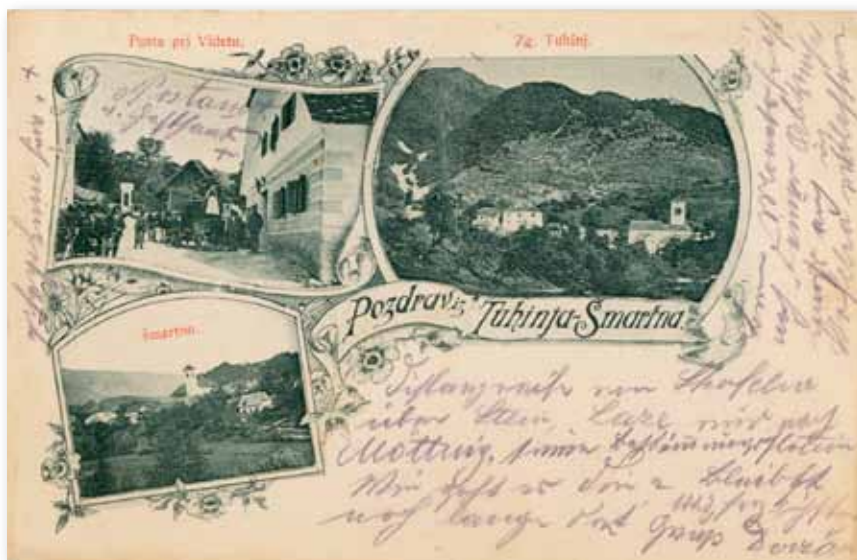
Šmartin/Šmartno v Tuhinjski dolini na začetku 20. stoletja.