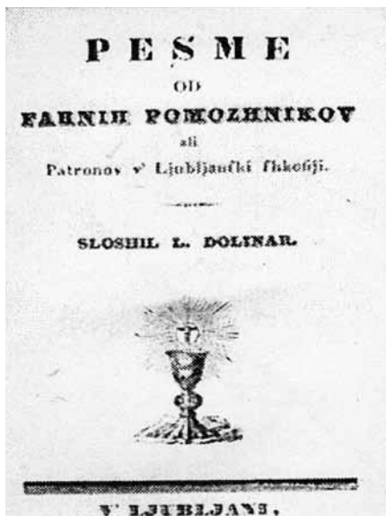
Naslovnica Dolinarjeve zbirke Pesme od farnih pomočnikov ali patronov v Ljubljanski škofiji, 1839.