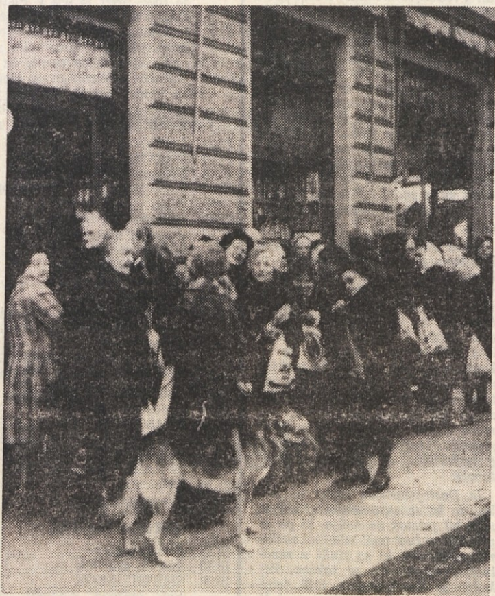
Gospodinjé čakajo na sladkor pred trgovino jestvin v Istrski ulici

Iz strahu pred podražitvijo bencina v Jugoslaviji je mnogo voznikov včeraj napolnilo tanke onstran meje