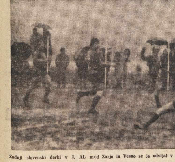
Zadnji slovenski derbi v 2. AL med Zarjo in Vesno se je odvijal v dežju in na slabem, razmočenem igrišču

Bor - Libertas Roccol A 3:0 (15:6, 15:2, 15:12). BOR: Kodrič, Požar, E. Kralj, Šišćević, Nadišek, Zerial, Košuta. ROCOL: Cimadori, Granieri, Marone, Rossmann, Vigni, Pinamonti, Luzzi, Micciché. SODNIK: Schiro. V prvem kolu povratnega dela mladinskega prvenstva je Bor osvojil nov par točk in tako se utrdil svoj vodilni položaj na lestvici. S prikazano igro so «plavi» zadovoljivi in so izpeljali nekaj zelo lepih ak-