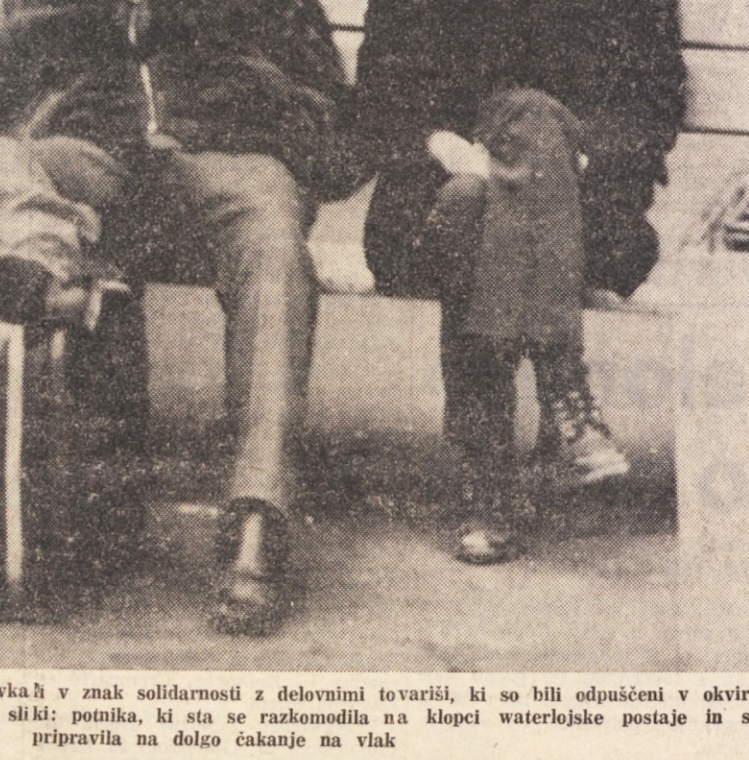
Britanski železničarji so danes stavkali v znak solidarnosti z delovnimi tovariši, ki so bili odpušteni v okviru varčevalnega vladnega plana. Na sliki: potnika, ki sta se razkomočila na klopi waterlojske postaje in se pripravila na dolgo čakanje na vlak

su partizanskega bojevanja, toda prav gotovo lahko trdimo, da so bile izgube obeh političnih in vojaških nasprotnikov v Južnem Vietnamu v lanskem letu približno enake. Po oceni strokovnjakov v svetu so znašale približno 60 tisoč mrtvih, kar je pravzaprav prevelik krvni davek v razdobju, ki bi moralo pravzaprav pomeniti začetek prepoveda v Južnem Vietnamu, začetek sporazumevanja med različnimi političnimi strankami ter sploh odločilen prehod iz razdobja vojne v fazo obnove gospodarstva, industrije, kmetijstva ter sploh vseh dejavnosti ki naj bi pomagale prebivalstvu, da si po praktično tridesetih letih in še več vojne ustvari normalno življenje.