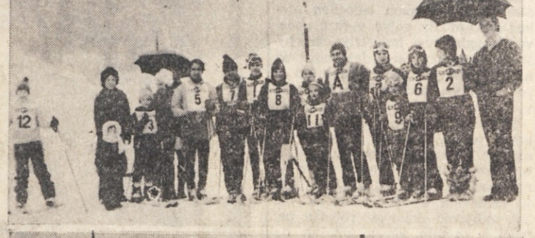
Dva posnetka z nedeljskega tekmovalje KK Devin — Štivan pri Črnem vrhu nad Idrijo

V četrtfinalu košarkarskega tekmovalje za pokal prvakov je CSKA iz Sofije premagala na domačem terenu jugoslovansko Crveno zvezdo z 88:81 (42:45). V istem tekmovaljeju je v Brnu Zbrojevka Brno premagala Steauro iz Bukarešte s 96:85 (54:35). V tekmovaljeju za Korčevski pokal pa je v četrtfinalu italijanski Ingegniti premagal Villeurbane s 64:59 (22:29).