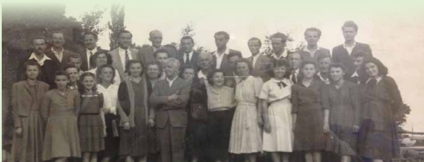
KPD Bazovica leta 1947