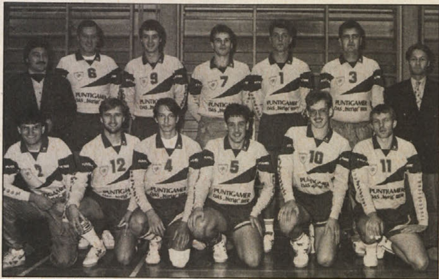
Zmagovita ekipa in vodstvo SK Dob/Aich