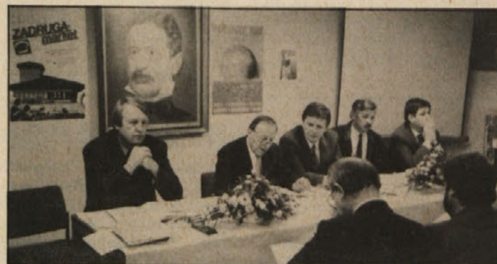
Predsedstvo občnega zbora ZSZ