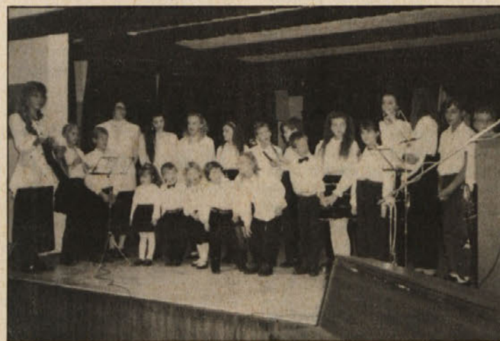
Na radiški prireditvi so nastopili tudi najmlajši