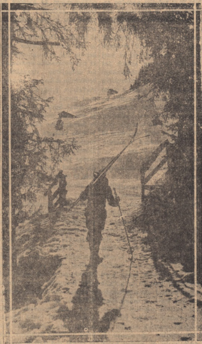
SMUCAR NA PLANINSKI POTI

Končno izreka sedmi slovenski socialni dan polno priznanje in oplo zahvalo vsem tistim, ki v okviru naše izseljenske skupnosti z največjimi osebnimi žrtvami pripravljajo, poučujejo in združujejo tečaje za slovenski mladino, da bi bila vzgojena v vestobi Bogu in svojemu slovenskemu narodu.