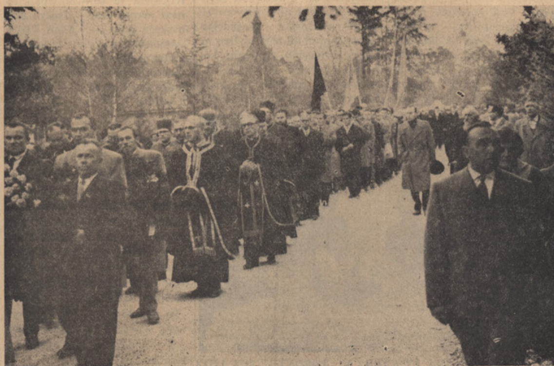
POGREB UKRAJINSKEGA VODITELJA G. S BANDERE