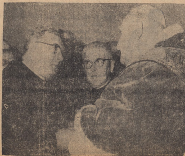
PAPEZ JANEZ XIII. MED BENEDIKTINSKIMI OPATI V RIMU