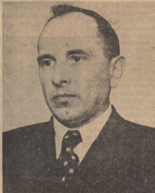
† STEFAN BANDERA

Hon. Leslie M. Frost, Q.C., LL.D. PRIME MINISTER