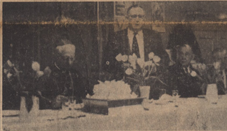
CASNI GOST V MONTREALU