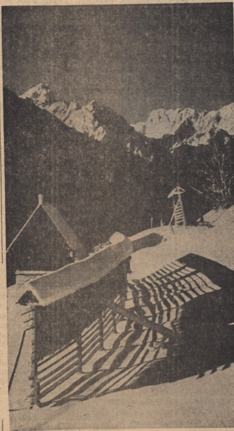
SLOVENSKA ZIMSKA IDILA