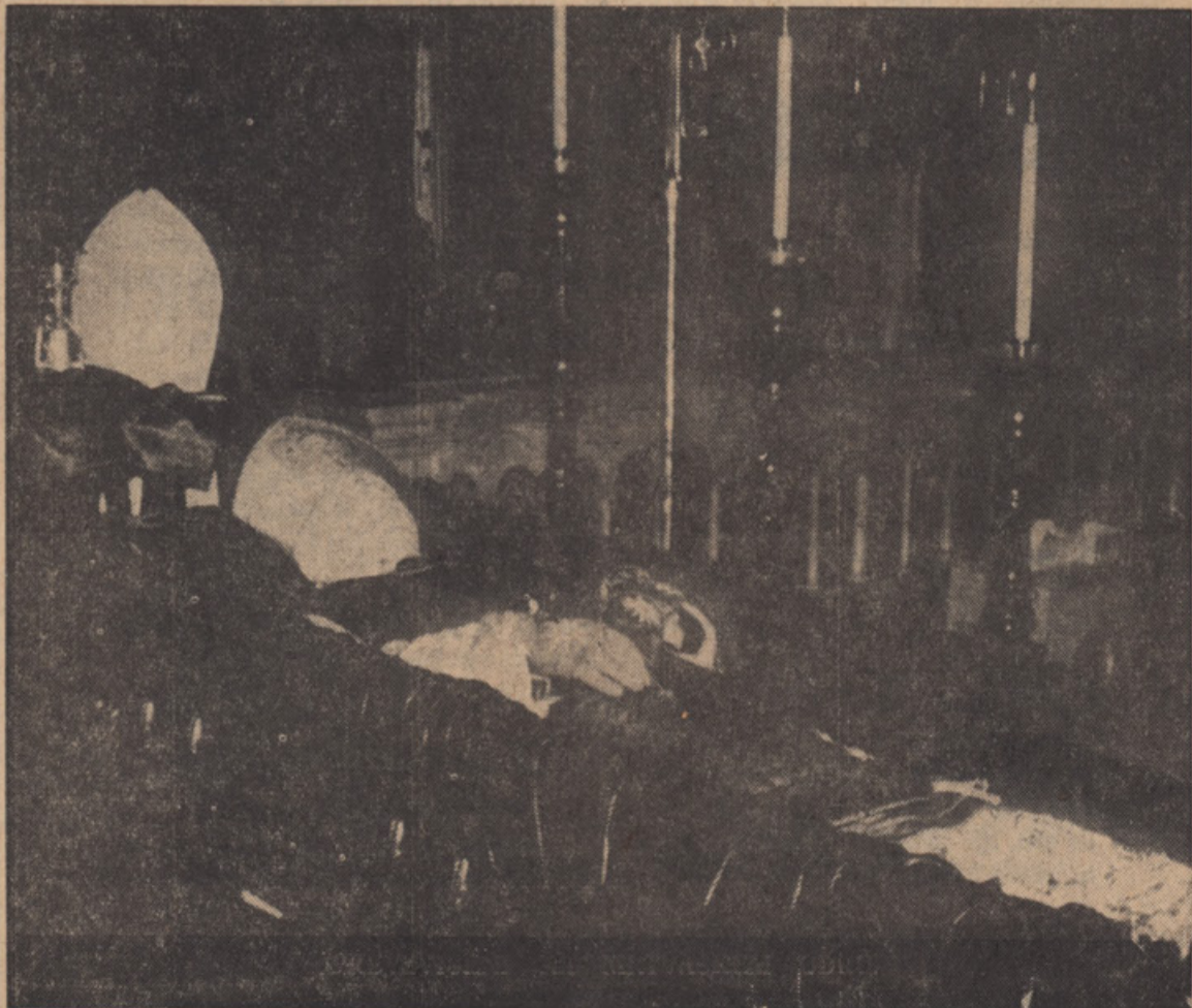
PREZVIZIŠENI NA MRTVASKEM ODRU.