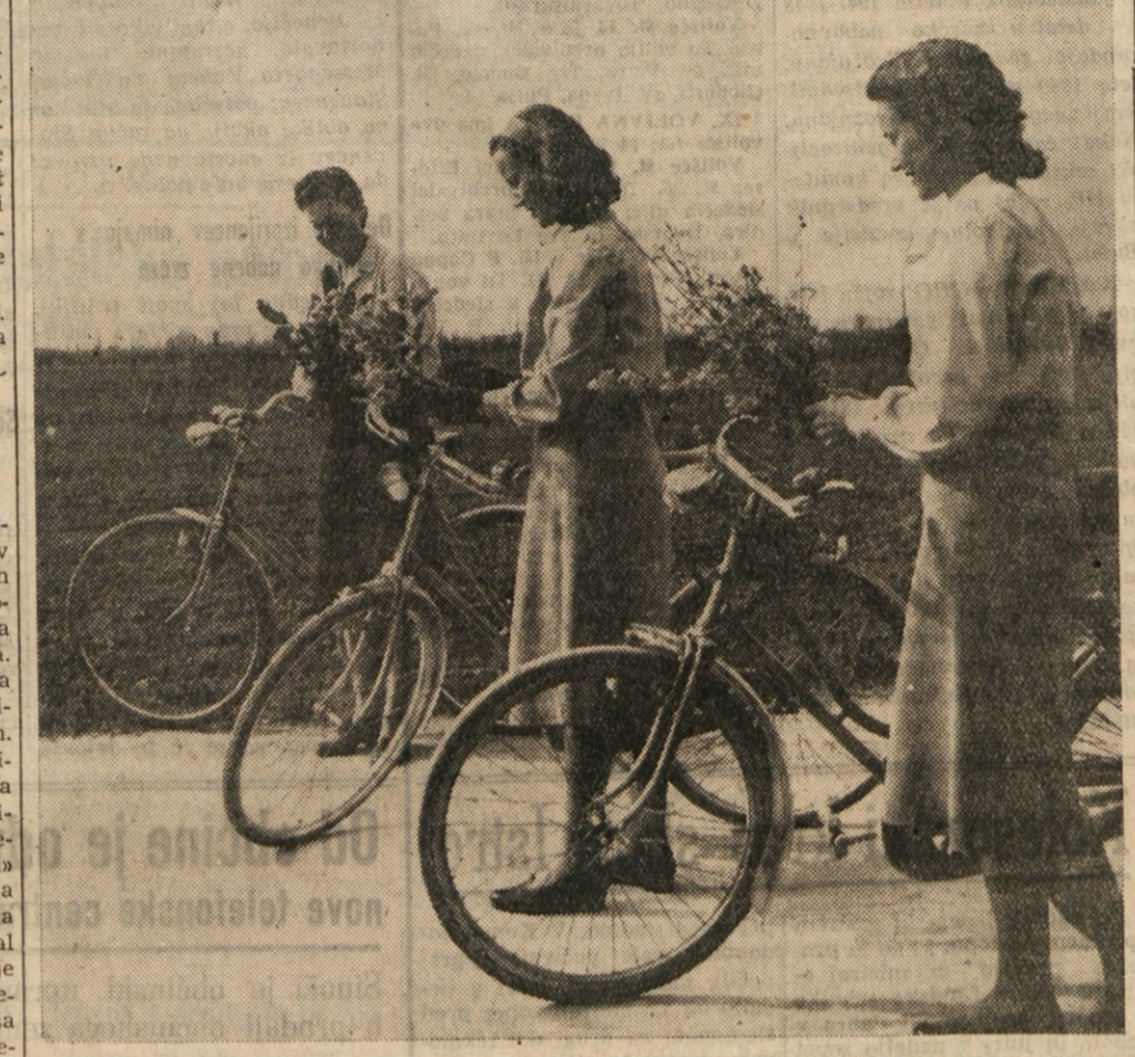
SPOMLADANSKO SONCE S SVOJIMI TOPLIMI ŽARKI IN PREBUJAJOČA SE NARAVA STA ZVABILA NA IZLET TUDI TE TRI ZADOVOLJNE KOLESARKE