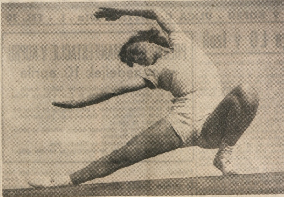
TELOVADKA MISCOLIN LILI SE VESTNO PRIPRAVLJA ZA 1. MAJ, NA SLIKI JO VIDI-MO MED TRENINGOM NA GREDI