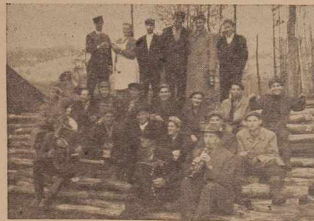
Zadnjega dne minulega leta so pričakali izmeno rudarjev v Presiki godci, kot vidi na sliki. Rudarji Presike so lahko ponosni na minulo leto, saj so presegli letni plan proizvodnje za 500 ton premoga.