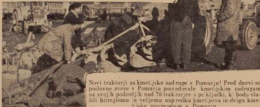
Novi traktorji za kmetijske zadruge v Pomurju! Pred dnevi so poslovne zveze v Pomurju posredovale kmetijskim zadrugam na svojih področjih nad 70 traktorjev s prključki, ki bodo služili hitrejšemu in večjemu napredku kmetijstva in dvigu kmetijske proizvodnje v Pomurju.

industrijskimi vejami (elektroindustrija 1,1%, lahka industrija 2,4%). Prav tako so v letu 1959 predvidene predpriprave za začetek gradnje novega obrata teške konfekcije pri Tovarni perila Mura v Murski Soboti. V zaključni fazi izdelave je tudi investicijski program obrata sadnih in grozdnih sokov ter koncentratov. Poleg navedenih objektov, pa druž-