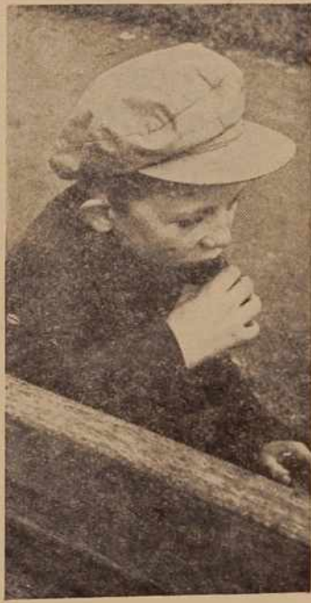
Med — dobra jed! Poskusite tudi vi!