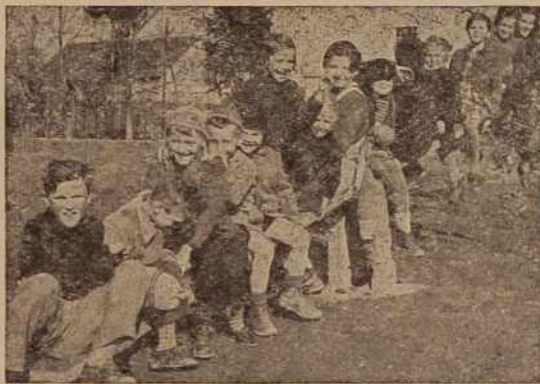
Ljutomerska mladež pomladi na svojem igrišču