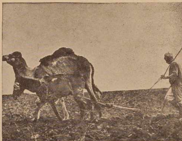
Sudanski kmet pri delu

Jugoslavija je že navezala stike s Ceylonom, toda kaže, da je mogoče gospodarske stike med obema deželama še razširiti. Ceylonsko tržišče je za naša izvozna in uvozna podjetja še vedno novo.