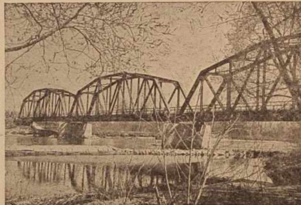
Železniški most čez Muro pri Verzeju

Precej dolgo pa so se ustavili člani SZDL v razpravi ob vesteh, da bodo ukinitvi železniško postajo oziroma jo