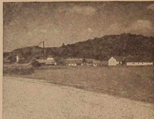
Grad — sedež kmetijske zadruge

pričakujejo, da bo letos znatno več pogodb za pridelovanje hibridne koruze kot lani. Lanski poizkusi so namreč zelo uspešni. S sklepanjem pogodb so že pričeli. Predvidevajo, da bodo sklenili pogodbe za 360 ha. Poslovna zveza je poskrbela za to, da bo dovolj semena in dovolj potrebnih umetnih gnojil. Pričeli so tudi že z globokim oranjem. Traktorji so v polni meri zaposleni, a v nekaterih zadrugah jih celo primanjkuje.