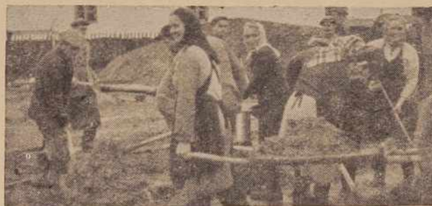
Začetek izgradnje gasilskega doma v Krogu