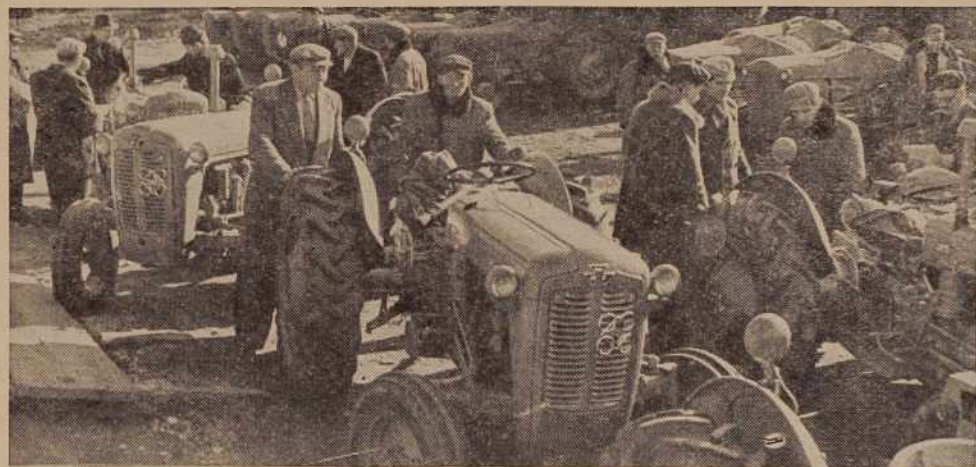
Izpopolnjevanje naše agrotehnične nudi organizacijam LT obilo hvaležnega in koristnega dela. To so poudarili tudi na nedavni razširjeni seji Okrajnega odbora SZDL za Pomurje. Na sliki: prevzem traktorjev s priključki na sedežu soboške poslovne zveze