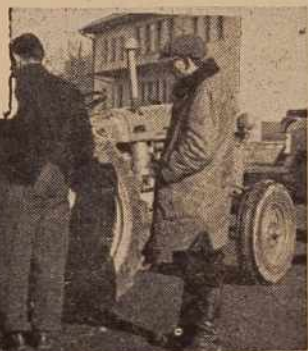
Novi traktorji za kmetijske zadruge v Pomurju! Pred dnevi so poslovne zveze v Pomurju posredovale kmetijskim zadrugam na svojih področjih nad 70 traktorjev s prključki, ki bodo služili hitrejšemu in večjemu napredku kmetijstva in dvigu kmetijske proizvodnje v Pomurju.

Dne 4. in 5. februarja bodo izredne predstave filma o VII. kongresu ZKJ za šolsko mladino po znižani ceni 30 dinarjev. Vodstva osnovnih, srednjih in vajejskih šol naj pošljejo svoje prijave upravi kina. Opozorjamo občinstvo, da bodo predvajali poleg glavnega filma tudi dokumentarna filma »Tovarne delavcem« in »Korak s časom«.