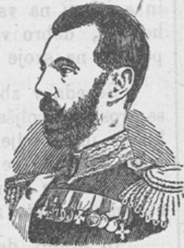
Veliki knez Sergius.

bival v Moskvi kot tamošnji guverner. Dne 17. p. m. se je peljal proti justični palači. Ko se je voz bližal justični palači, prišle so mu nasproti sani, v katerih sta sedela dva moža. Eden od njih bil je oblečen v delavsko obleko. Ravno pri justični palači se je vrgla bomba pod voz velikega kneza. Voz je bil popolnoma razdrobljen. Konja sta bila nepoškodovana in sta odbežala. Veliki knez je bil mrtev. Glava in nogi bile so mu takoj odtrgani. Kučijaš je vsled opeklina na potu v bolnišnico umrl. Morilce je policija prijela. Eden izmed njiju je vsiknil, ko so ga prijeli: „Meni je vse edno, moje delo je končano!“