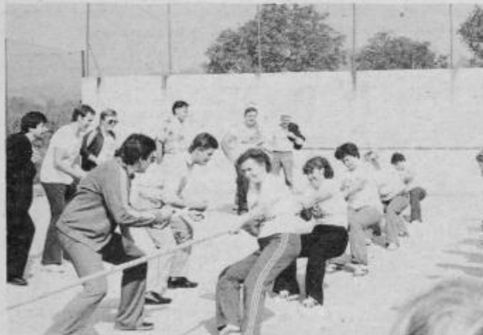
Vlečenje vrvi — priljubljena disciplina takšnih srečanj