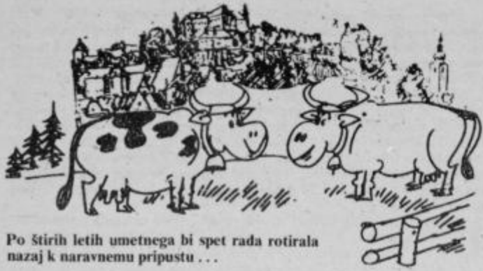
Po štirih letih umetnega bi spet rada rotirala nazaj k naravnemu pripustu ...