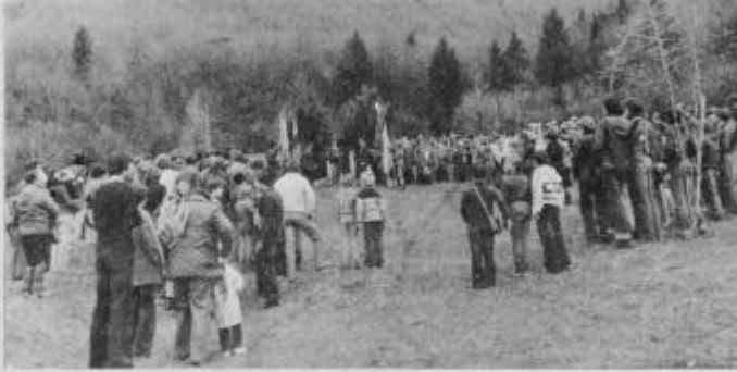
Srečanja planincev na Boču so vedno dobro obiskana.

V nedeljo 13. septembra so ljubitelji planin, katerih v Poljčanah in širši okolici ni malo, proslavili Dan planincev. Zbrali so se na Boču pri svojem planinskem domu, na katerega so še posebej po njegovi obnovi nad vse ponosni, saj jim je to drugi dom. V njega so vložili in še vlagajo svoj prosti čas pa tudi delovne moči, saj skoraj ni tedna v katerem ne bi planinci iz Poljčan in okolice poskrbeli za