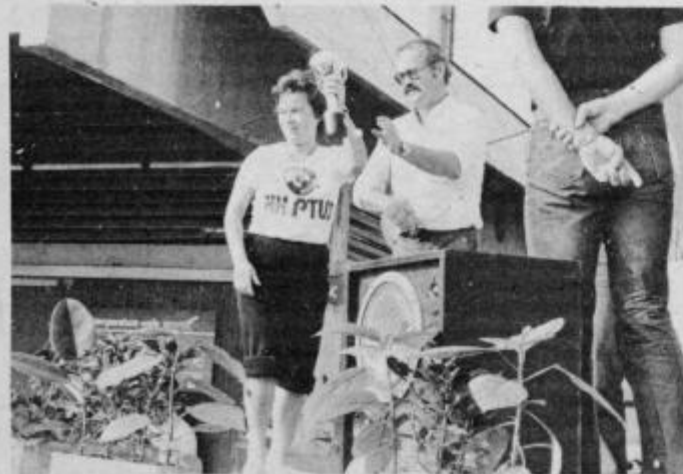
Ptujski ekipe nista ostali brez prvih mest — pr. ženskah je zmagala vrsta Kmetijskega kombinata Ptuj.