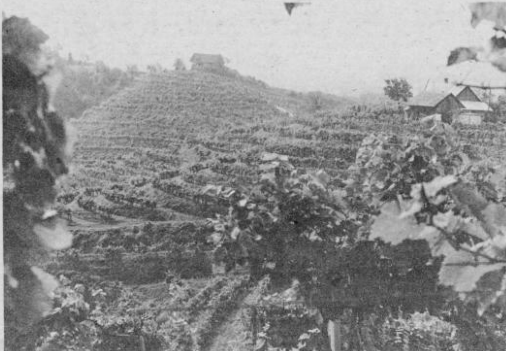
Vinogradi naj še nekaj dni počakajo

Pri ustreznih sladkornih stopnjah, ki jih bo grozdje doseglo šele po prvem oktobru (gre za sladkorno sopenjo 15 do 18 odstotkov), so