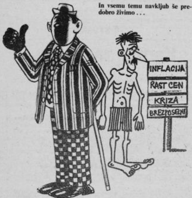
In vsemu temu navkljub še pre-dobro živimo ...