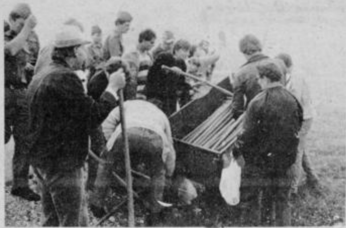
Gneča ob razdeljevanju orožja brigadirjem.

Člani kluba brigadirjev Franc Belšak — Tone iz Ptuja so letos zares dokazali kaj zmorejo. V soboto 19. septembra so nadvse uspešno izvedli že svoj šesti udarniški dan v letošnjem letu. Mimogrede povedano, to je že njihov 16. udarniški dan od ustanovitve kluba.