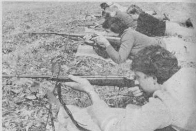
Streljanje z malokalibersko puško.