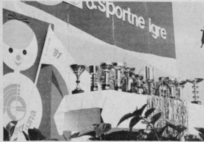
Veliko disciplin, veliko nastopajočih in veliko medalj in pokalov.