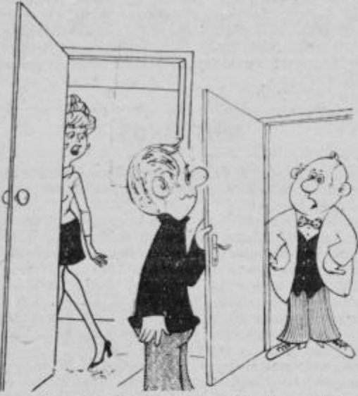
Oprostite sosed, tu neka mlada tovarišica išče starega plešastega bedaka. Ali ste morda to vi?