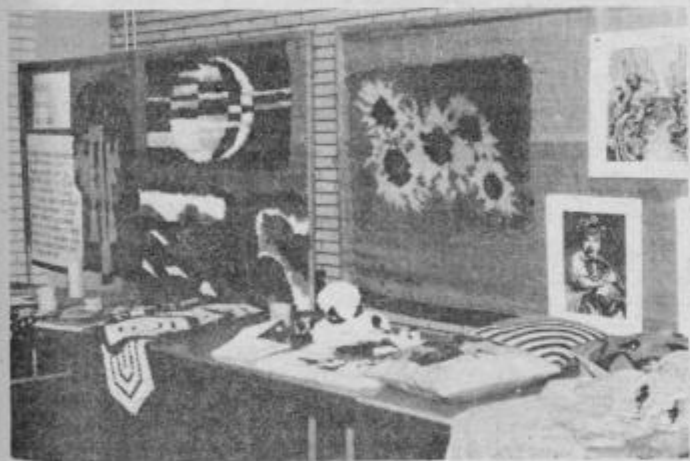
Razstavljeni predmeti so zelo različni, od tapiserij, prtičkov do raznih risb in lesenih predmetov.

V počastitev mednarodnega leta invalidov so v Zavodu za varstvo in delovno usposabljanje mladine dr. Marijana Borštnarja v Dornavi pripravili za širšo javnost razstavo izdelkov srednje prizadete mladine iz delovnega usposabljanja. V četrtek 17. septembra so razstavo odprli v avli Centra srednjega usmerjenega izobraževanja v Ptuj, kjer so svoje