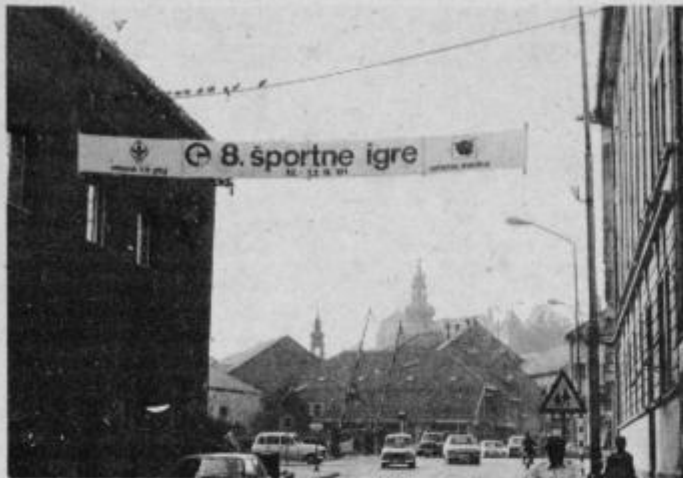
Igre je bilo v Ptuj čutiti na vsakem koraku