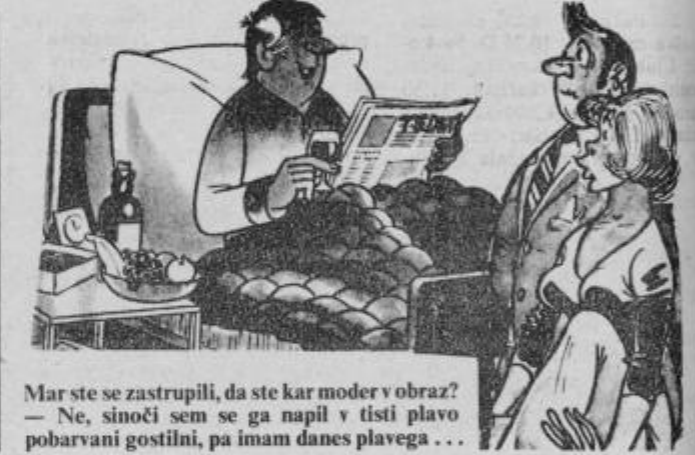
Mar ste se zastupili, da ste kar moder v obraz? — Ne, sinoči sem se ga napil v tisti plavo pobarvani gostilni, pa imam danes plavega ...